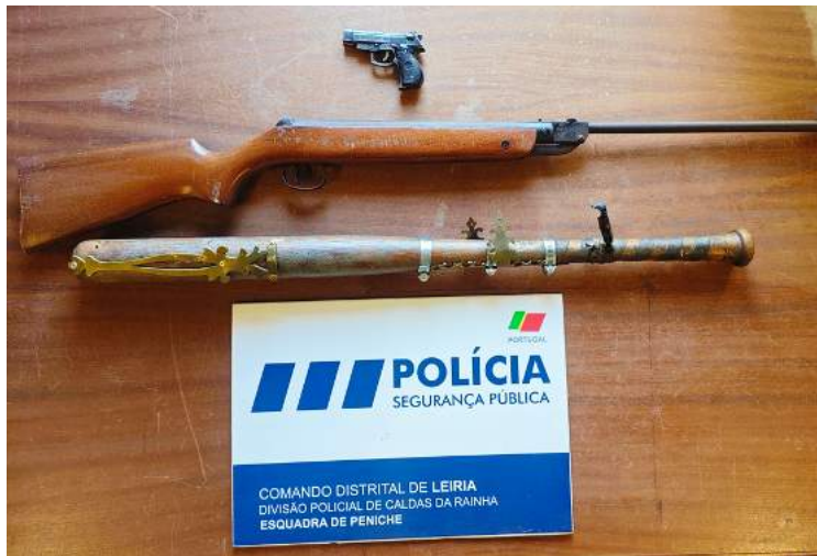
Objetos perigosos do suspeito

A PSP desenvolveu a investigação no sentido de chegar à identificação do suspeito, o que conseguiu, tendo realizado buscas domiciliárias e não domiciliárias no concelho da Lourinhã que