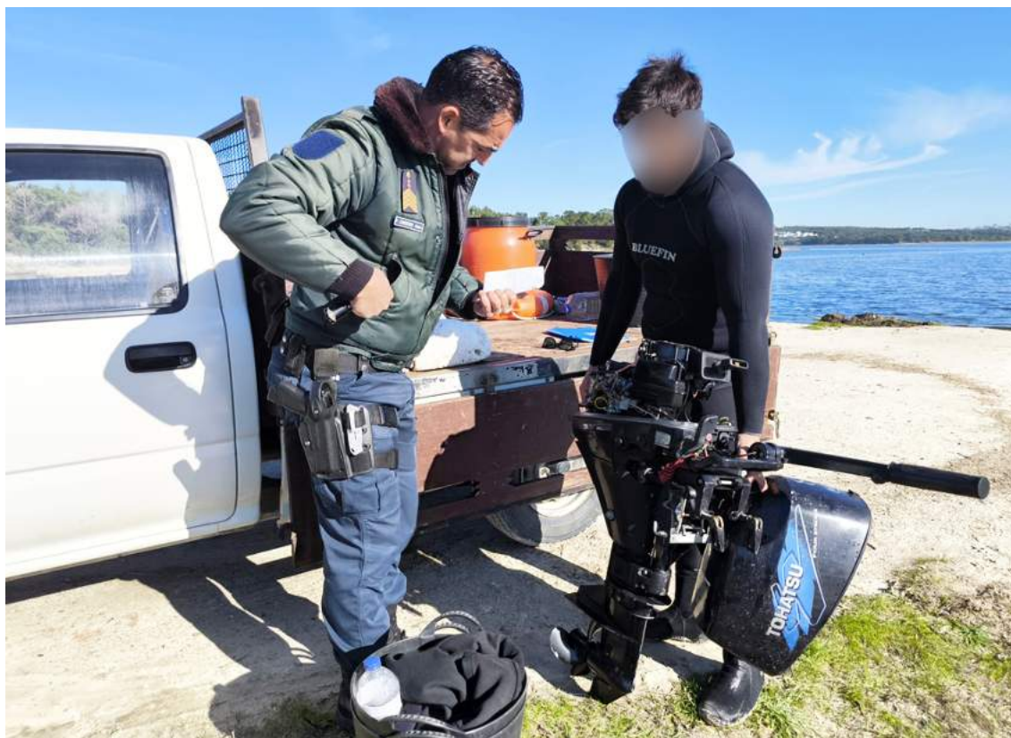
Embarcações, pescadores e apanhadores foram fiscalizados

A Polícia Marítima de Peniche realizou no dia 26 de novembro uma ação de fiscalização dirigida à prática da atividade da pesca na Lagoa de Óbidos, que resultou na elaboração de dois autos de contraordenação.