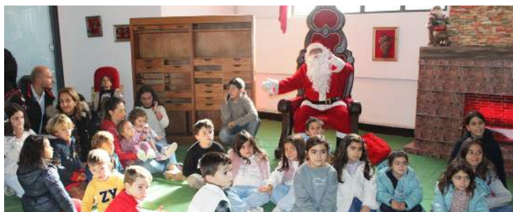
Na Casa do Pai Natal