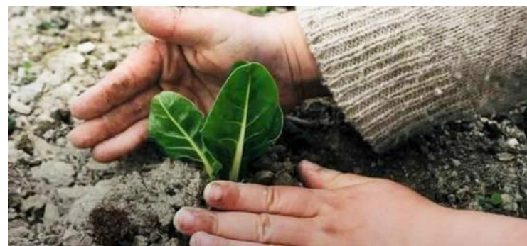
O Plantar Amor pretende ser mais do que uma ação ecológica, é um gesto de união

O programa contempla ainda a apresentação do Ashram e do projeto “O Ashram e a Serra do Montejunto”. Às 10h30 é o início da plantação. Depois do almoço é a continuação da plantação e curiosidades sobre bonsais.