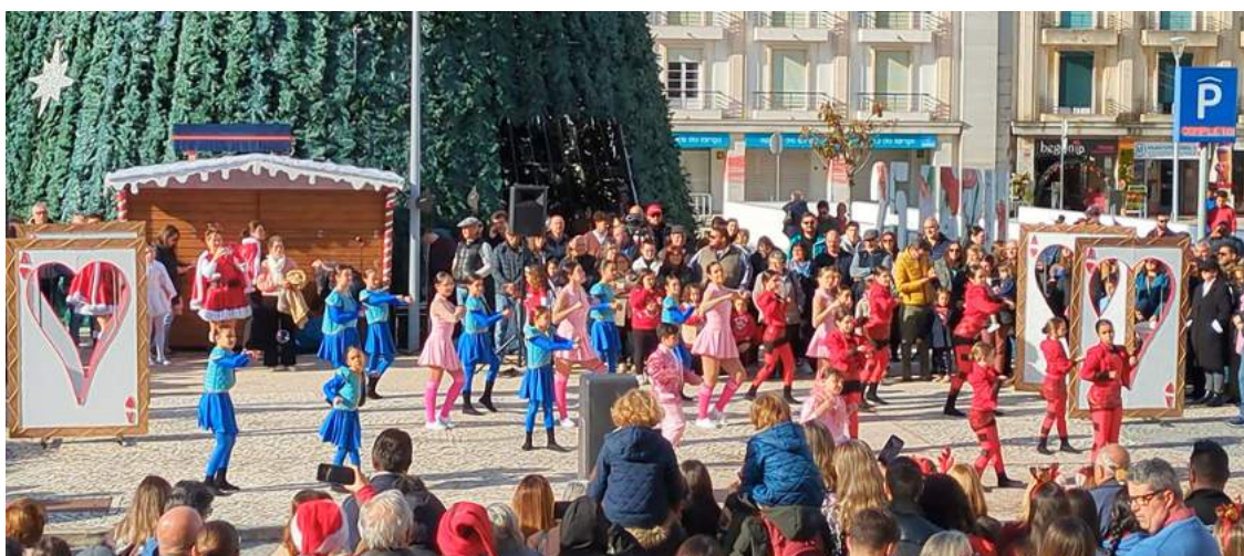
Uma das atuações