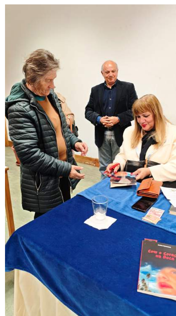
A autora deu autógrafos