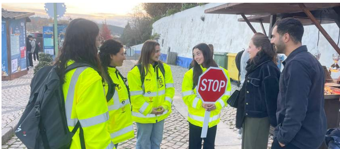
Jovens da ANSR a promover condução responsável na Vila Natal