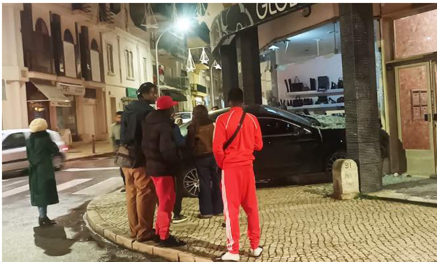
O aparato suscitou a curiosidade de transeuntes