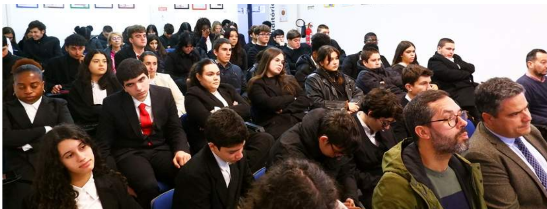
Alunos aprenderam mais sobre o azeite

sistida por dezenas de alunos e professores, a turma de Gestão e Produção de Cozinha, apoiada pela turma de Gestão de Restauração e Bebidas, serviu, no restaurante da escola, um menu dedicado inteiramente ao azeite.