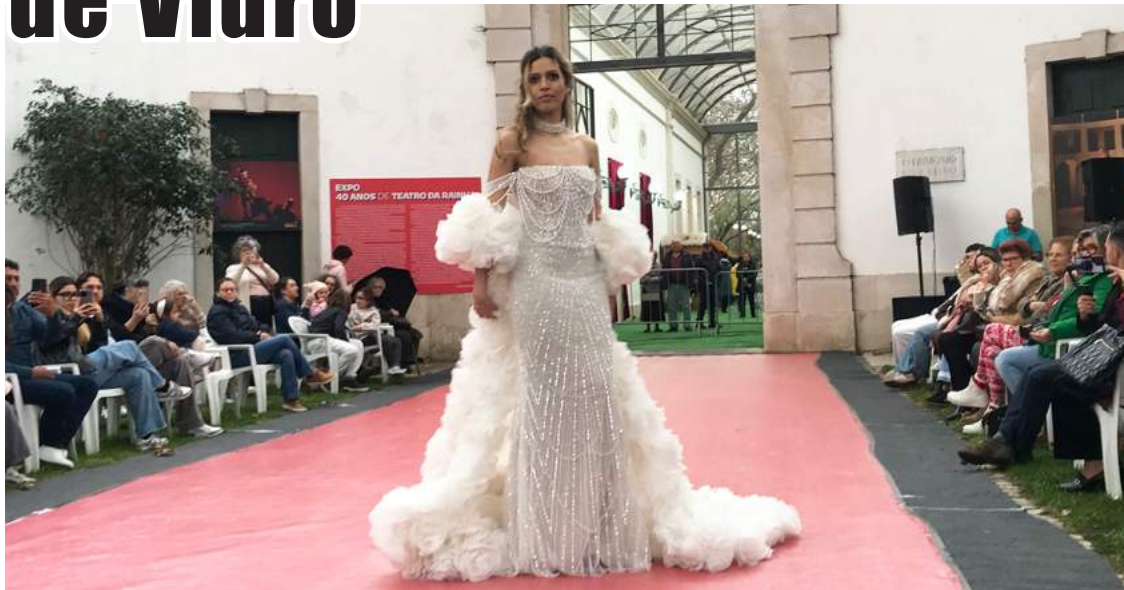
Cinquenta vestidos de casamento e de gala desfilaram pela passarela

O Edite Norte Ateliê funciona na Rua Heróis da Grande Guerra, nas Caldas da Rainha.