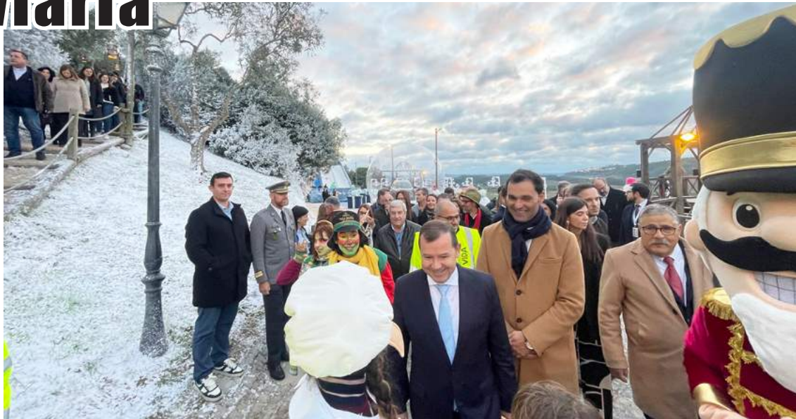
Inauguração da Vila Natal com a presença do secretário de Estado da Proteção Civil

“É um gosto enorme ter conosco uma figura do Governo, um amigo do nosso concelho”, salientou.