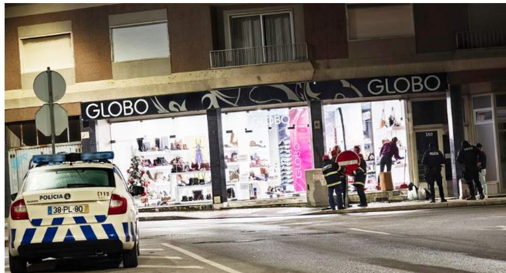
Os bombeiros repuseram o sinal de trânsito que tinha sido abalroado