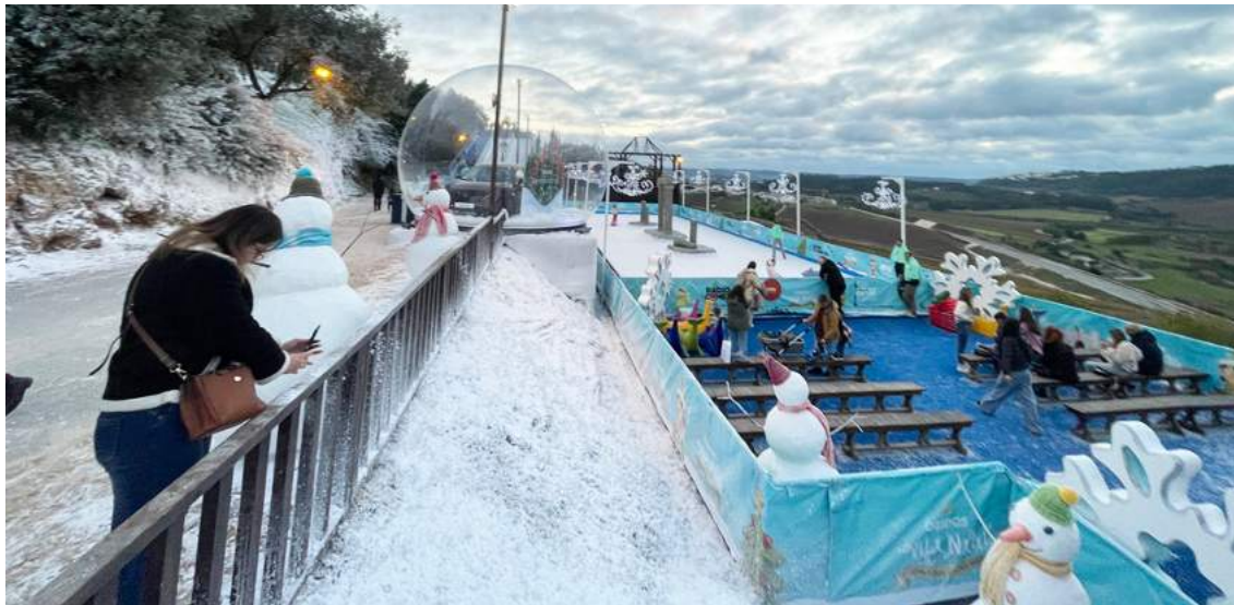
Muita neve e animação na Grande Fábrica do Natal