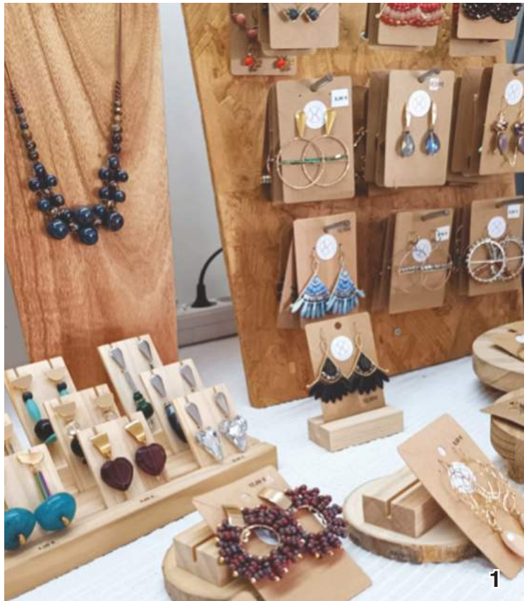
1. Algumas das peças à venda

O evento já está na sua 9ª edição, sendo um mercado feito de dedicação, em que o artesanato é amor e cada trabalho leva em si um pedacinho de quem o faz.