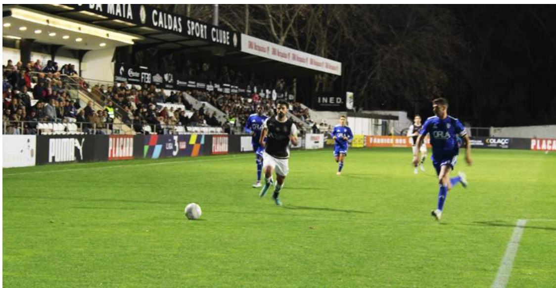
Caldas ao ataque