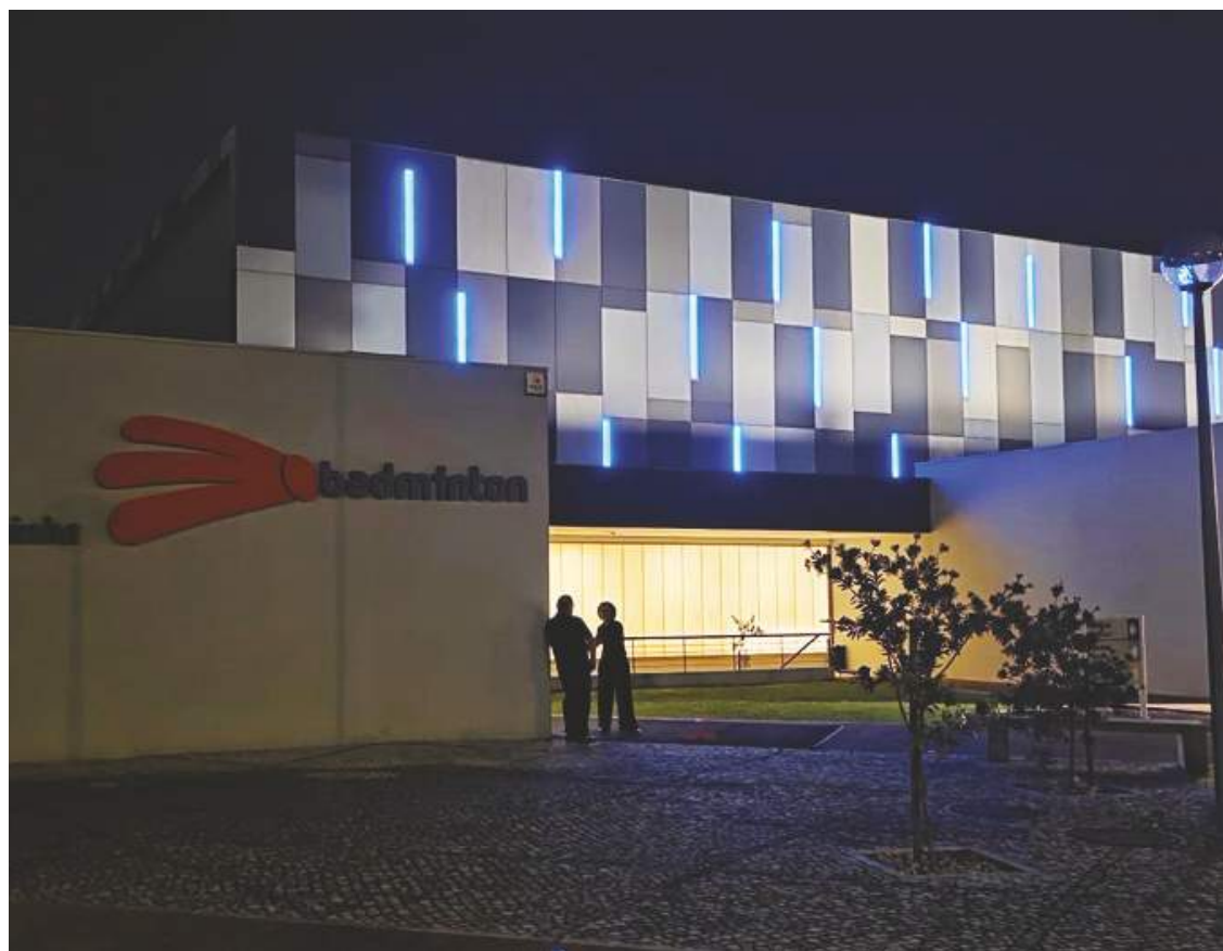
O Centro de Alto Rendimento de Badminton Joaquim José de Oliveira Lopes, nas Caldas da Rainha, iluminou-se de azul

Não se deve ignorar os sintomas, mas sim consultar um médico para avaliação e acompanhamento, especialmente se tiver histórico familiar da doença.