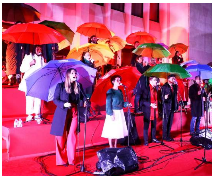
Mesmo com chuva o espetáculo não parou