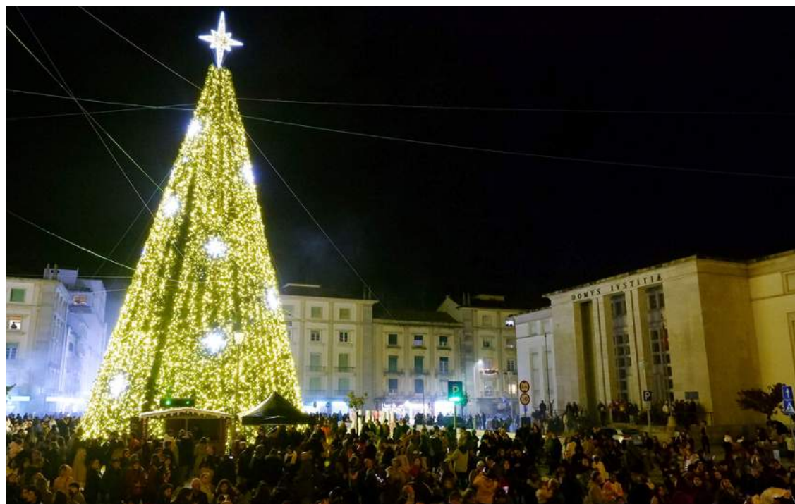
A árvore de natal gigante deste ano

O momento foi menos emocionante do que em anos anteriores, uma vez que não houve a tradicional contagem, mas mesmo assim foram muitas as pessoas que assistiram emocionadas e depois ficaram no local a tirar fotografias.