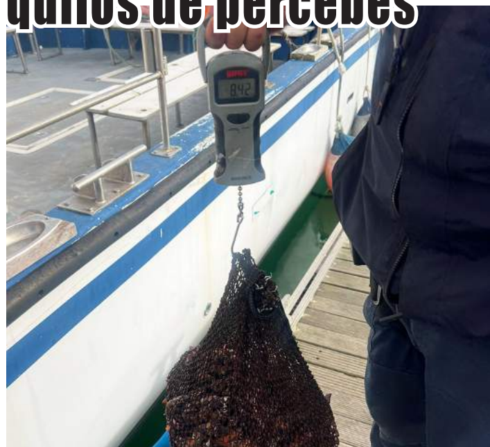
O marisco apreendido foi, posteriormente, vendido em lota

A Polícia Marítima de Peniche apreendeu na passada sexta-feira cerca de oito quilos de percebes, durante uma ação de fiscalização dirigida à prática da atividade da pesca, no porto de Peniche.