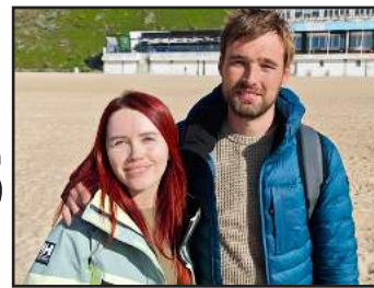
O casal que ia no veleiro

O veleiro “Spiral of Life”, com um casal a bordo, encalhou na madrugada da passada segunda-feira na praia da Nazaré. Os tripulantes, que escaparam sem ferimentos, dizem terem sido surpreendidos por um ataque de orcas, situação que está a ser investigada.