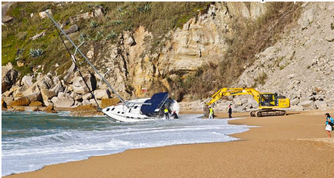
O barco encalhou junto à praia

Na sequência de um alerta recebido pelas seis e meia da manhã, foram de imediato ativados