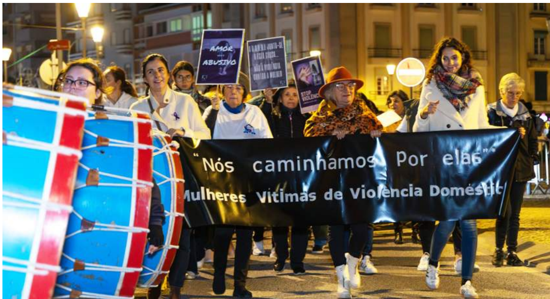
Caminhada nas Caldas que assinalou o Dia Internacional para a Eliminação da Violência Contra a Mulher

A vereadora destacou ainda um dado simbólico da sessão, que contou com cerca de 30 participantes e a “presença de apenas um homem, contratado para registar a sessão como fotógrafo”. “Ainda assim, este é um espaço essencial para as mulheres falarem sobre a realidade da violência. Muitas pessoas deveriam estar aqui, mas não têm motivação para participar. É importante recordar que a violência doméstica