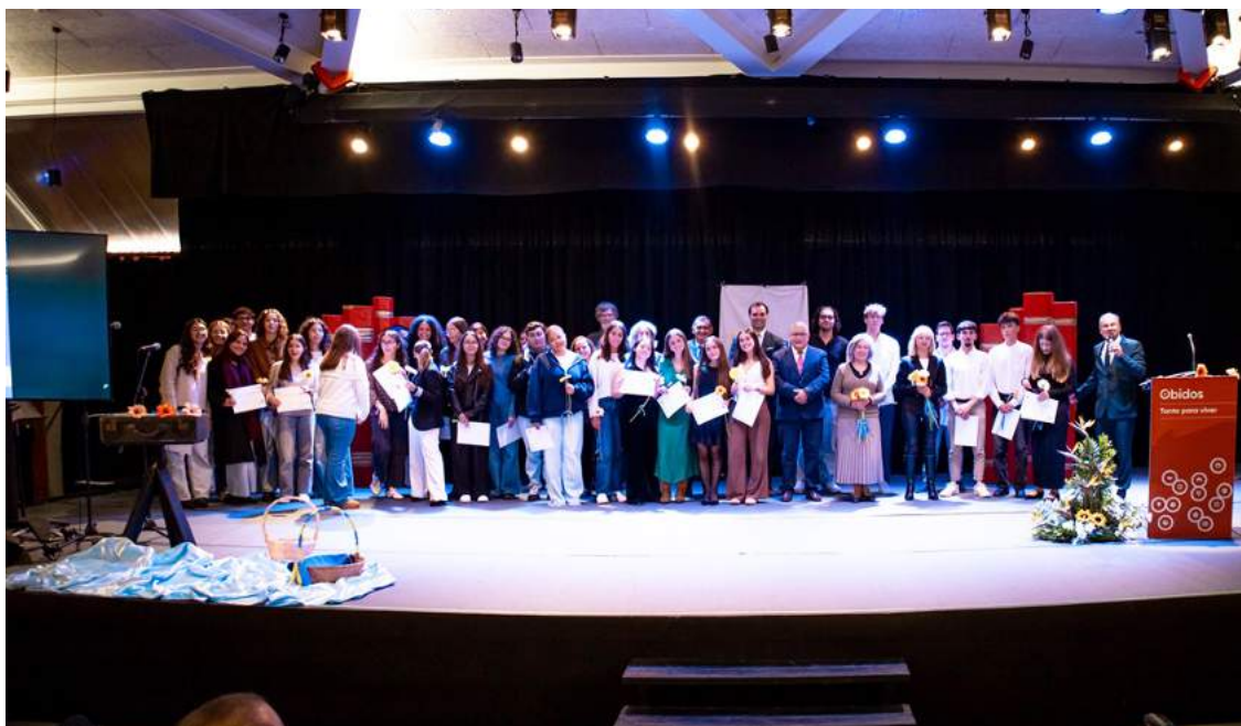
Agrupamento assinalou entrega de diplomas aos que terminaram o ensino secundário