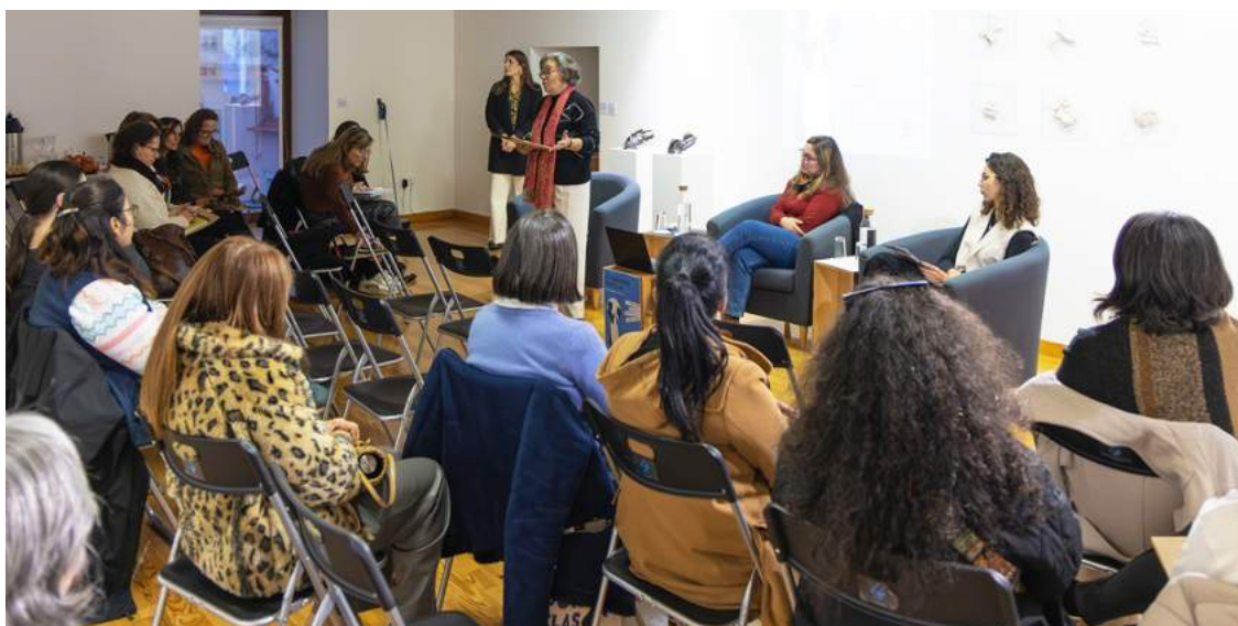
A tertúlia procurou fomentar uma reflexão profunda sobre violência, discriminação e discursos de ódio

tica não é apenas de homens sobre mulheres, há também casos entre mulheres, em idosos ou mesmo em casais onde as mulheres exercem violência sobre os homens. Mas evidenciamos a violência contra as mulheres porque os números que temos não mentem e no contexto familiar e conjugal, é uma realidade grave e persistente”, contou.