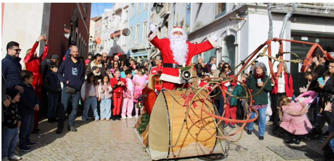
Pai Natal no trenó

Centenas de crianças e as suas famílias preencheram as ruas durante o percurso, não só para assistir à passagem do Pai Natal e dos figurantes, mas também para fazer o registo fotográfico do momento.