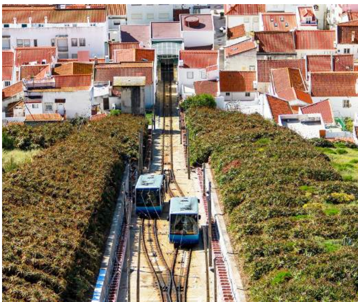
A circulação foi retomada depois de solucionado o problema

O Ascensor da Nazaré esteve sem funcionar devido a uma avaria na passada segunda-feira, resolvida no dia seguinte, segundo anunciaram os Serviços Municipalizados daquele concelho.