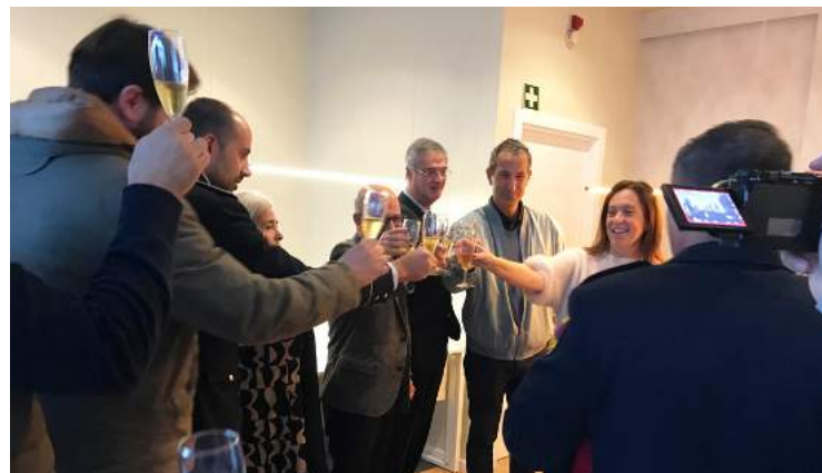
Convidados brindaram em comemoração dos 18 anos da empresa