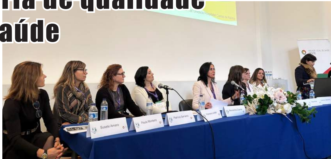
Foi um dia dedicado à partilha de conhecimento, reflexão e valorização da profissão de enfermagem