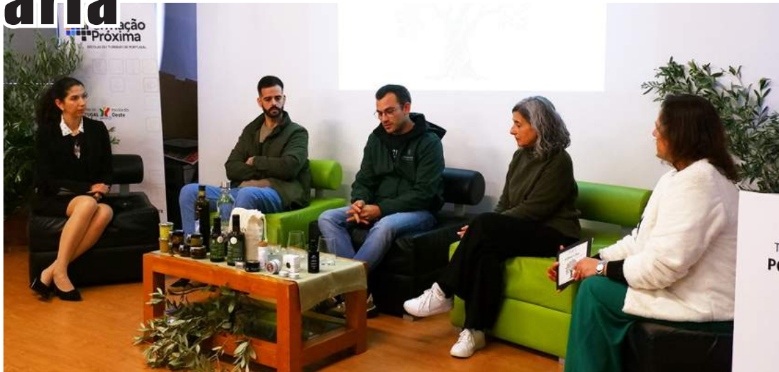
Mesa-redonda sobre “Olivoturismo, Inovação e Bem-Estar”