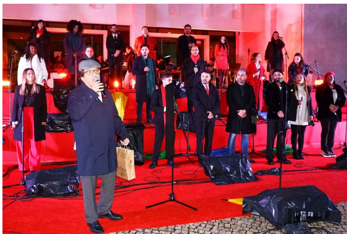
O presidente da Câmara incentivou as compras no comércio local