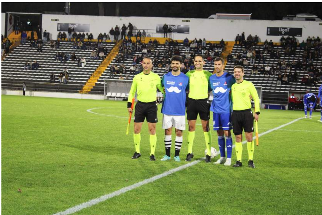
Capitães com os árbitros no início do jogo