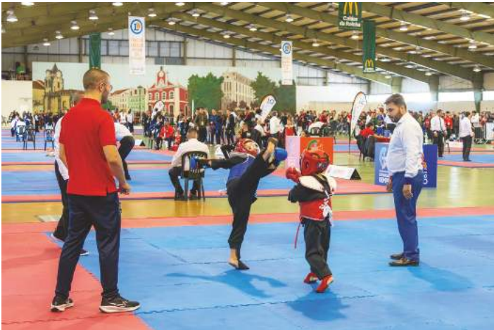
Estiveram vários escalões e diversas disciplinas em competição

Mais de 900 atletas participaram na Taça de Portugal de Kempo “Carlos Tavares”, que decorreu nos dias 29 e 30 de novembro na Expoeste, nas Caldas da Rainha. Tratou-se de uma prova nacional em formato Open, numa organização da Federação Portuguesa de Lohan Tao Kempo, que tem sede nas Caldas da Rainha. Com participantes de todo o país a partir dos cinco anos, contou com dois dias repletos de técnica, superação e espírito desportivo, estando vários escalões e diversas disciplinas desta arte marcial em competição.