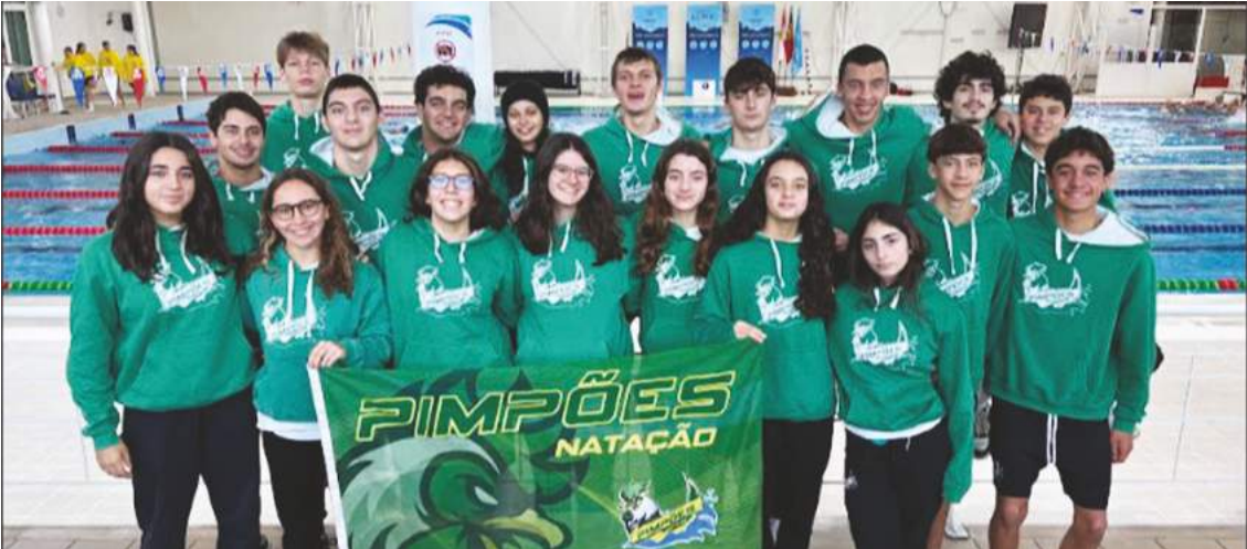
Nadadores do clube caldense