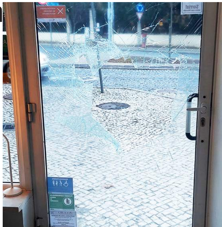
O vidro da porta de entrada foi partido

A PSP chegou logo a seguir, como o proprietário, e está na posse das imagens de videovigilância para identificar o meliante.