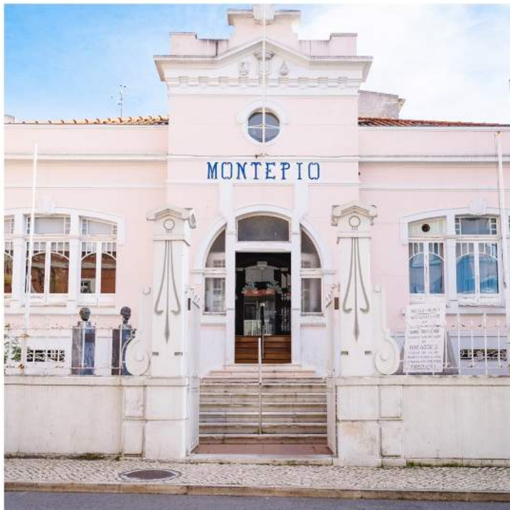
A partir do dia 9 de dezembro o Montepio Rainha Dona Leonor vai alargar o horário do seu Serviço de Atendimento