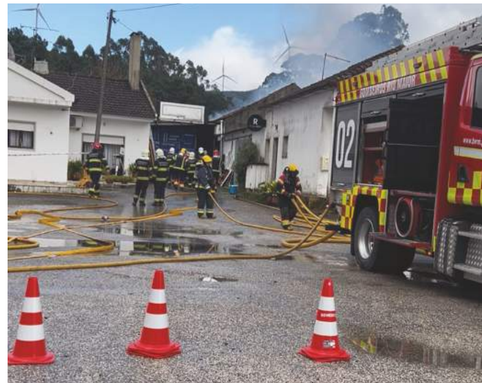
Os bombeiros extinguiram as chamas

As instalações de agência de publicidade Publiren, no Largo António Santos, na Venda das Raparigas, na freguesia da Benedita, ficaram destruídas na sequência de incêndio que deflagrou no dia 2 de dezembro, à hora de almoço. Na altura não estava ninguém na empresa, pelo que não houve feridos.