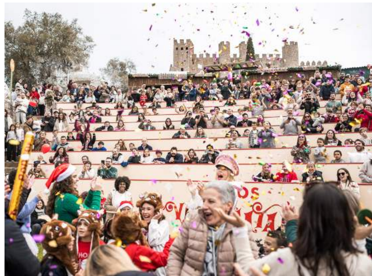
Muito público nos primeiros dias do evento