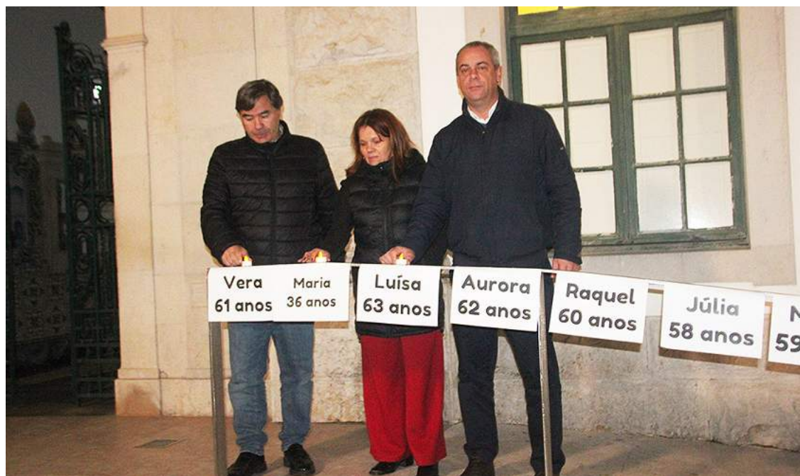
Foi acesa uma vela em memória de cada uma das vítimas