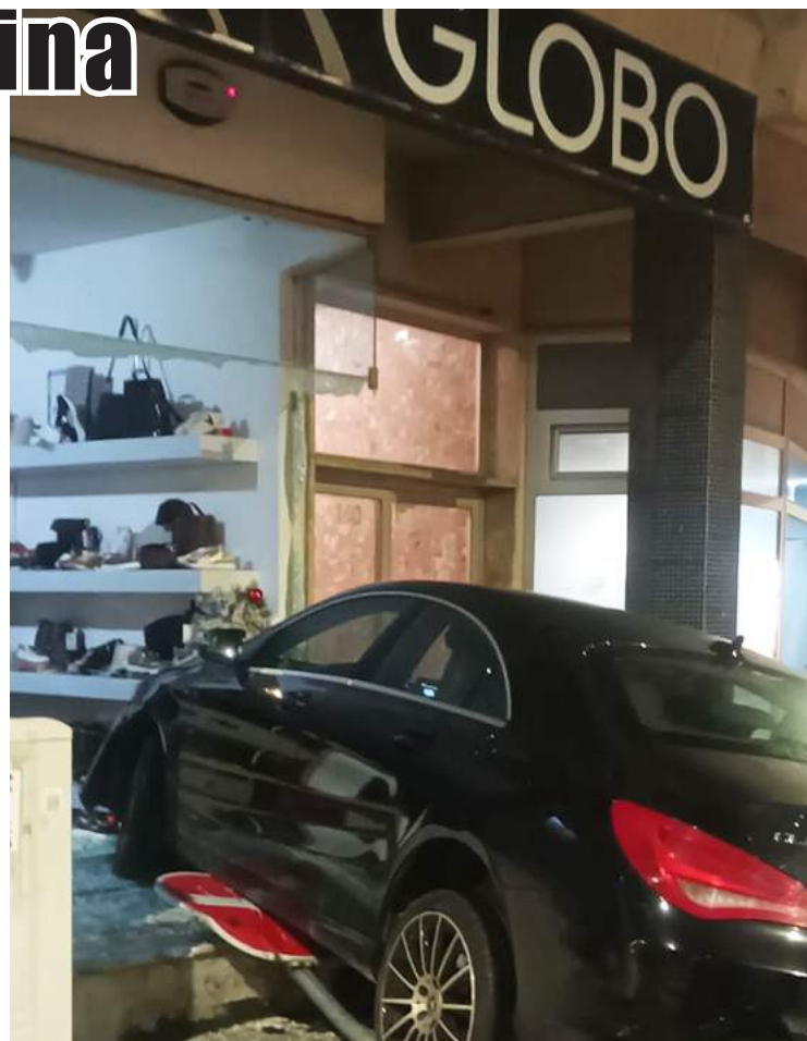
Derrubou o sinal de trânsito e embateu no vidro da Globo Sapatarias

A PSP permaneceu no local até às duas da manhã, acompanhando a retirada do grande número de pares de sapatos dos expositores por parte das funcionárias, uma vez que com o vidro partido não havia forma de proteger o recheio do estabelecimento. Foram várias horas de limpeza dos estilhaços e arrumação do calçado em caixas. Nesse período os bombeiros também repuseram o sinal de trânsito que tinha sido abalroado.