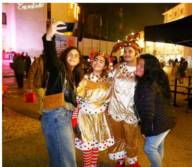
Momentos de convívio com os dois figurantes do natal