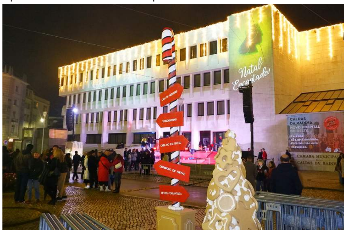
A Praça 25 de Abril tem novas cores durante esta época