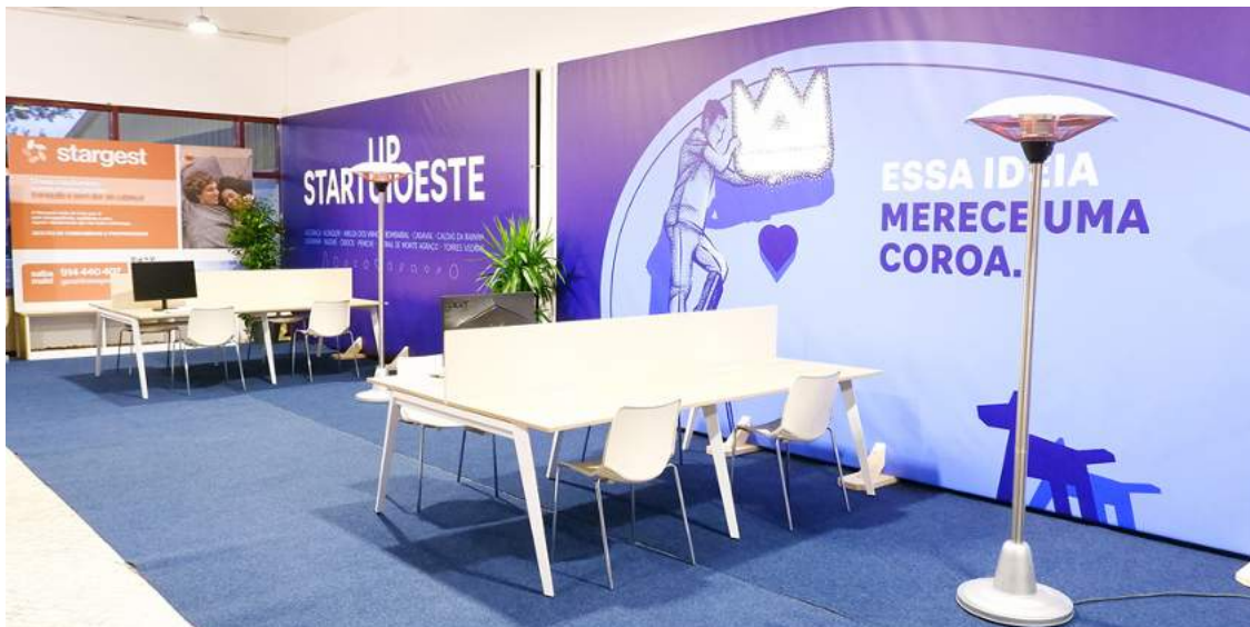
Atualmente a capacidade é de doze lugares