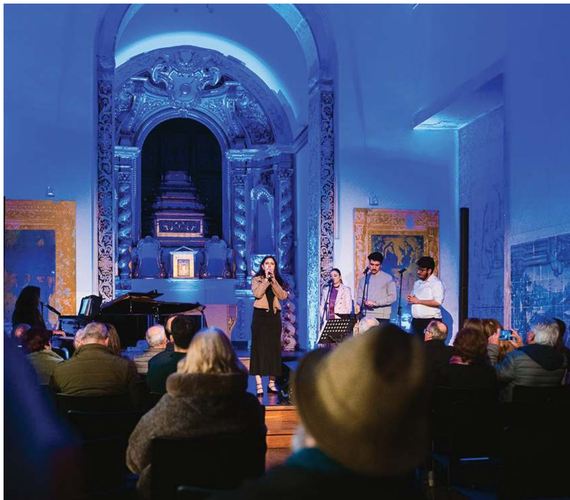
Evento no Convento de São Miguel, em Gaeiras

O Dia Mundial da Poesia foi também assinalado com outras