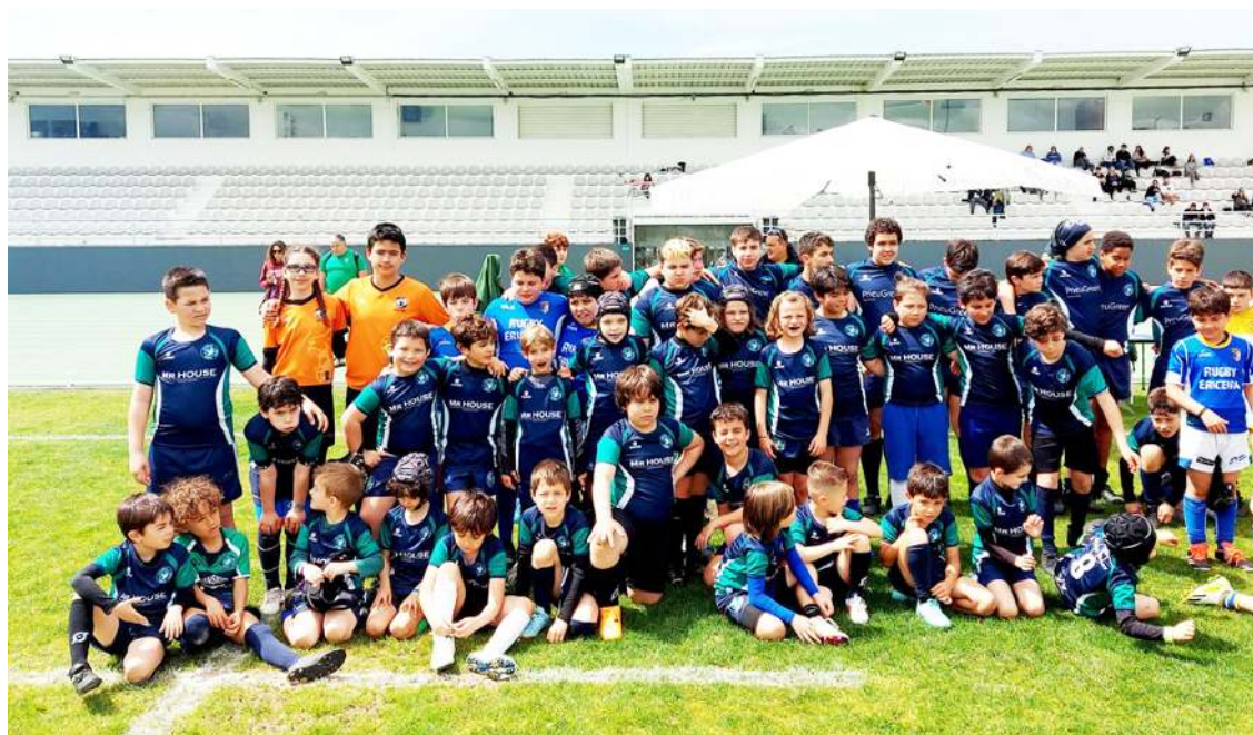
Alguns dos participantes

O Caldas Rugby Clube (CRC), a comemorar o 27.º aniversário, organizou, no início de tarde do passado sábado, um Convívio de Rugby Juvenil para os escalões Sub8, Sub10 e Sub12.