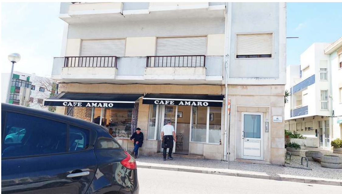
O tiro foi disparado neste café no centro da vila da Nazaré