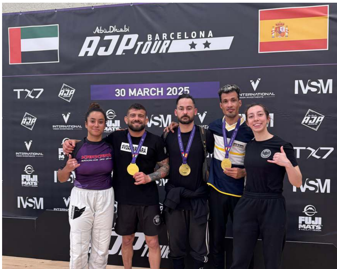
Atletas da equipa Karkará Jiu-Jitsu

A equipa caldense Karkará Jiu-Jitsu participou em mais uma etapa do circuito da AJP Spain, circuito que oferece a passagem e a inscrição no campeonato mundial em Abu Dhabi ao líder do ranking.