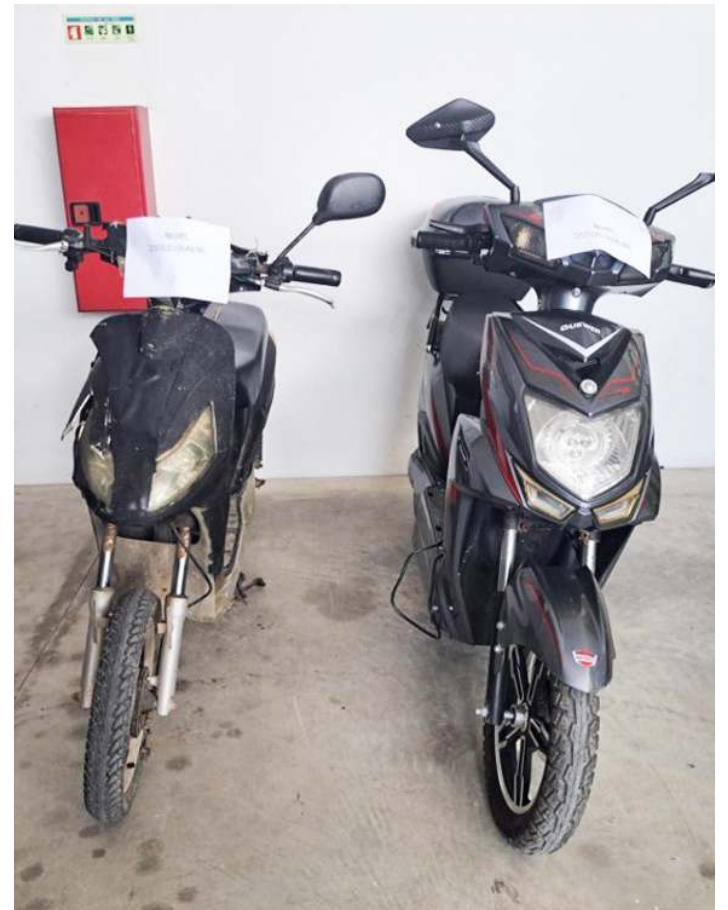
Ciclomotores elétricos foram apreendidos

A GNR deteve na passada quarta-feira, na Lourinhã, um homem de 32 anos na posse de dois ciclomotores elétricos furtados em Peniche.