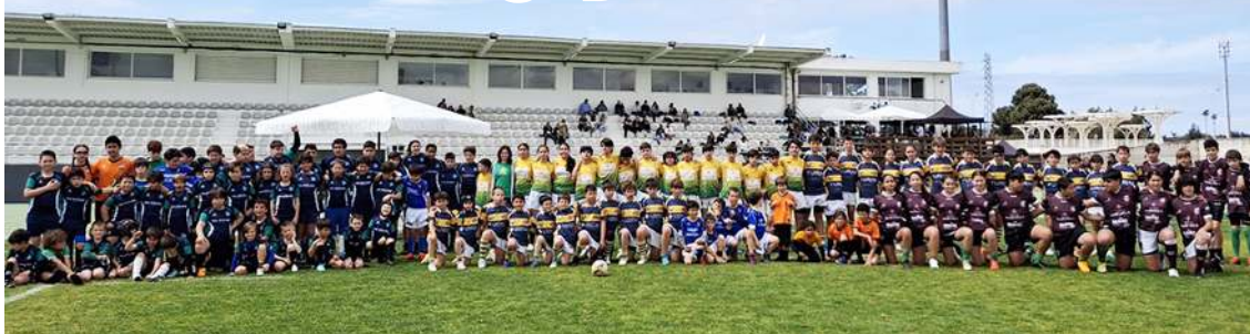
Participaram várias equipas

Integrada na comemoração do seu 27º aniversário, o Caldas Rugby Clube recebeu a jornada nacional do Torneio Desenvolvimento escalão Sub14, no Estádio Dr. José Luis de Melo Silveira Botelho.