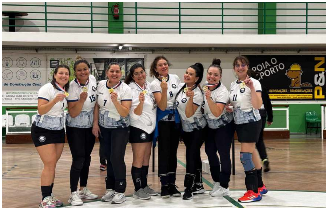
Vitória da equipa obidense

A equipa de voleibol de veteranas femininas da Associação Desportiva de Óbidos participou num torneio no passado dia 5, em Torres Vedras, que venceu.