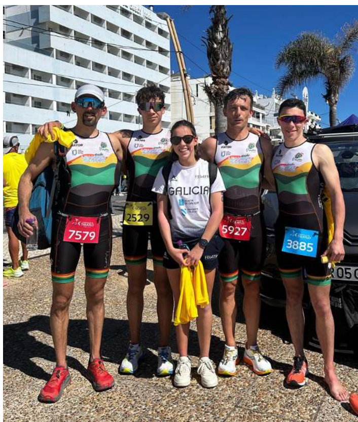
Elementos dos Pimpões Triatlo

Atletas dos Pimpões Triatlo participaram na Taça da Europa e na Taça de Portugal em Quarteira.