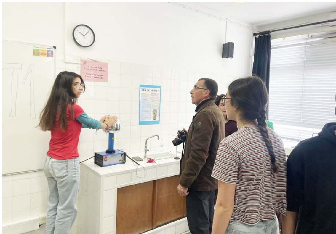
Gerador de Van de Graaff, que arrepiou o cabelo da aluna ao efeito da eletricidade estática

A Semana Raul Proença envolveu cerca de 1200 alunos da escola, além de cerca de 100 estudantes do 9.º ano da EBI de Santo Onofre, que visitaram a secundária com o objetivo de