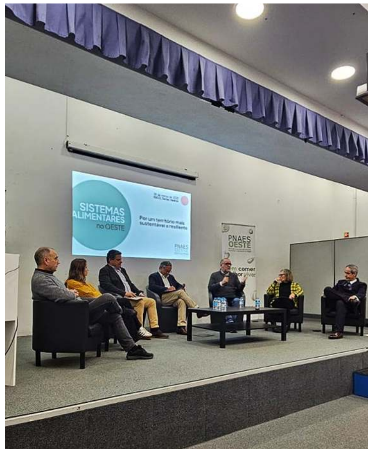
A Associação Leader Oeste, sediada no Cadaval, organizou em Torres Vedras o segundo encontro dedicado aos Sistemas Alimentares no Oeste

Também desde essa altura existem núcleos no Oeste, em Alenquer e Torres Vedras, do projeto PROVE – Promover e Vender, que pretende contribuir para o escoamento de produtos locais, fomentando as relações de proximidade entre quem produz e quem consome, através