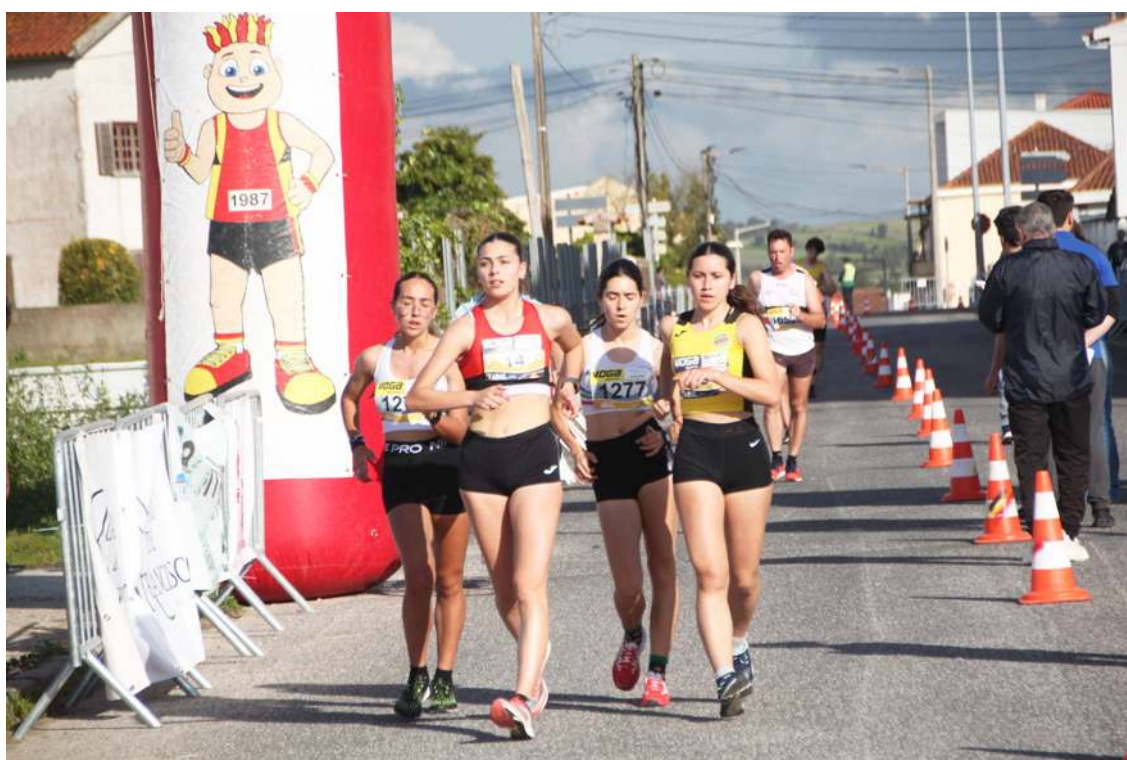
A prova contou com cerca de 60 atletas

Realizou-se no dia 5 de abril, junto ao pavilhão municipal do Bombarral, o Campeonato Distrital Marcha em Estrada, no qual participaram cerca de 60 atletas.