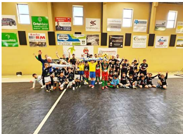
Iniciativa em Alvorninha

A Associação Desportiva de Alvorninha recebeu, no passado sábado, no pavilhão D. José Policarpo, um encontro de traquinas em futsal.