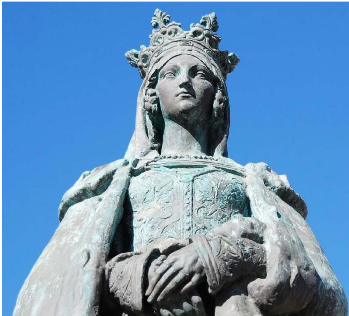
Prova homenageia a Rainha Dona Leonor

O Município das Caldas da Rainha está a promover a primeira edição da Meia Maratona Rainha Dona Leonor, que irá realizar-se nos dias 14 e 15 de junho, com desafios para todos os gostos: 21,1 km, 10 km, 5 km e Corrida das Crianças.