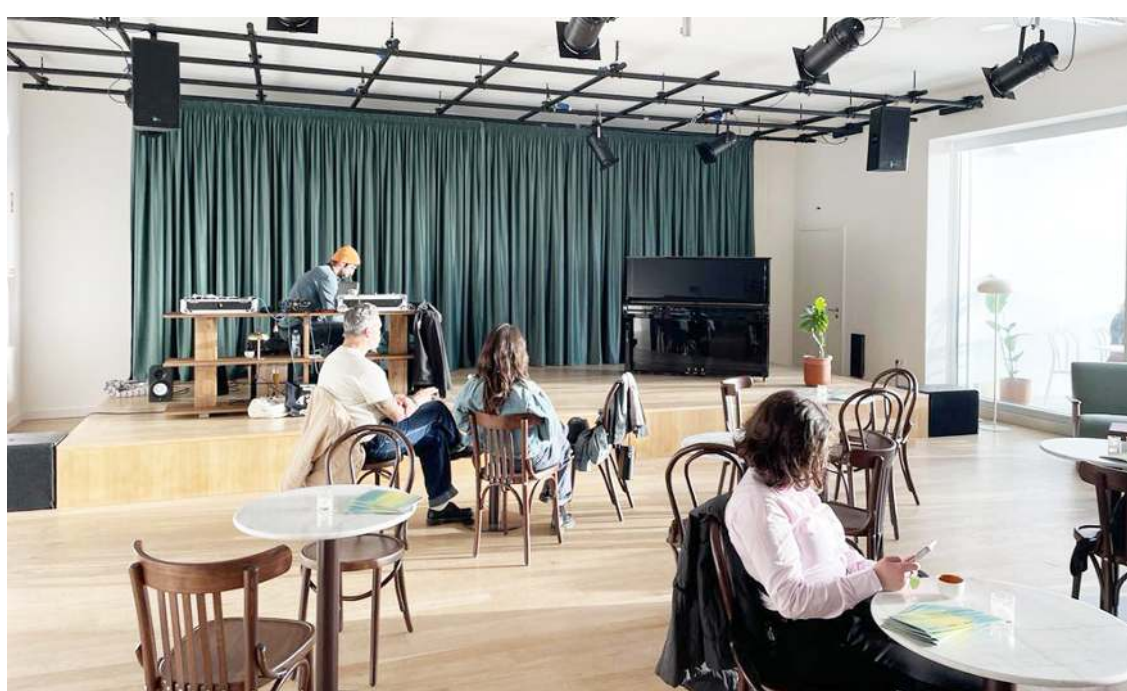
Uma área de cabaré, ideal para quem quer apenas tomar um copo

nativos. Temos de ser um pouco mais consensuais, sem nunca perder a nossa essência, porque senão tornamo-nos apenas mais um”.