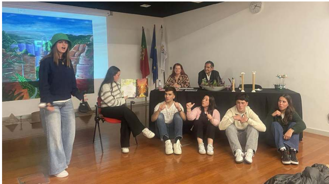
Clube de Contadores de Histórias

Seguiu-se a apresentação do projeto “A biodiversidade da Lagoa de Óbidos”, que procura sensibilizar para a preservação do património natural da região. A sustentabilidade ambiental também esteve em destaque com os projetos Eco-Escolas e Escola Azul, que englobam iniciativas como projeto “Dá-lhe Gás” – produção de biometano a partir de resíduos orgânicos locais e estudo do perfil dunar e identificação da vegetação da Praia D’El Rey.