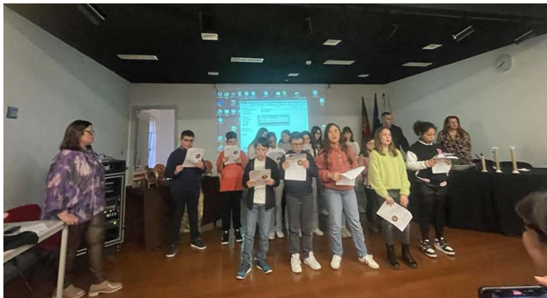
Projeto “Canções – Muralha de Memórias para o Futuro

Houve uma análise à qualidade da água e de invertebrados no solo da albufeira do Arnóia, para avaliação da qualidade dos ecossistemas dulçaquícolas.