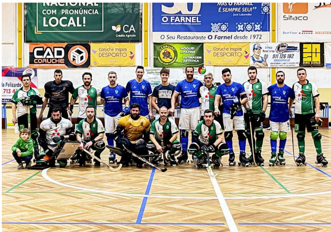
Masters do Hóquei Clube das Caldas

No passado sábado os Masters do Hóquei Clube das Caldas (HCC) foram a Coruche jogar mais uma jornada do campeonato nacional com o Sporting Clube de Torres, tendo vencido por 6-4 e levando a decisão da Final 8 para a última jornada, onde ape-