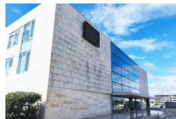
A cerimónia terá lugar na sede da Comunidade Intermunicipal do Oeste, nas Caldas da Rainha

A assinatura deste acordo assinala um marco significativo para a região, na sequência da aprovação da nova Nomenclatura das Unidades Territoriais para