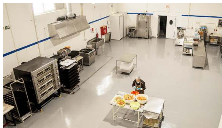
Novas instalações têm mais espaço de produção

A loja está aberta de segunda a sexta-feira, das 10h às 13h e das 14h às 18h. Para a Páscoa, funcionará também nos sábados, 12 e 19 de abril. A empresa estuda ainda um modelo de loja pop-up, com abertura em datas específicas e com marcações. Os produtos podem ser adquiridos também online, com entregas em todo o país ou pode encomendar online e vir buscar à loja.