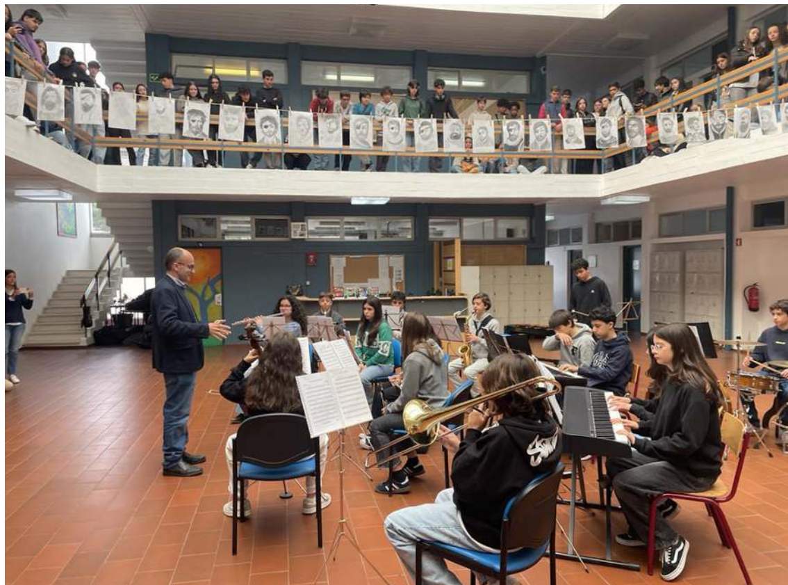
Os alunos foram recebidos por uma atuação da Academia de Música de Óbidos

conhecer o ambiente escolar do ensino secundário. “Os estudantes da Associação de Estudantes fazem a visita guiada aos mais novos. São perfeitamente autónomos e assumem essa responsabilidade com grande empenho”, contou.