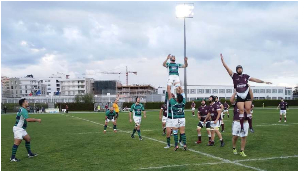
Jogo no Estádio Dr. José Luis de Melo Silveira Botelho, nas Caldas da Rainha