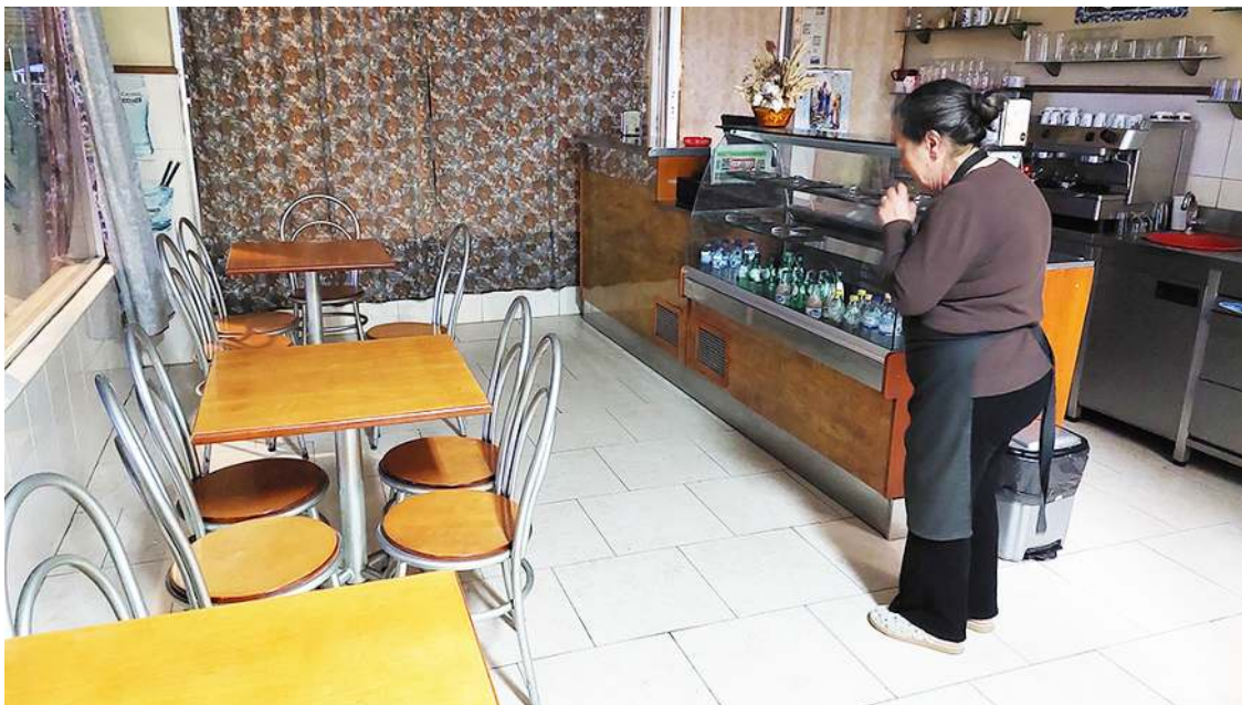
A proprietária do café ficou em choque

A vítima, assistida no local pelos bombeiros da Nazaré e pela equipa da Viatura Médica de Emergência e Reanimação das Caldas da Rainha, foi transportada para o Centro Hospitalar e Universitário de Coimbra.