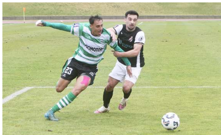
O Caldas amealhou mais um ponto para a manutenção

B Yordi (18'), Thomas Militão (63') e Kevin Lopez (78').