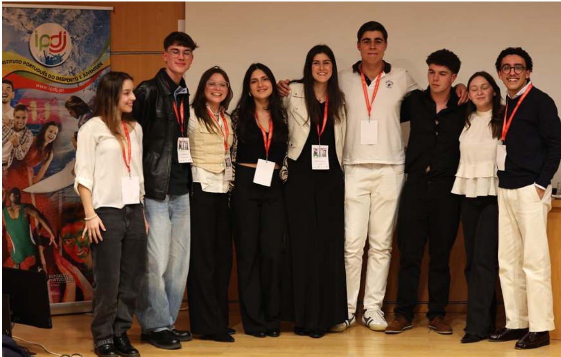
Eleitos na Sessão Distrital de Leiria do Programa Parlamento dos Jovens

Pode consultar o projeto de recomendação do círculo eleitoral de Leiria, sobre o tema aprovada para este ano letivo, «No-