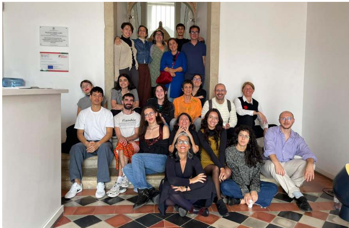
Alguns dos participantes na Adenda da Juventude à Carta do Porto Santo - Caldas da Rainha/Loulé

A Adenda propõe seis temas-chave, cada um apresentado com um contexto geral seguido de propostas de ação que podem ser implementadas pelos jovens, nomeadamente: a participação cultural e cidadania; as desigualdades no acesso à cultura; a inclusão versus a hierarquia e elites; a cultura digital e desafios éticos; as condições de trabalho dos trabalhadores de cultura; e a educação da cultura e das artes. "Todos os jovens envolvidos