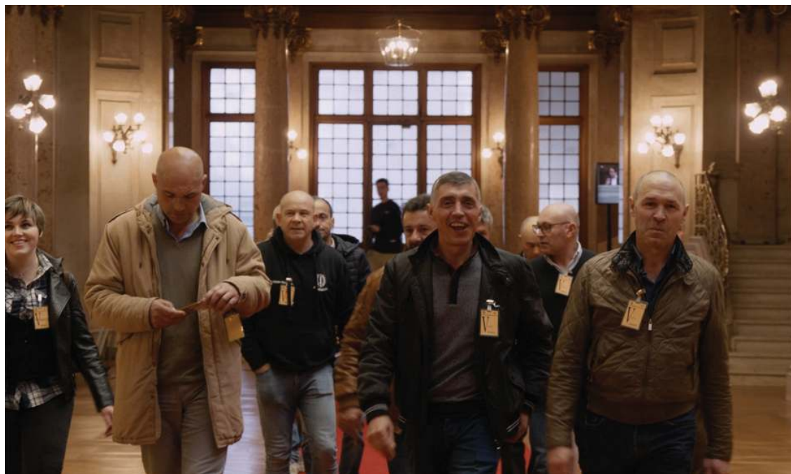
Trabalhadores das pedreiras, minas e lavarias, nos Passos Perdidos da Assembleia da República

“Filmei um ano na vida da Assembleia da República, testemunhando como cidadãos tornados deputados transformam as expectativas dos outros em leis. Decidi observar e mostrar os seus desafios, conquistas e frustrações. Como defendem ideais políticos abstratos e os confrontam com os problemas concretos e os anseios legítimos dos outros cidadãos. Não é difícil constatar o nosso desconhecimento sobre este processo. Será que temos uma ideia clara de como funciona a democracia representativa?