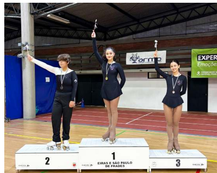
Torneio em Coimbra

No passado fim de semana, a secção de Patinagem Artística dos Pimpões marcou presença no Torneio da Associação Académica de Coimbra. A participação das atletas foi um sucesso.