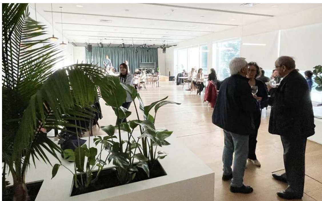
A distribuição do espaço foi cuidadosamente planeada para criar diferentes zonas