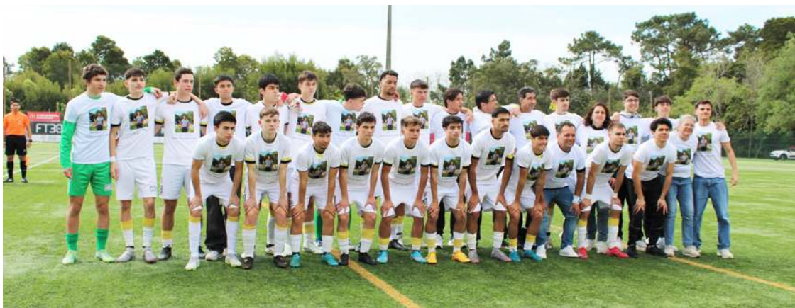
Equipa com t-shirt com a foto de António Ramiro

Na segunda parte, a formação visitante entrou com outra disposição, mas o Caldas rapidamente