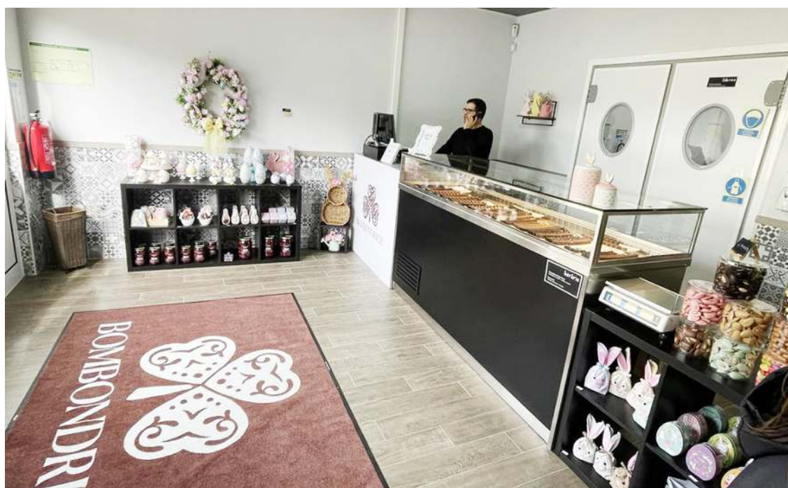
A nova loja abriu com a apresentação da coleção de páscoa

bondrice desde 2018. O jovem casal procurava um projeto a dois e surgiu a oportunidade da aquisição da marca, que já é uma referência nacional.