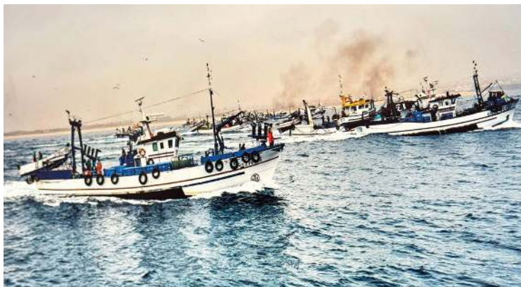
Um tributo à pesca do cerco e às gentes que vivem do mar

Ao longo desses quatro anos Helder Luís percorreu a costa portuguesa a bordo de embarcações da pesca do cerco de Póvoa do Varzim, Caxinas e Vila do Conde, registando a faina da sardinha e a vivências dos pescadores, uma aventura que o conduziu, naturalmente, a Peniche, um porto piscatório com forte tradição na arte piscatória do cerco. Aqui encontrou um ritmo próprio,