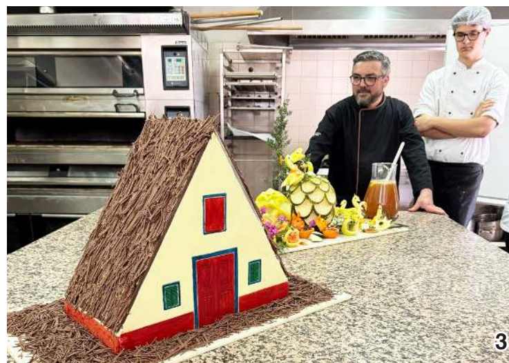
3. Foi produzida uma típica casa madeirense de Santana em chocolate