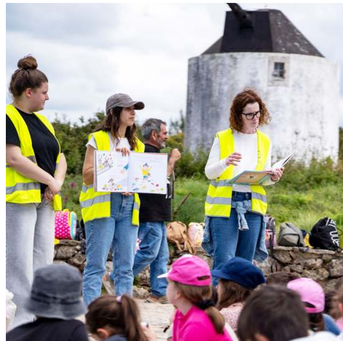
Iniciativa reuniu miúdos e graúdos

No Moinho do Hipólito (Amoreira) e no Convento de São Miguel (Gaeiras) decorreram ações no âmbito do Dia do Autor Europeu destinadas a miúdos e graúdos.