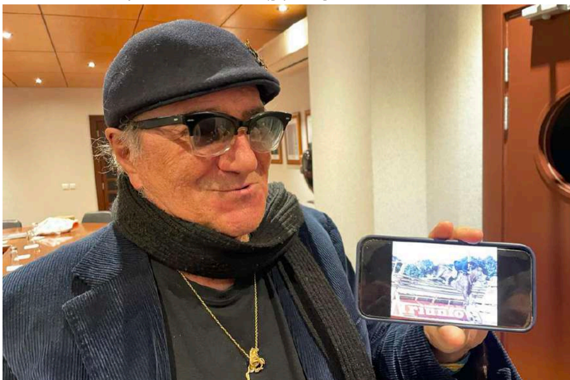
A exibir imagem de 1992, quando participou nas Caldas numa prova desportiva

cantar músicas em inglês. Mencionou também a sua experiência na Austrália, onde, durante um concerto de José Cid, foi necessário incluir artistas locais austra-