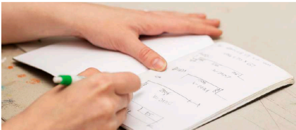
Explicações gratuitas em Matemática e Físico-Química

O Centro de Desenvolvimento Comunitário do Landal (CDCL) encontra-se a aceitar inscrições para explicações gratuitas nas áreas de Matemática (2º e 3º ciclos) e Físico-Química (3º ciclo),