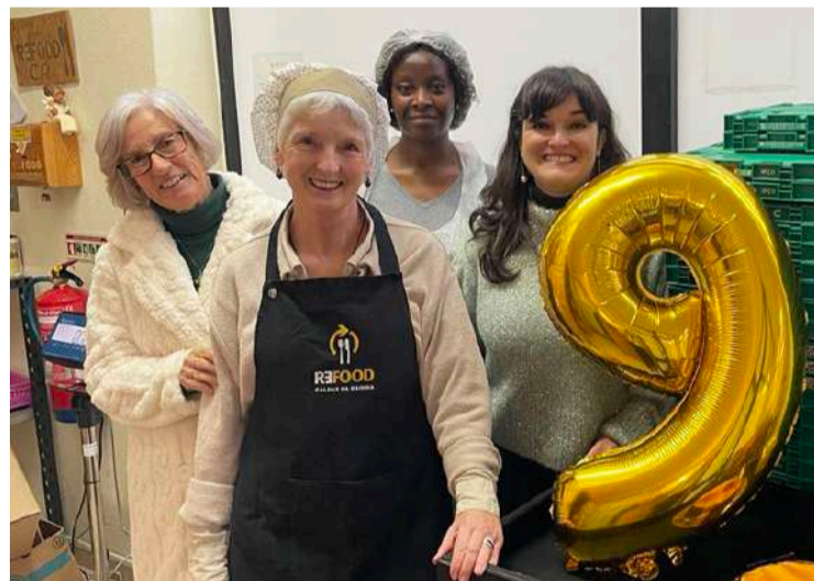
A Refood Caldas da Rainha comemorou o 9º aniversário

As instalações do Centro de Operações da Refood CR estão localizadas na Rua Teixeira Lopes, loja 1, nas Caldas da Rainha.