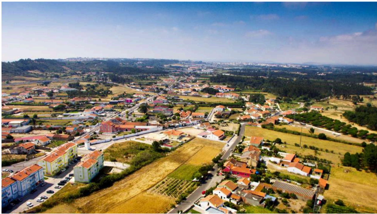
Tornada tem mais de 3 mil habitantes

122 espécies de vertebrados, das quais 66 estão protegidas pela Convenção sobre a Vida Selvagem e os Habitats Naturais na Europa (Convenção de Berna). Dessas, 15 são espécies ameaçadas que constam no Livro Vermelho dos Vertebrados de Portugal, como por exemplo a lontra e o cágado-de-carapaça-estriada.