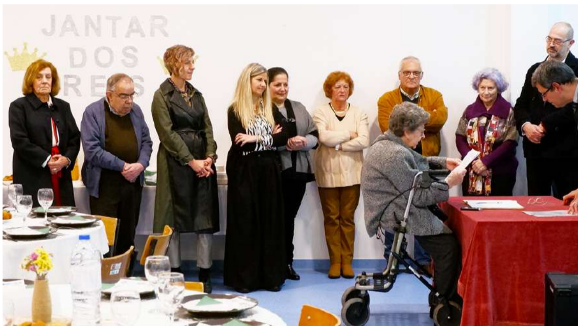
Os novos órgãos sociais tomaram posse