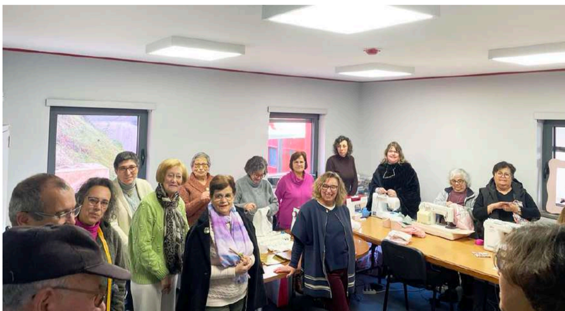
As costureirinhas inauguraram a sua nova sala onde se dedicam a ações solidárias

A entrega será feita por uma senhora que acompanhará os materiais até Guiné-Bissau, onde também ensinará as mulheres locais como utilizar e lavar os pensos higiénicos reutilizáveis. Esta