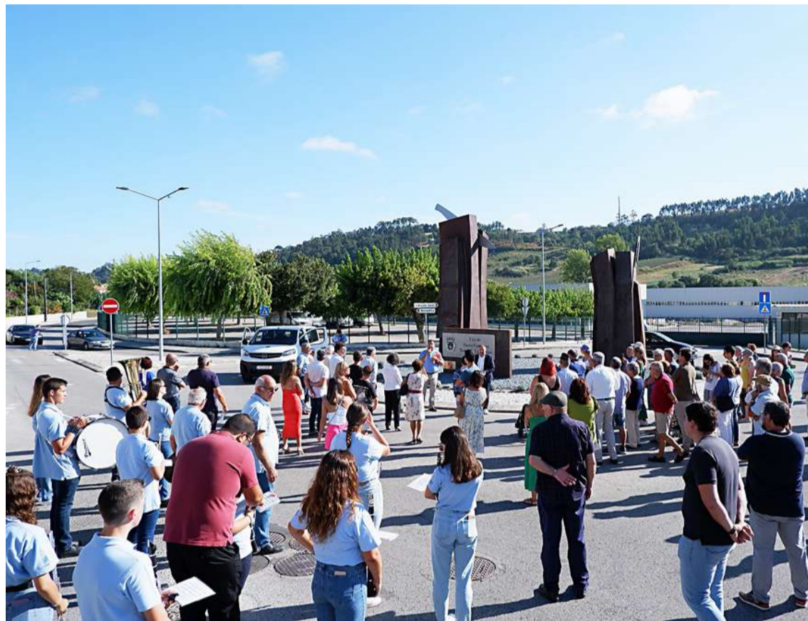
Nas cerimónias do 32º aniversário de elevação de Santa Catarina a vila, a mais antiga do concelho, foi inaugurado o monumento ao cuteleiro

Com a elevação de Tornada, o concelho das Caldas da Rainha passa a ter seis vilas.