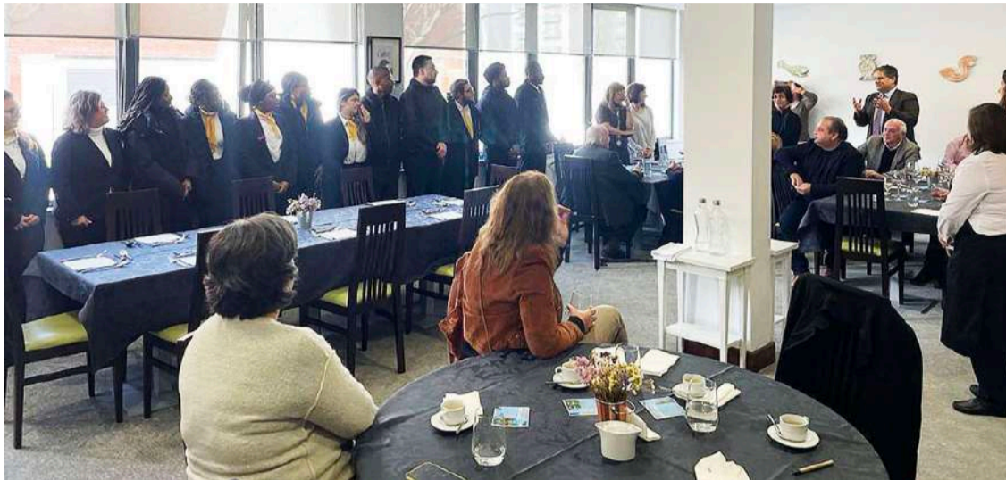
Alunos confeccionaram o almoço

O almoço solidário foi antecedido de uma palestra organizada pelo NRDC em parceria com a EHTO, cujo tema foi “Mudar o Mundo Começa na Cozinha