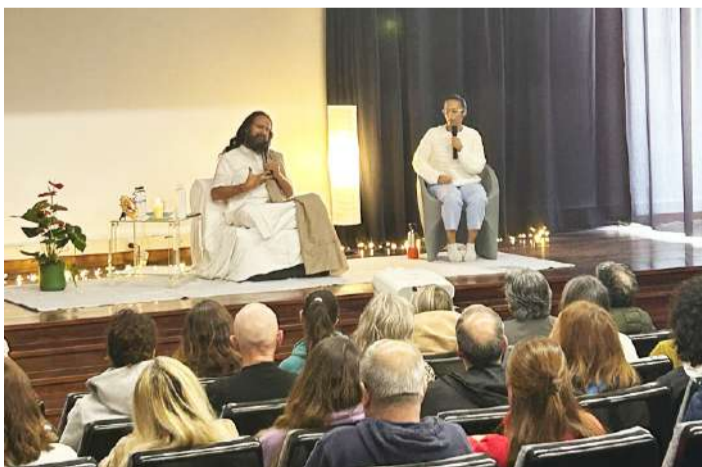
Evento na Expoeste

No passado dia 12 o auditório da Expoeste, nas Caldas da Rainha, recebeu a “Arte de Viver”, associação de voluntários presente em cerca de 180 países, que apresentou, em parceria com a AIRO- Associação Empresarial da Região Oeste,