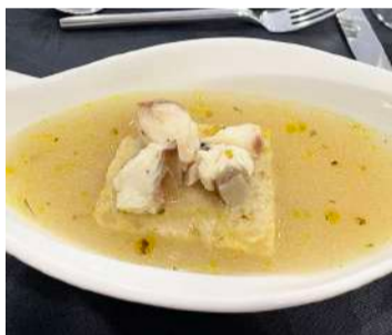
Sopa de cação

(Sustentável)”. A palestra abordou práticas de cozinha sustentável e a importância de um modelo de alimentação responsável