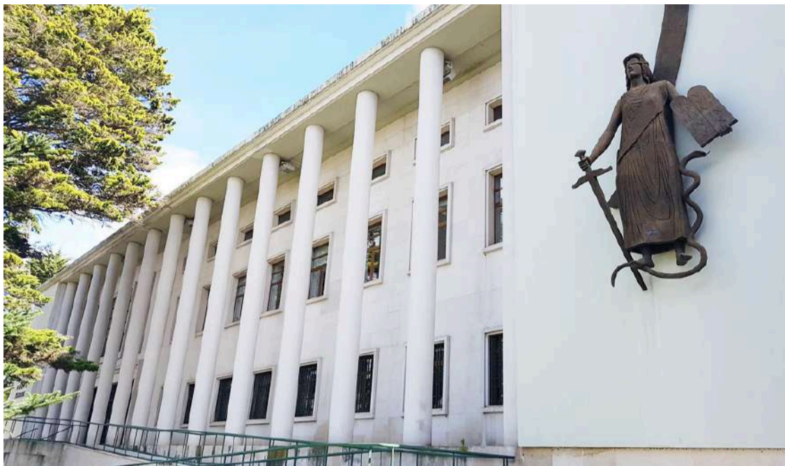
O caso está a ser julgado no Tribunal Judicial de Leiria

O MP adiantou, entre outros aspetos, que os arguidos se aproveitaram das fragilidades da ofendida, sobretudo as dificuldades financeiras que tinha no país de origem, trazendo-a para Portugal, onde a usaram no tra-