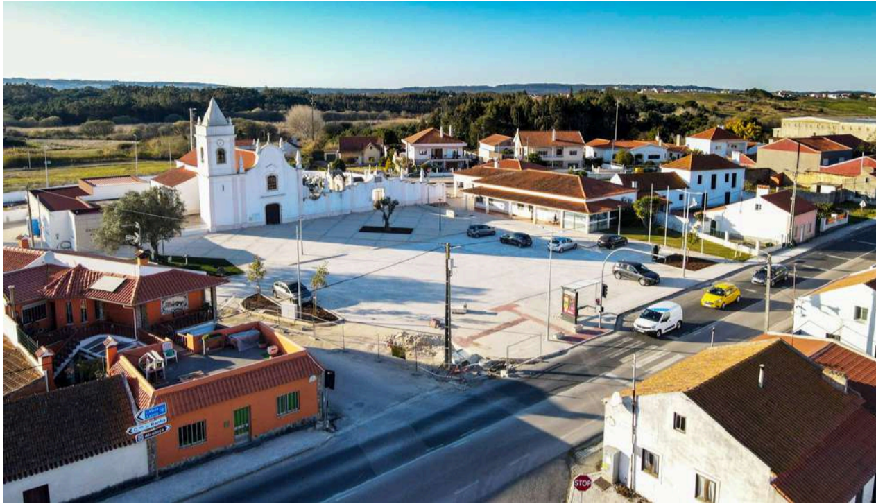
Zona central de Tornada

É local de desova e crescimento de muitos peixes e anfíbios bem como local de alimentação para diversas espécies, com destaque para as aves migratórias. Nele já foram recenseadas