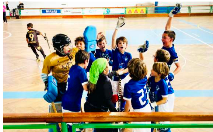
Escolares do Hóquei Clube das Caldas

No domingo os Escolares jogaram a quinta jornada da prova regional da AP Leiria e da AP Ribatejo na casa da BIR Valado dos Frades, defrontando a equipa da casa, sendo derrotados por 4-3, numa partida bem disputada. Apesar da derrota, a evolução dos jogadores é notória de jornada para jornada.