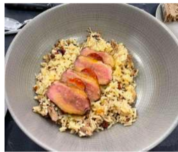
Arroz de pato

(Sustentável)”. A palestra abordou práticas de cozinha sustentável e a importância de um modelo de alimentação responsável