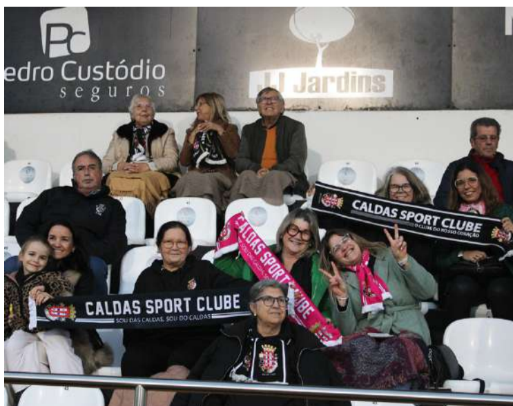
Apoio caldense nas bancadas