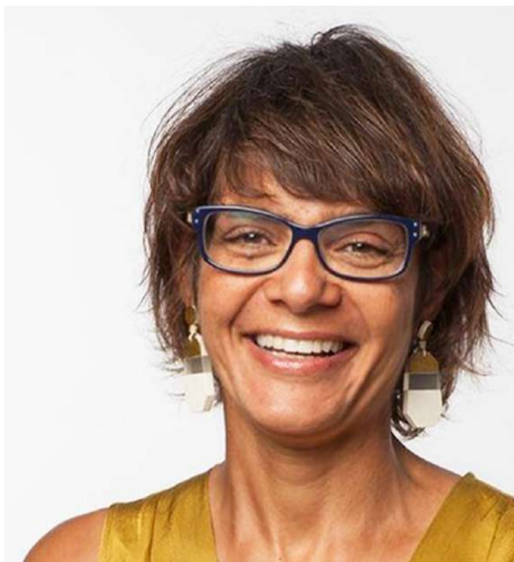
A nova diretora

junta da ESAD.CR e investigadora no ICNOVA - Instituto de Comunicação da Nova. É também investigadora internacional convidada do Lariisa Saúde Digital,