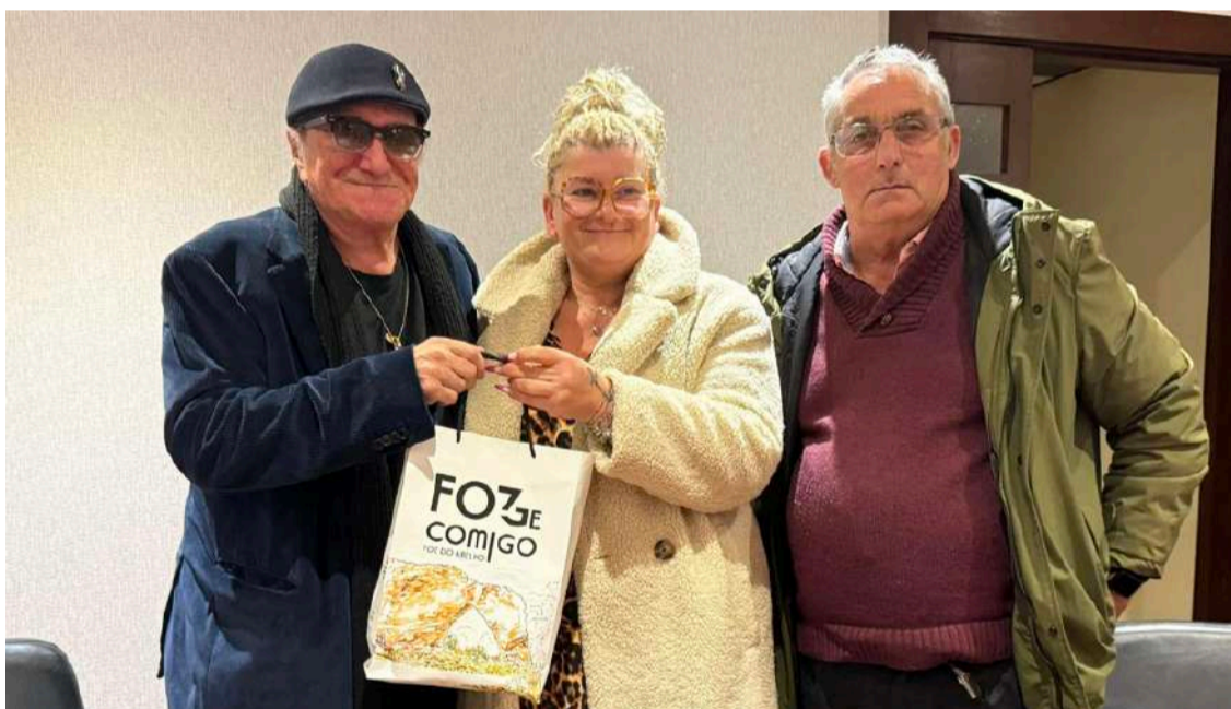
O cantor recebeu um presente da marca “Foz(ge) Comigo”