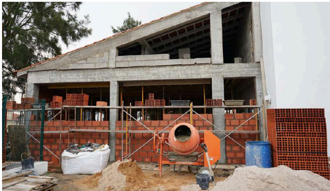
Ampliação do Jardim-de-Infância da Quinta de Santo António

A Câmara Municipal do Bombarral tem vindo a realizar trabalhos de reabilitação e requalificação em vários estabelecimentos escolares do concelho. Recentemente ficou concluída a reabilitação no edifício do Jardim-de-Infância do Pó. Os trabalhos foram efetuados por funcionários da autarquia e tiveram por objetivo a recuperação, reabilitação e pintura de paredes interiores do estabelecimento de educação pré-escolar.