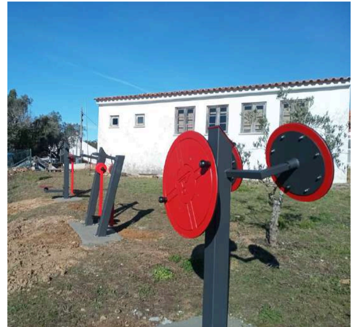
Os novos equipamentos para a prática de exercício

A Junta de Freguesia de A-dos-Negros, no concelho de Óbidos, divulgou a instalação de equipamentos de fitness/ginástica ao ar livre instalados na escola dos Casais da Areia.