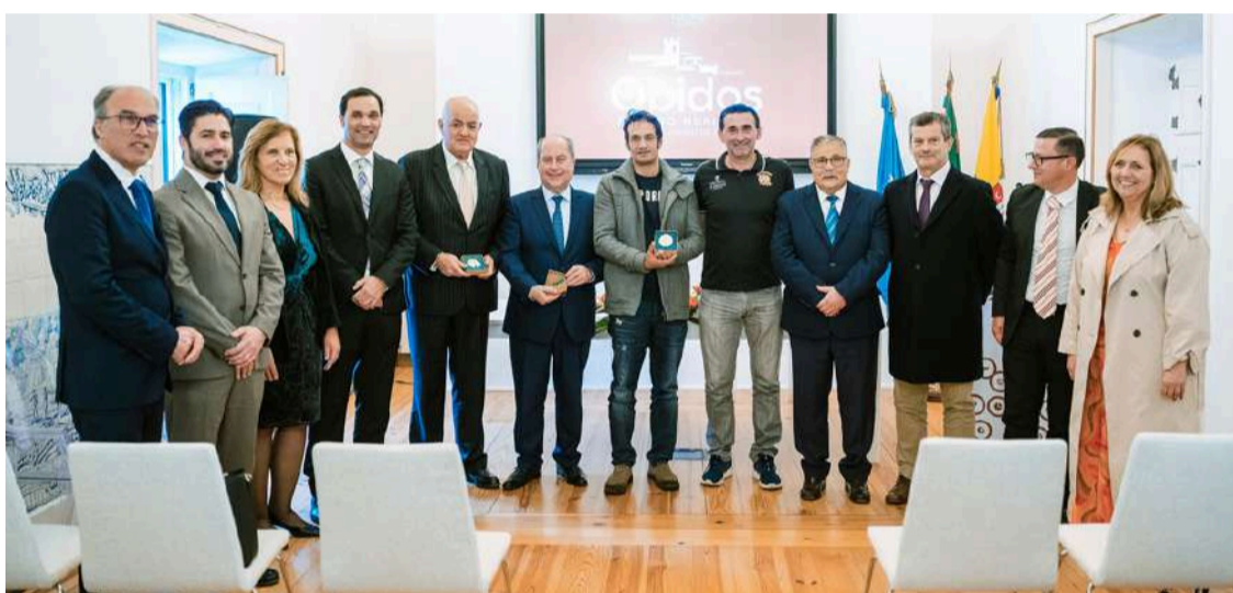
Autarcas com homenageados