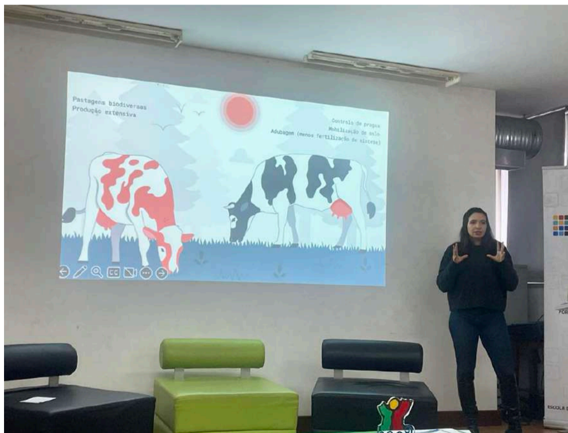
A influenciadora dedicada à sustentabilidade deu uma palestra na EHTO