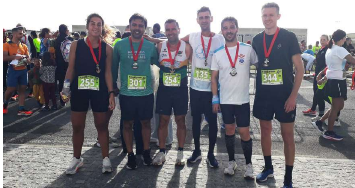
Alguns dos participantes

Teve lugar no passado dia 12 a 6ª edição da corrida Peniche a Correr, prova ao longo de aproximadamente dez mil metros, na cidade de Peniche.