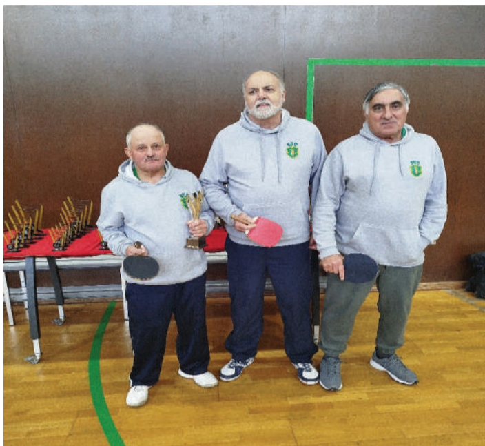
Os três atletas em competição

Os jogadores seniores/veteranos do Sporting das Caldas de ténis de mesa continuam esta época 2024/25 a participar nos campeonatos da Federação Challenge (3º escalão) e no Circuito Nacional de Veteranos.