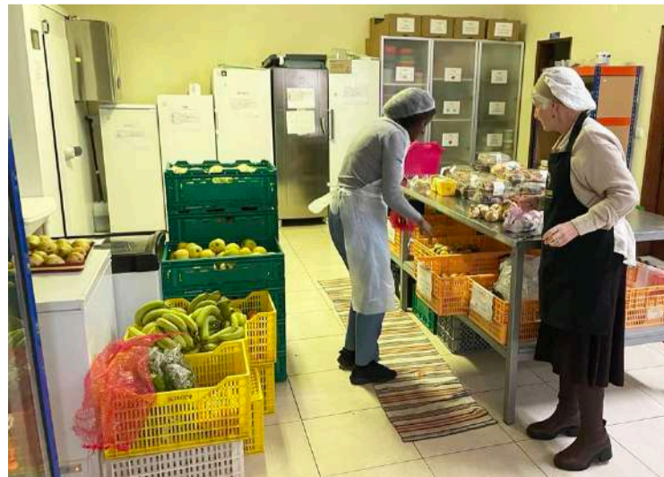
180 voluntários garantem o funcionamento contínuo da operação