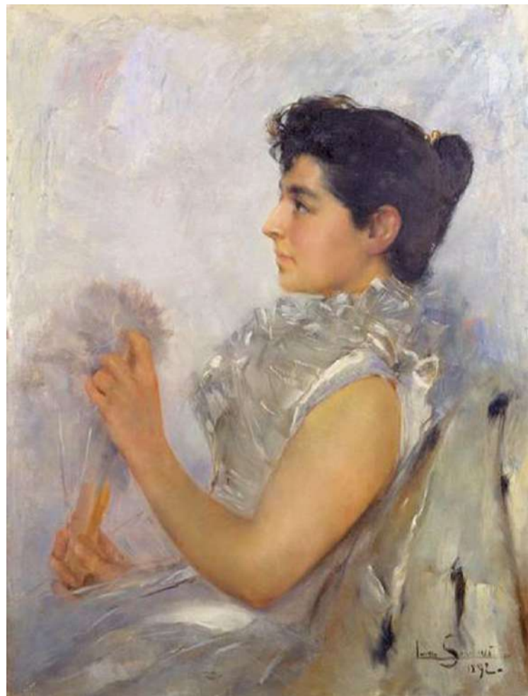
Laura Sauvinet, “Retrato de Senhora”, 1892

Os dois museus estão abertos às mais variadas propostas de visitas e atividades.