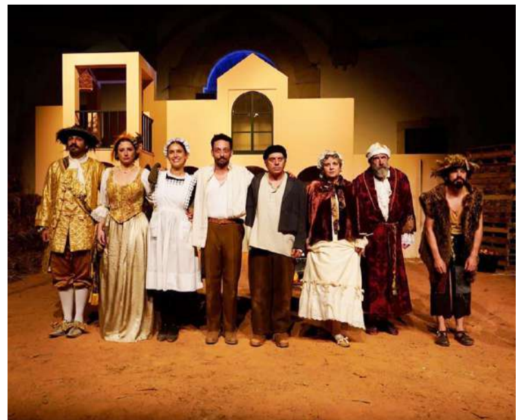
CCC reforça parceria com Teatro da Rainha