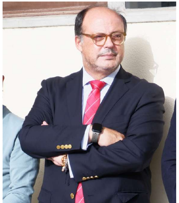
Hugo Oliveira é deputado na Assembleia da República e vereador na Câmara das Caldas