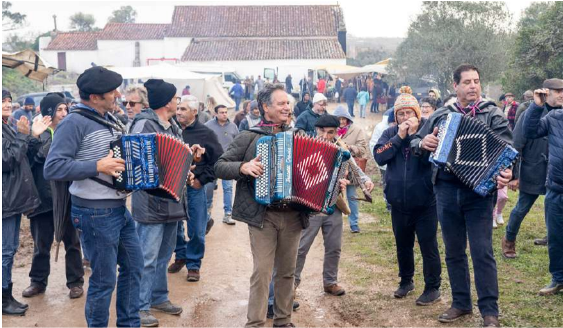
A romaria destaca-se pelo ambiente festivo

A Romaria de Santo Antão, em Óbidos, realiza-se no dia 17 de janeiro, como manda a tradição. Este evento, que combina devoção religiosa com momentos de confraternização, reúne anualmente milhares de participantes. É uma celebração que integra o Feriado Municipal de Óbidos, marcada por alegria, partilha e costumes únicos.