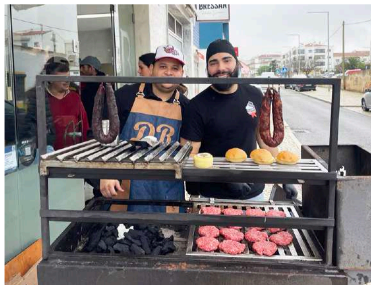
Um churrasco especial na inauguração dos Talhos Bressan

O estabelecimento está aberto de terça a sábado, das 09h00 às 13h00 e das 15h00 às 19h30, e fecha aos domingos e segundas-feiras. Para encomendas, contactar pelo número 964846440.