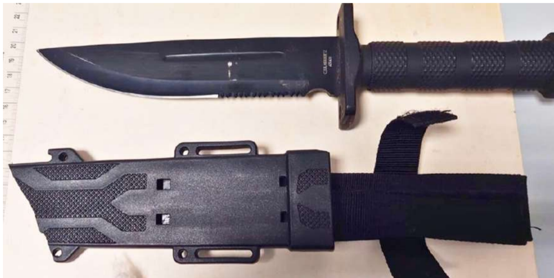
Apreensões feitas pela GNR na Praia da Areia Branca

Um homem de 36 anos foi detido por posse de arma proibida, na Praia da Areia Branca, no concelho da Lourinhã, no passado dia 11.