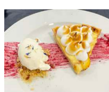
Tarte de maçã de Alcobaça

Este evento é mais um exemplo do trabalho conjunto entre a EHTO e a comunidade local,