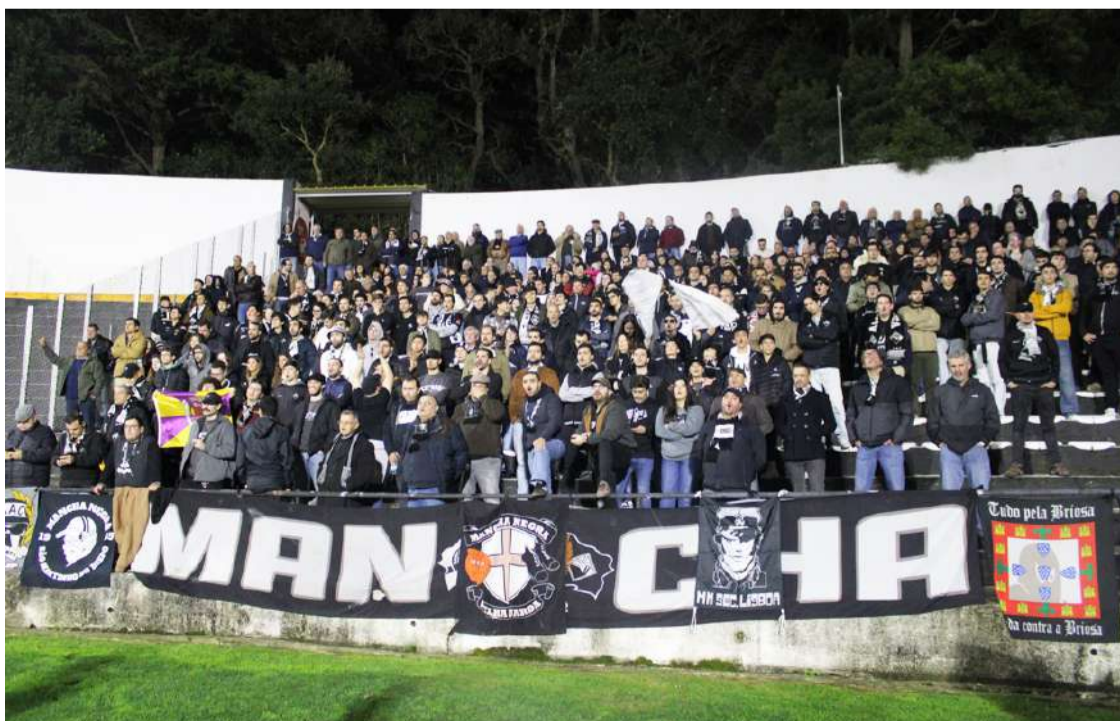
Adeptos da Académica