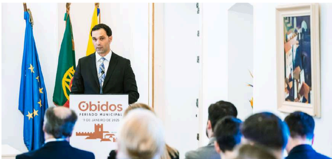
O presidente da Câmara a discursar

Após a aquisição dos dois lotes onde se encontrava o "Novo Banco", a Câmara vai avançar com o Edifício Multisserviços, "equipamento fundamental para quebrar barreiras arquitetónicas