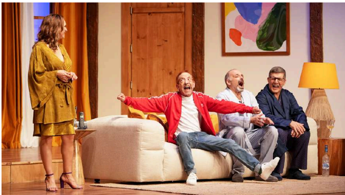
A peça de teatro “Feliz Aniversário” garante muita diversão