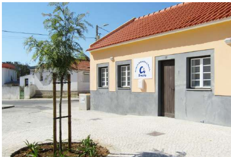
Sede da Arméria - Movimento Ambientalista de Peniche

Em relação ao projeto para a freguesia de Atouguia da Baleia, junto a Porto de Lobos, com potência de 8MW, numa área de 13 hectares, com cerca de 18 mil módulos fotovoltaicos, que vão produzir 16 GW/h por ano, o equivalente ao consumo de quase oito mil habitações, a Arméria sublinha que “as questões