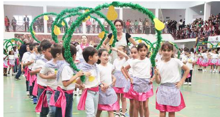
No Pavilhão Municipal do Bombarral desfilaram cerca de 550 alunos

As "Marchas Populares" do Agrupamento de Escolas Fernão do Pó decorreram no Pavilhão Municipal do Bombarral no dia 28 de junho, com cerca de 550 alunos do pré-escolar até ao 4º ano.