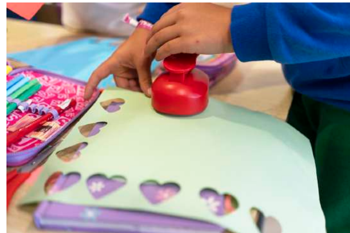
A máquina foi idealizada no contexto do projeto MyMachine em forma de kit

Os alunos do 2º D do Complexo Escolar do Alvito, no concelho de Óbidos, desenharam uma “Máquina de Fazer Corações”, capaz de espalhar corações de papel por toda a comunidade escolar como símbolo de amor e empatia pelo próximo.