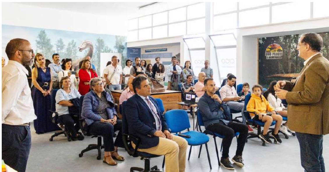
Cerimónia no Centro Interpretativo do Geoparque Oeste

No dia 21 de junho, o Geoparque Oeste realizou um evento em celebração da efeméride do Dia da Gastronomia Sustentável, no Centro Interpretativo do Geoparque Oeste, no Bombarral.