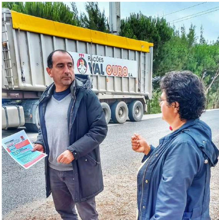
Contato com trabalhadores na Sociedade Agrícola Quinta da Freiria, no Bombarral

O SITE-SCRA, sindicato dos setores da química e metalúrgica, realizou ações de contacto com os trabalhadores da GLN (Novares), Dunlop - Planeta Plásticos e Plasgal, em Leiria, Bourbon,