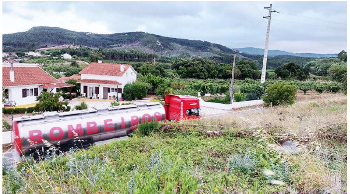
Os fogos consumiram sete hectares e não foram mais devido à intervenção de bombeiros e populares

O MP não conseguiu provas de que o arguido foi o autor de outros dois incêndios, em que