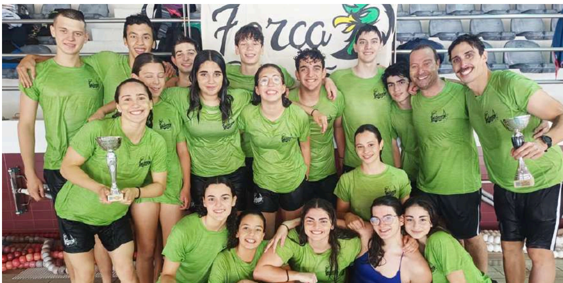
Nadadores dos Pimpões

A Piscina Municipal de Óbidos foi palco do Campeonato Distrital de Clubes, que decorreu nos dias 15 e 16 de junho, tendo estado presentes 190 atletas em representação de 12 equipas. Os Pimpões fez-se representar com as suas equipas de absolutos, feminina e masculina, no total de 17 nadadores.