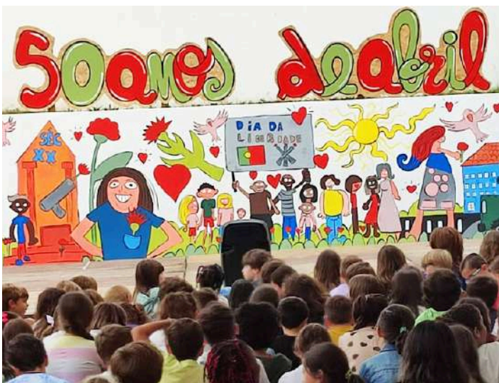
Inauguração do mural

Foi inaugurado na última semana de aulas deste ano letivo, na Escola Básica do Avenal, pertencente ao Agrupamento D. João II das Caldas da Rainha, um mural alusivo aos 50