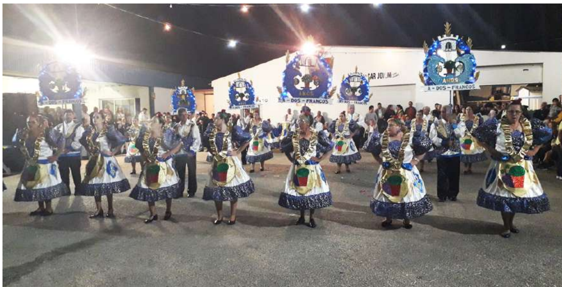
Animação na Areco

A Associação Recreativa e Cultural do Coto (Areco) organizou no passado sábado o desfile de marchas populares no exterior da sua sede.