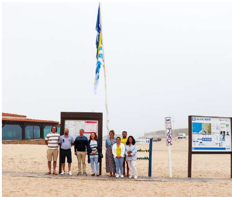
Vistoria no Baleal-Norte

Estiveram presentes nas vistorias representantes da Capitania do Porto de Peniche, Unidade de Saúde Pública, Agência Portuguesa do Ambiente, Turismo de Portugal e Câmara Municipal de Peniche, entidades promotoras da candidatura.