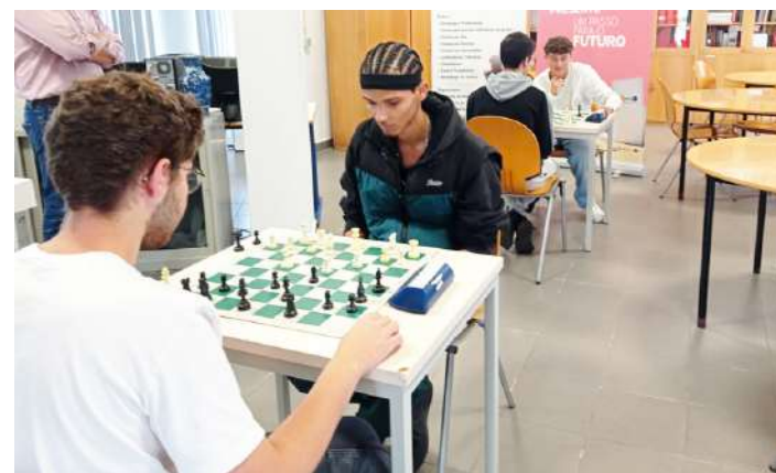
II Torneio de Xadrez Escola Técnica Empresarial do Oeste

A Escola Técnica Empresarial do Oeste, situada nas Caldas da Rainha, organizou no dia 1 de julho, o II Torneio de Xadrez Escola Técnica Empresarial do Oeste, que teve o apoio da Associação Peão Ca-