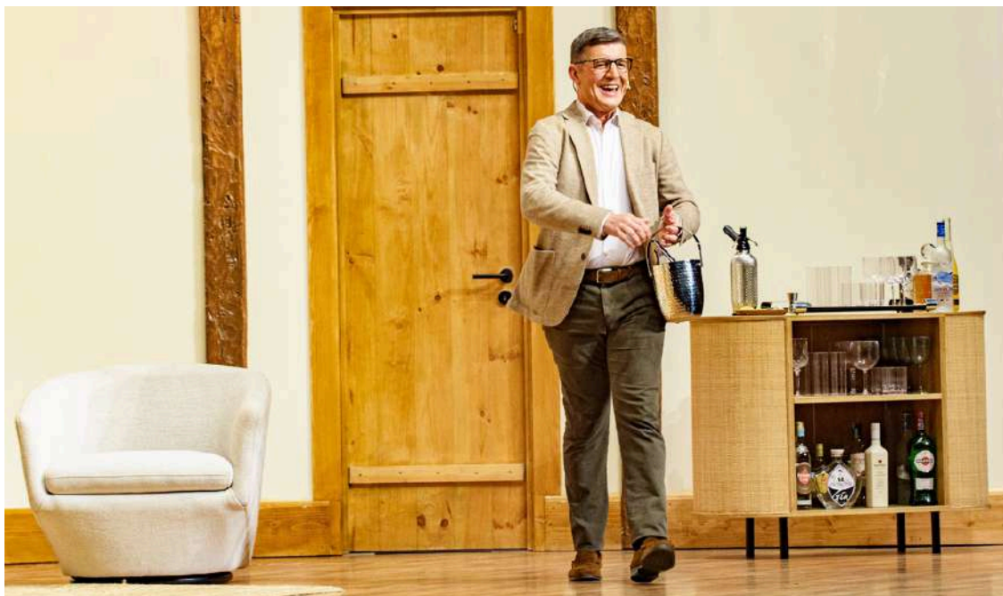
João Baião está muito feliz por voltar a Caldas da Rainha com novo espetáculo

Questionado sobre o que é que este espetáculo tem de impactante, respondeu que “é uma história galopante em termos de acontecimentos”. “Quando o público pensa que uma situação está resolvida vem outra mais complicada para resolver e as coisas têm lógica, fazem sentido, o que dá ainda mais graça”, explicou.