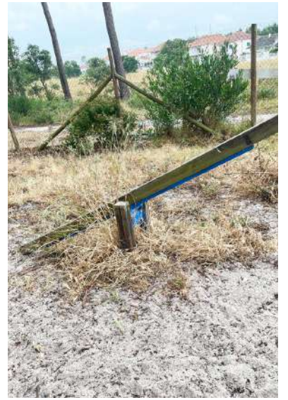
Imagens mostram falta de manutenção

vores a tapar um buraco, senão os cães fogem por aí”. Aliás, “um cão fugiu porque o portão fecha mal e o dono foi atrás”.