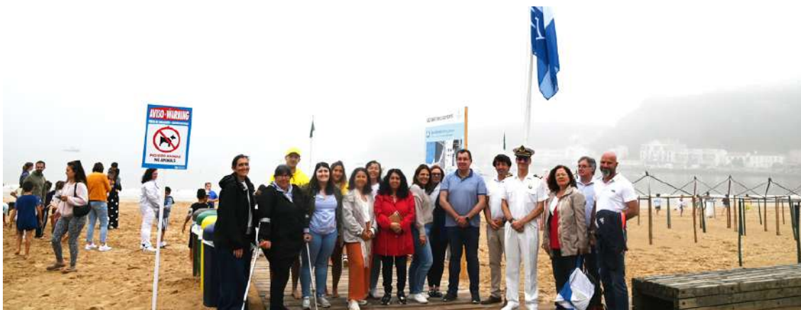
Cerimónia do haster da Bandeira Azul

Foram hasteadas em São Martinho do Porto, na manhã de 28 de junho, a Bandeira Azul e a Bandeira Praia Acessível – Praia Para Todos.