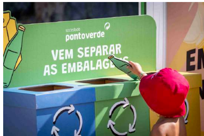
As crianças vão ser desafiadas para atividades que fomentam a reciclagem

No dia 4 de julho, entre as 09h00 e as 11h00, na praia de São Martinho do Porto, o roadshow da Academia Ponto Verde vai desafiar crianças e jovens a aprender sobre reciclagem de embalagens.