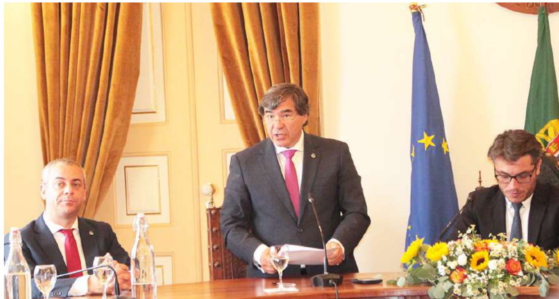
O presidente da Câmara, ao centro, no discurso da sessão solene

No capítulo da educação, vinco que “temos vindo a investir significativamente na manutenção e reabilitação dos estabelecimentos de educação e de ensino do concelho, requalificámos infraestruturas escolares, incluindo a compra de equipamentos de recreio, parques infantis,