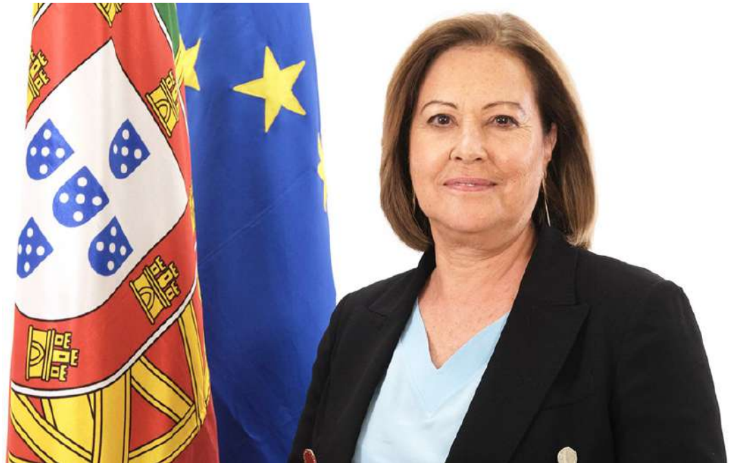
Margarida Blasco respondeu aos deputados do PSD na Assembleia da República

“O número de agentes efetivos da PSP na cidade das Caldas da Rainha tem vindo a diminuir nos últimos anos, trazendo notórias dificuldades na manutenção da ordem pública. O aumento da insegurança é uma realidade incontornável e fácil de constatar pelos constantes relatos noticiosos sobre a mesma”, referiram os deputados, que interrogaram se era do conhecimento da ministra “este problema latente” nas Caldas da Rainha, se estava