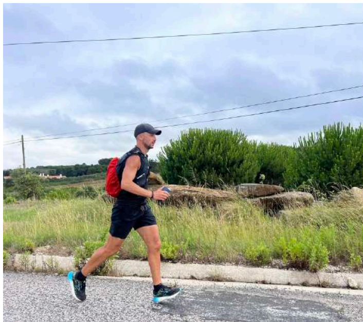
Perto da chegada ao Vau