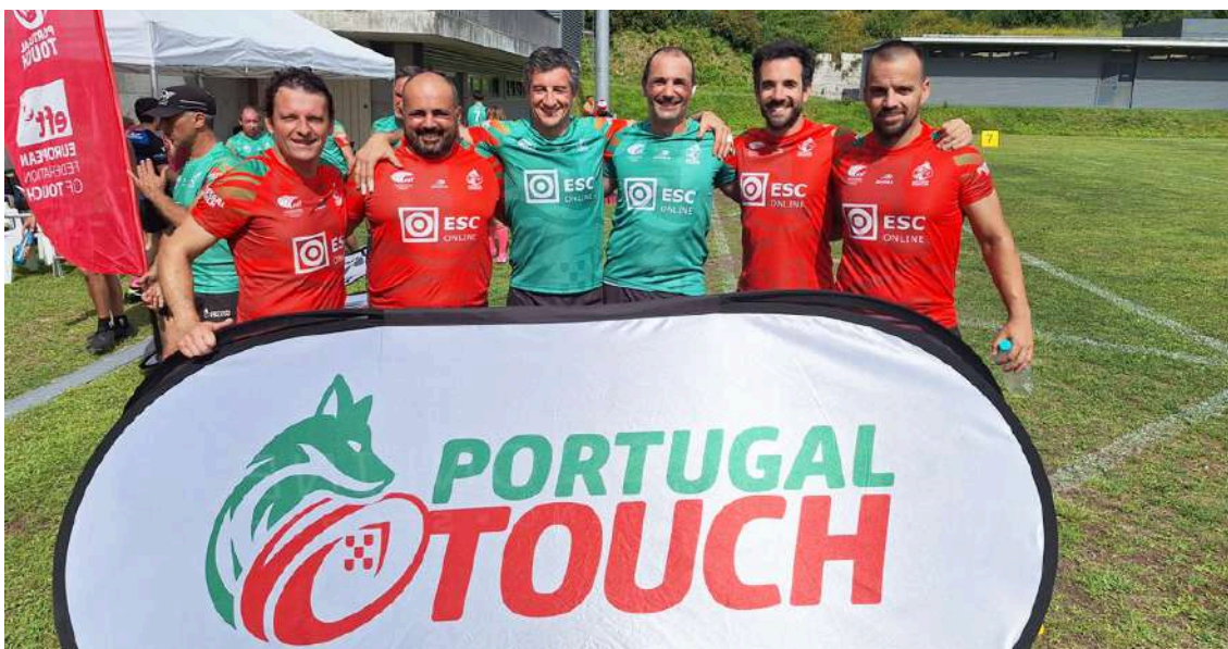
Jogadores da equipa caldense

Seis atletas do Caldas Rugby Clube Touch estiveram presentes em representação das seleções nacionais na 8ª edição do Torneio Internacional Arcos Touch.