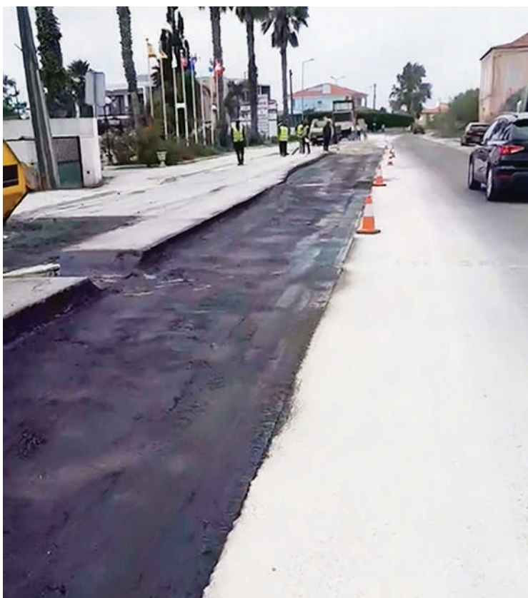
Obras foram iniciadas