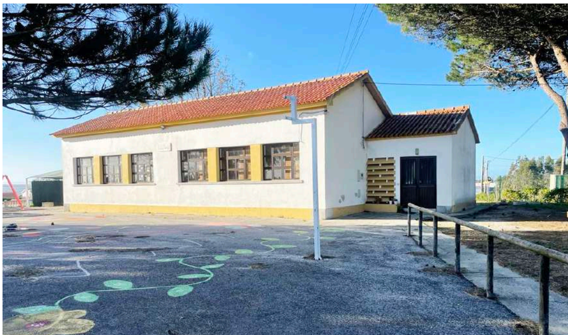
A autarquia estima a conclusão das obras na Escola do Coto em abril ou maio do próximo ano

Segundo o presidente da autarquia, “estamos a fazer a con-