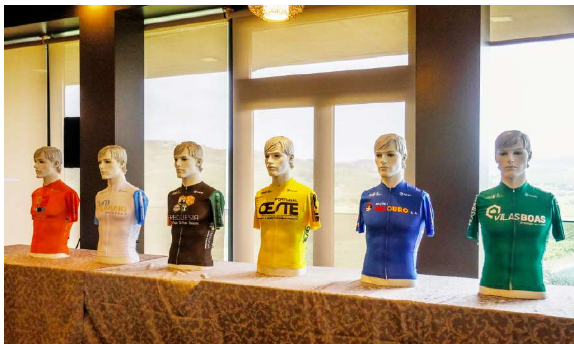
As camisolas em disputa numa prova que tem uma etapa a começar na Foz do Arelho

O pelotão da edição de 2024 vai contar com dezanove equipas, seis das quais provenientes