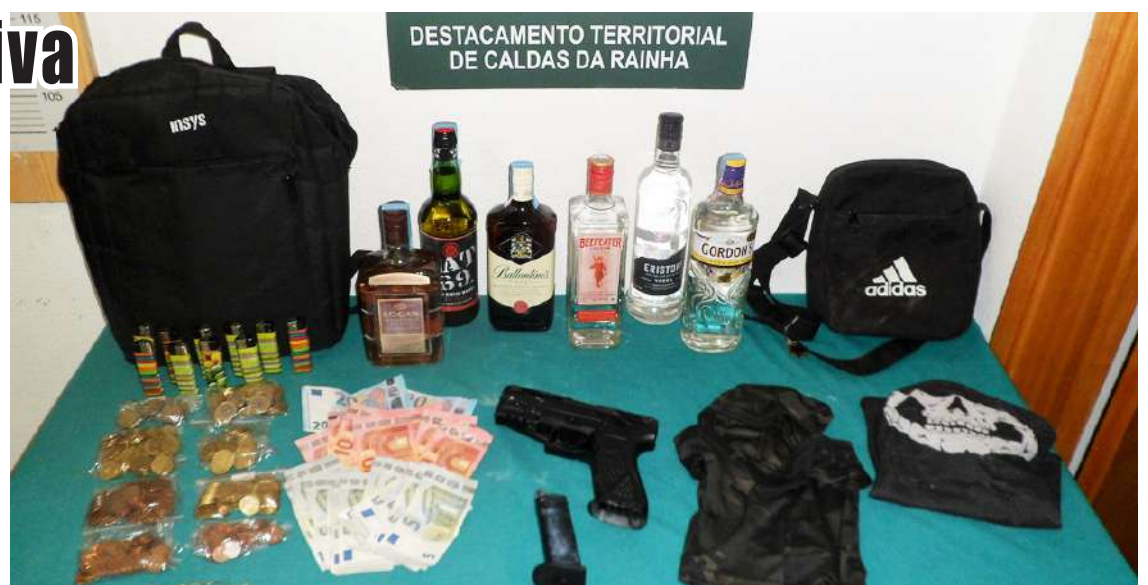
Artigos roubados de mercearia em Cela, Alcobaça, foram recuperados

do estabelecimento comercial e usaram uma viatura, que abandonaram poucos quilómetros depois, continuando a fuga a pé. Os militares conseguiram detetá-los e procederam à sua detenção em Cela Velha, no concelho de Alcobaça.