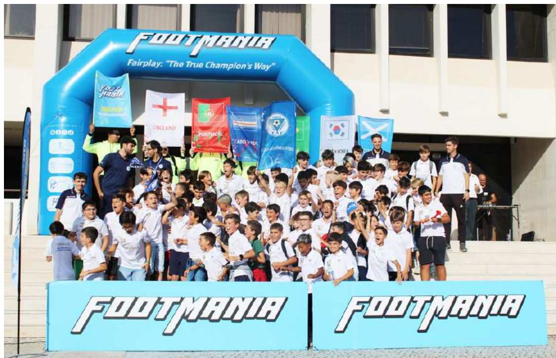
Receção nos Paços do Concelho

Os jogos têm transmissão direta no canal de Youtube do