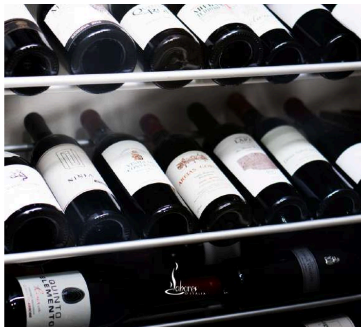
A carta de vinhos do Sabores D'Itália apresenta mais de 600 referências à disposição dos clientes

O Sabores D'Itália, cuja carta de vinhos apresenta mais de 600 referências à disposição dos clientes, ganhou o prémio Best of Award of Excellence. O restaurante é também detentor de um Certificado de Excelência do TripAdvisor e alvo de recomendação constante no Guia Michelin há mais de 20 anos.