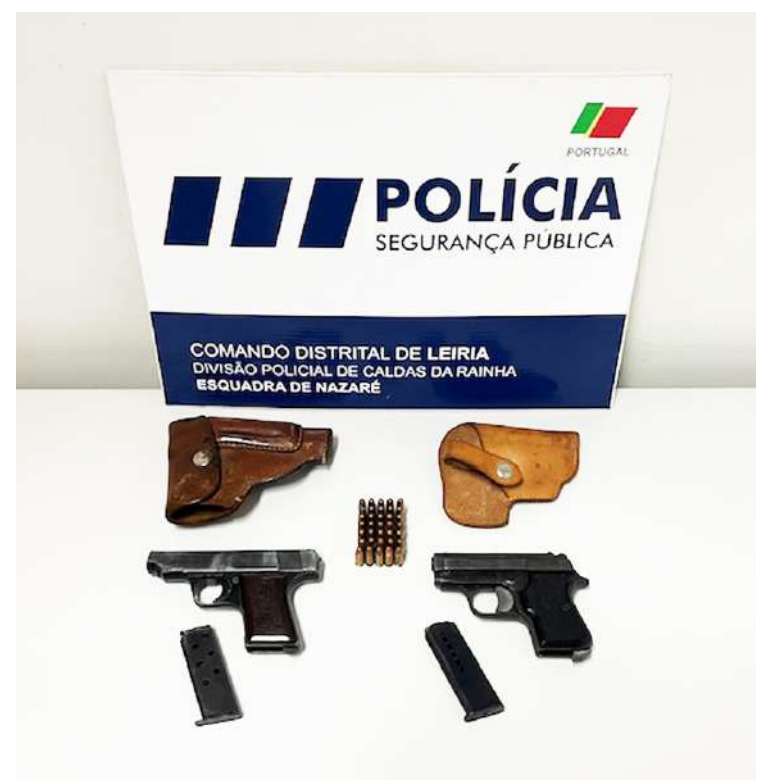
Apanhado com duas pistolas e 35 munições

O detido foi presente a Tribunal. Ficou em liberdade enquanto decorre o processo judicial, tendo-lhe sido aplicadas as medidas de coação de proibição de contacto com a antiga companheira alvo da violência doméstica, quer pessoalmente ou através de redes sociais, e proibição de aproximação do local de trabalho