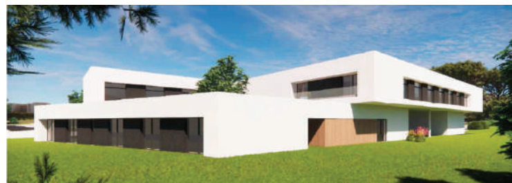
Edifício moderno para o Centro de Alojamento Temporário e de Emergência Social

Destaque ainda para o painel sobre migrações não seguras, exploração, discriminação versus