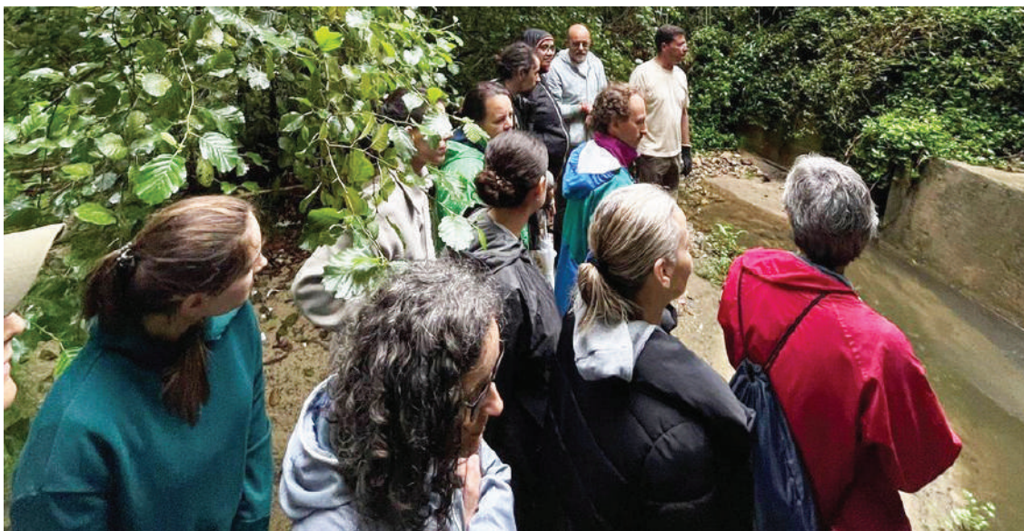
“O projeto do futuro “Parque do Rio da Cal” é de todos nós. Quem esteve presente percebeu o potencial deste espaço. Vamos continuar na limpeza das infestantes e das invasoras”, transmitiu a associação ambiental.

As inscrições devem ser feitas até às 15h00 do dia útil anterior à atividade.