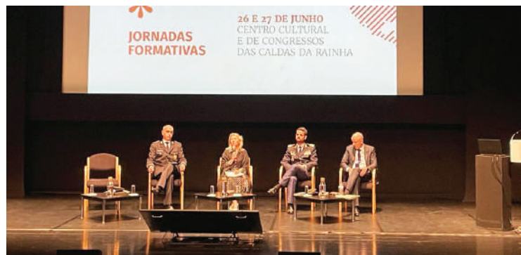
Autoridades policiais falam sobre migrações não seguras e exploração