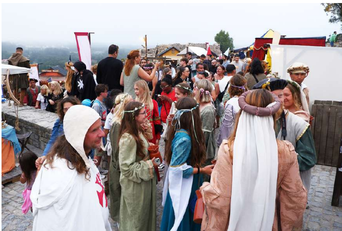
O mercado teve sempre muito público presente