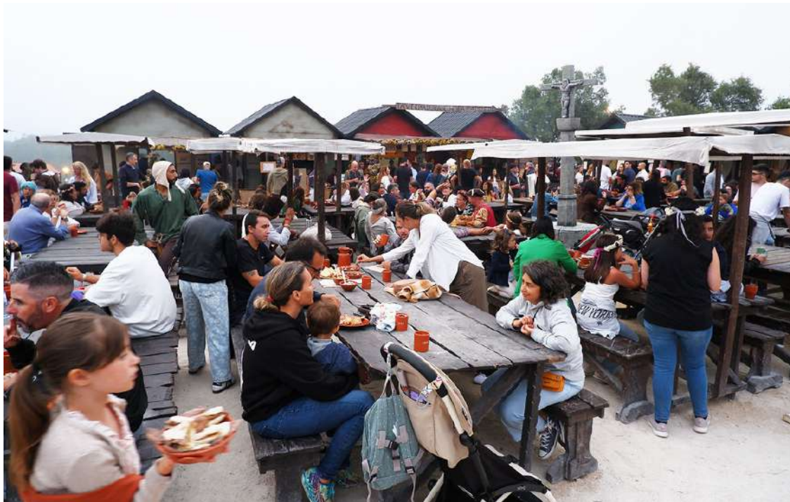
A gastronomia é um dos principais pontos de interesse do mercado

O Mercado Medieval de Óbidos regressa em 2025, de 17 a 27 de julho.