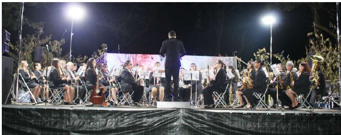
Filarmónica de A-dos-Francos

O parque das bicicletas no parque Carlos I, acolheu durante o mês de julho a iniciativa “Bandas no parque”, no âmbito do “CCC - Fora de Portas 2024”, em parceria com a Câmara Municipal das Caldas da Rainha e