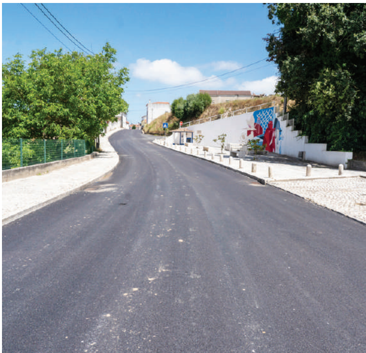
A freguesia do Vau foi a primeira a ser pavimentada

O Vau foi a primeira freguesia a ser intervencionada nesta fase, uma vez que não recebeu quaisquer trabalhos no procedimento anterior. A próxima freguesia a ser beneficiada será A-dos-Negros.