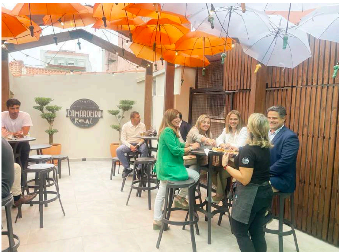
A esplanada é uma atração