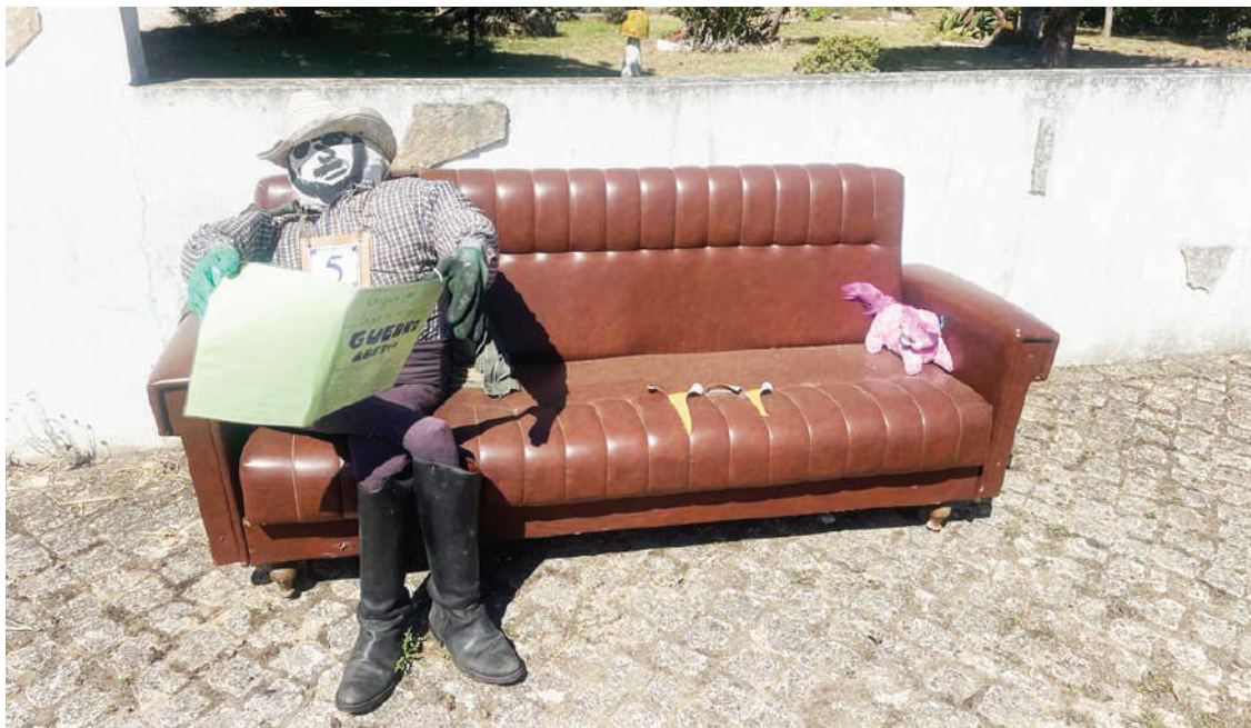
O evento desafia os habitantes a criarem os seus espantalhos

Quanto às críticas, o presidente da Junta de Alfeizerão, manifesta-se, “Isso é normal. É como