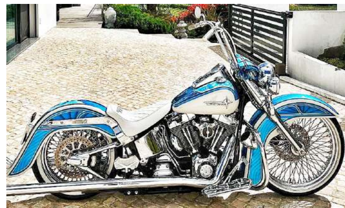
A Harley Heritage Softail Classic

O vice-presidente do Motoclube Lobos Lusitanos, fundado nas Caldas da Rainha em 2011, venceu dois prémios no Bike Show da 42ª Concentração do Moto Clube Faro, que decorreu de 18 a 21 de julho.