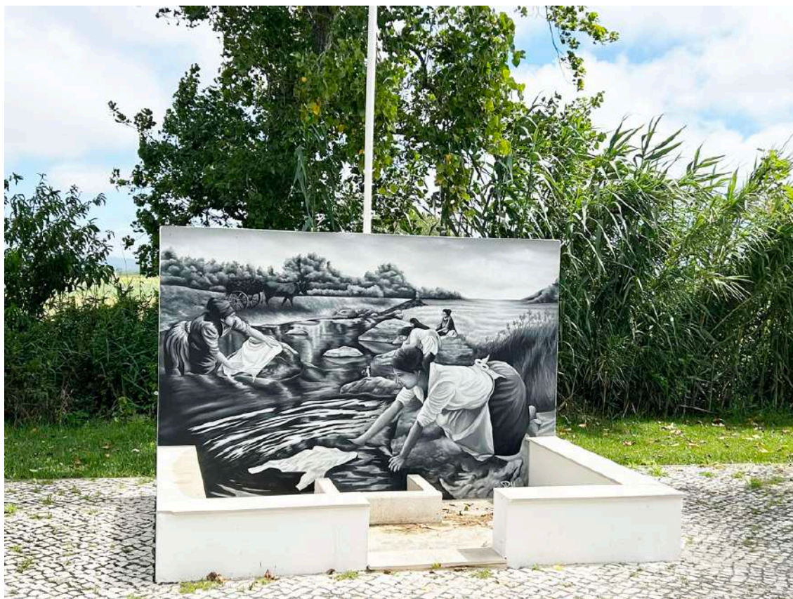
O mural é da autoria de Ricardo Henriques

O lavadouro da Ponte de Pedra, no Chão Da Parada, tem agora um mural de homenagem às lavadeiras da autoria de Ricardo Henriques.