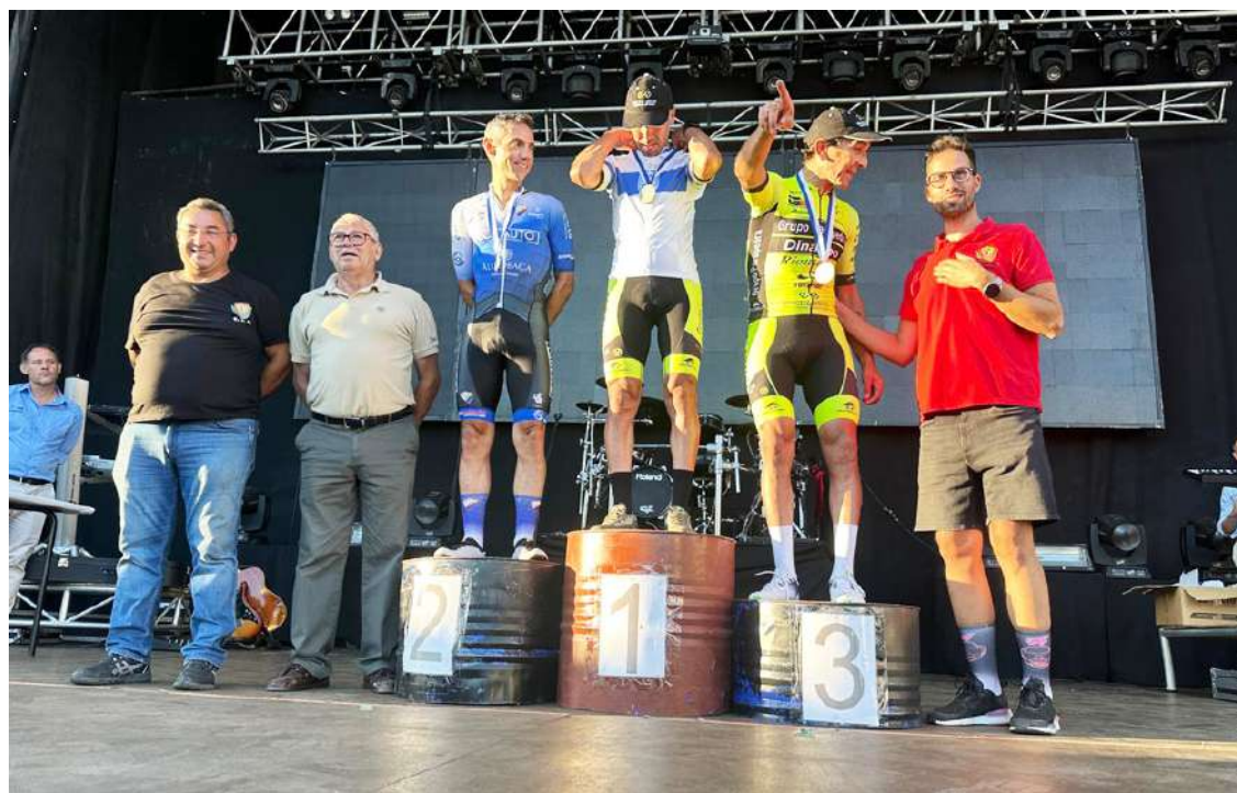
A equipa conquistou as duas camisolas de campeão regional

De salientar o excelente trabalho de equipa durante esta época, que já conquistou seis títulos individuais ( seis camisolas ), duas camisolas na taça de Portugal, um no campeonato