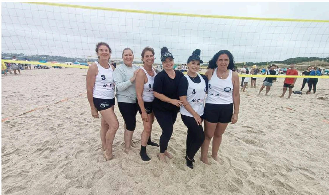
Equipa feminina da Associação Desportiva de Óbidos