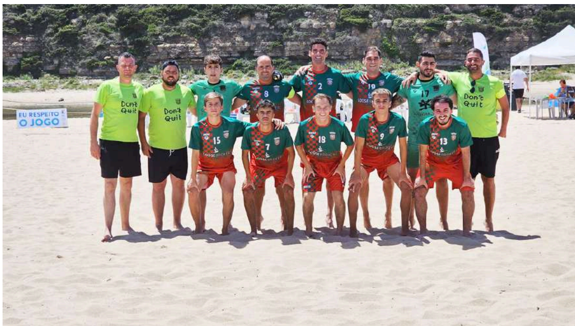
A equipa masculina de futebol de praia da Associação Desportiva de Alvorninha