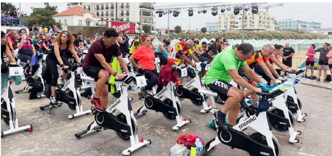
1200 pessoas pedalarão na praia durante 24 horas