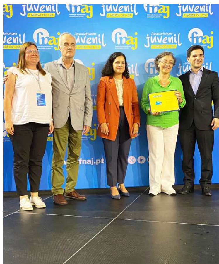
Jovens reunidos na sala do Gabinete da Juventude a darem ideias para atividades

Destas culminou a Youth Summit, uma Semana da Juventude com um novo conceito. É uma semana dedicada na totalidade aos jovens, em articulação com as escolas, com dinâmicas variadas, a nível cultural, social, desportivo, educacional, artístico e lúdico abrangendo gostos diferentes e desenvolvidas por toda a cidade.