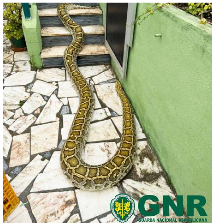
Os espécimes apreendidos foram entregues no Parque Zoológico de Lagos