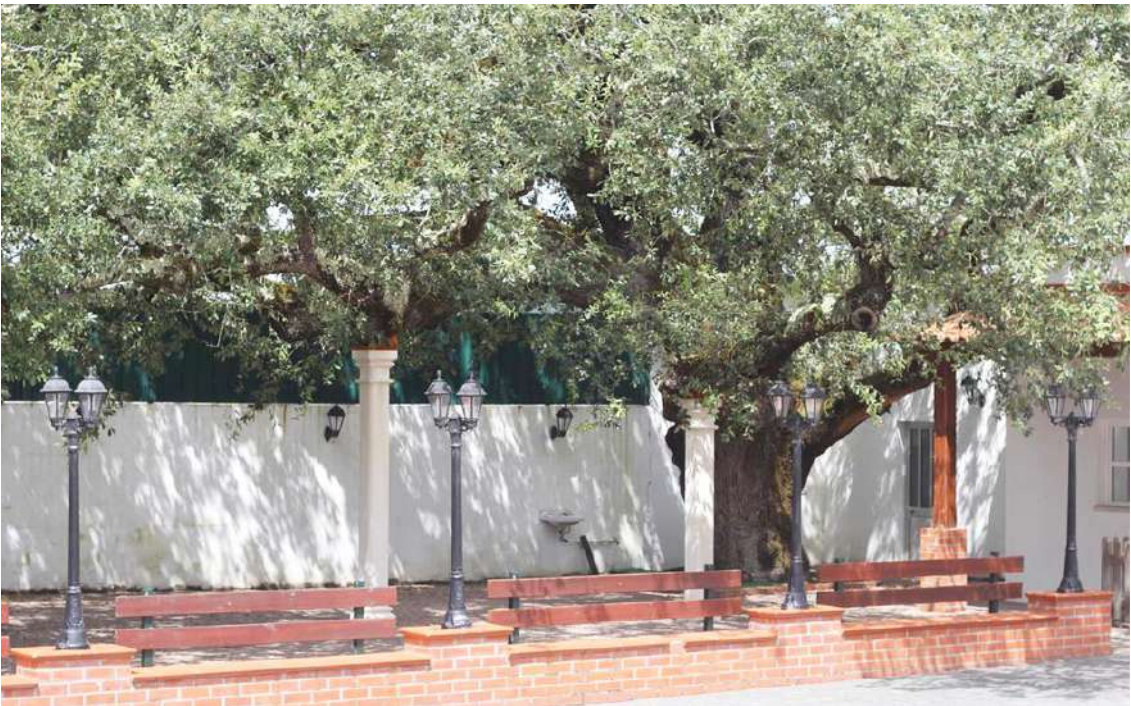
Carvalho em Alvorninha pode ser a primeira árvore classificada nas Caldas

O presidente da Câmara das Caldas revelou que “estão identificadas no concelho das Caldas da Rainha pelo menos mais quinze árvores imponentes, que contam muitos anos e são verdadeiros marcos da paisagem