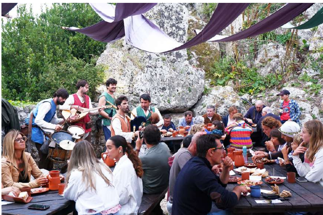
Tasca do Cavaleiro