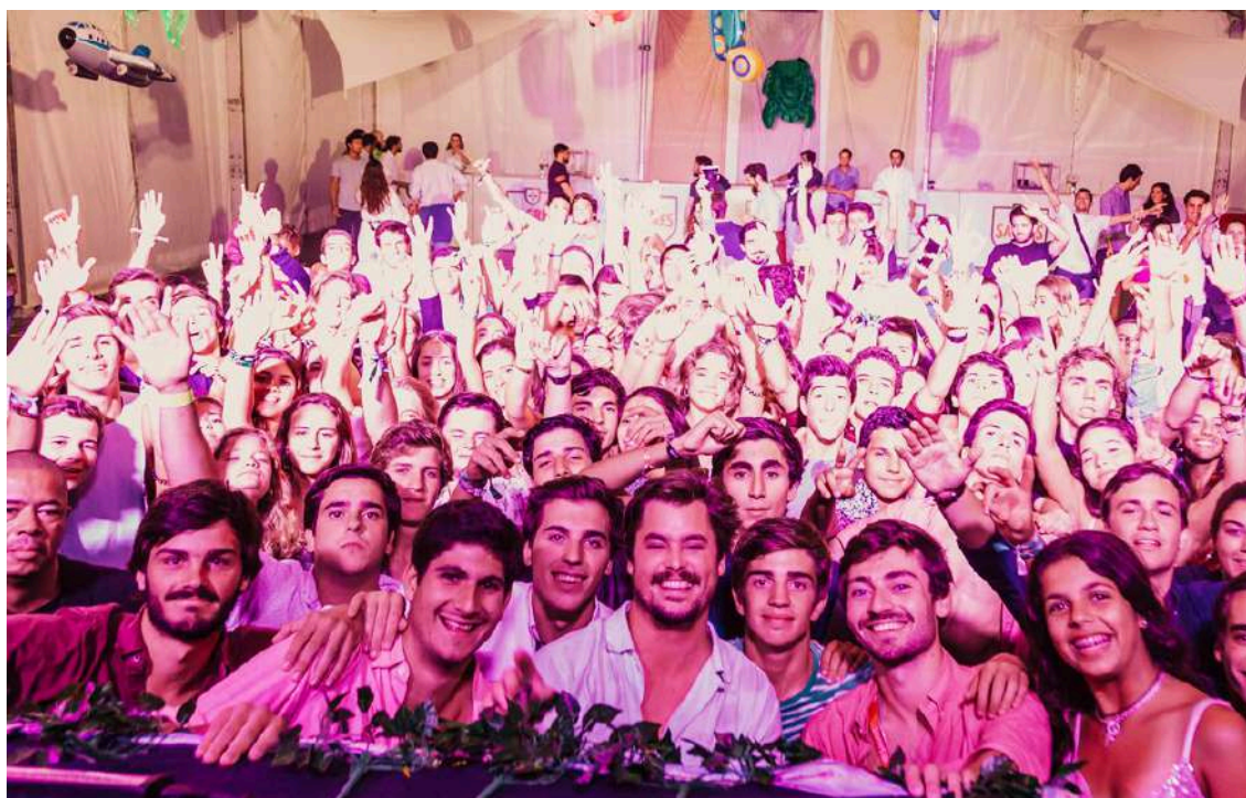
VerãoSão 2024 garante muitas novidades

O VerãoSão volta a São Martinho do Porto, com 11 festas para todas as idades. A organização quer que seja o “melhor verão de sempre!”.