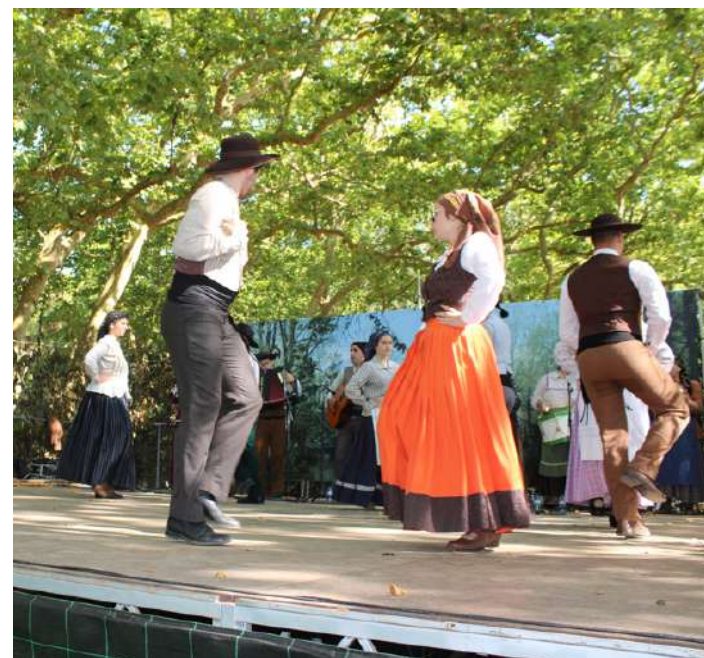
Rancho Folclórico “Flores da Primavera”

Decorreu na tarde do passado domingo, no Parque D. Carlos I a última atuação de “Dançantes no Parque”. Onde o grupo convidado foi o Rancho Folclórico “Flores de Pri-