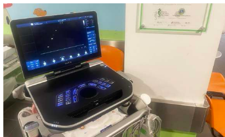
O ecógrafo, é uma ferramenta essencial em cardiologia pediátrica

Contribuiu para a compra de duas carrinhas para os Centros de Acolhimento Temporário de