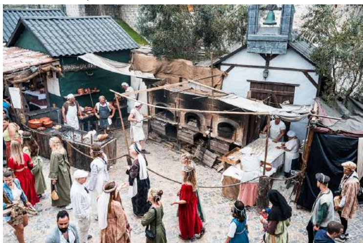
Banda das Gaeiras