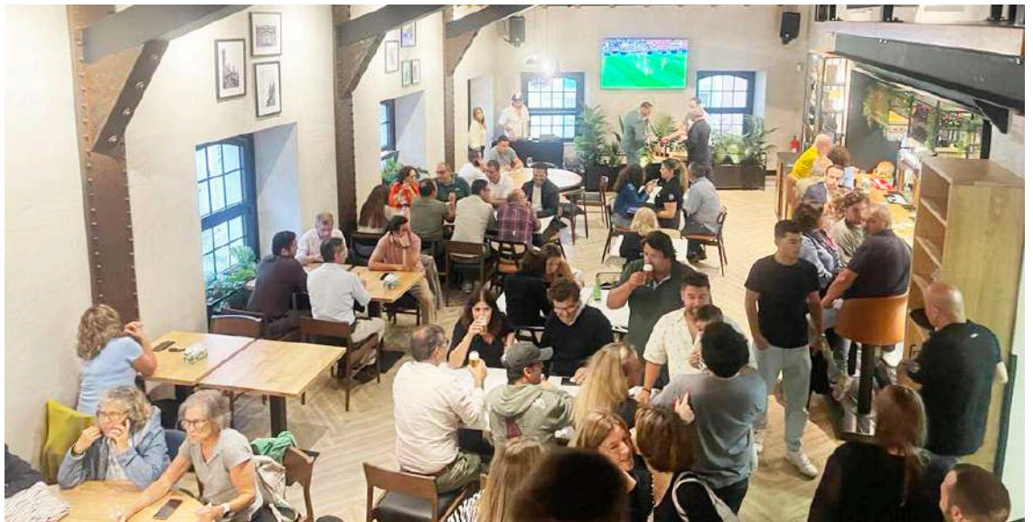
A famosa cervejaria “Camaroeiro Real”, em Caldas da Rainha reabriu

O Camaroeiro está aberto de terça-feira a quinta-feira sábado, com serviço de almoço das 12h00 às 15h00 e jantar das 18h30 às 24h00. Sextas e sábados funciona das 12h00 às 15h00 e das 18h30 até às 2h00. O estabelecimento encerra aos domingos e segundas-feiras.