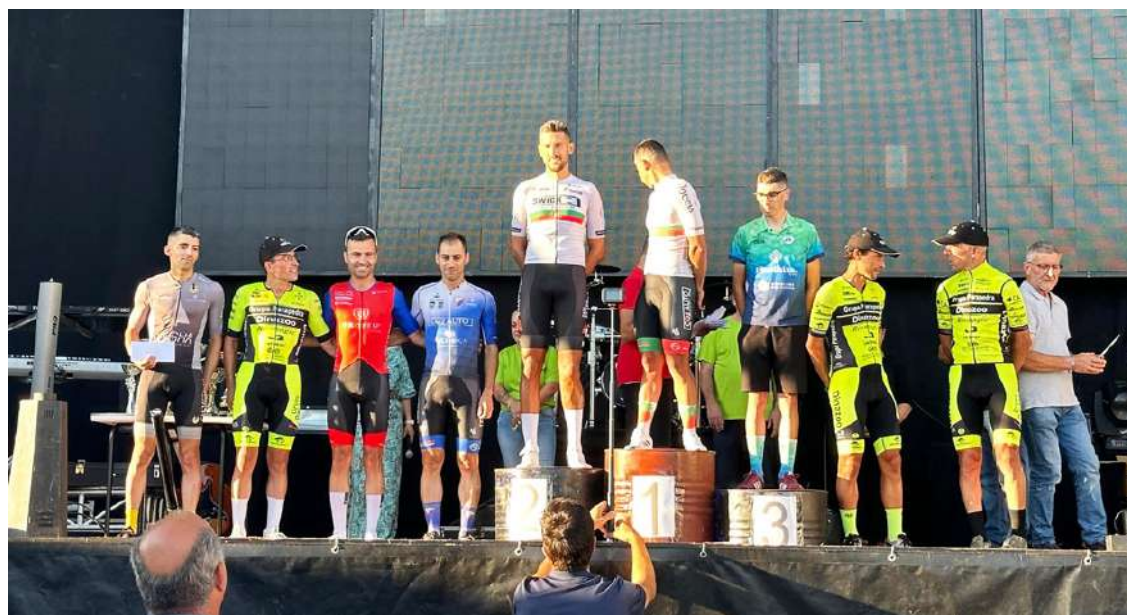
Coletivamente a equipa conquistou o 2º lugar

nacional de fundo, um no campeonato nacional contra relógio