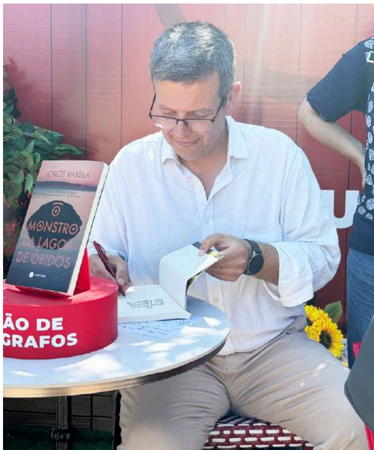
“O Monstro da Lagoa de Óbidos” já foi apresentado na Feira do Livro de Lisboa