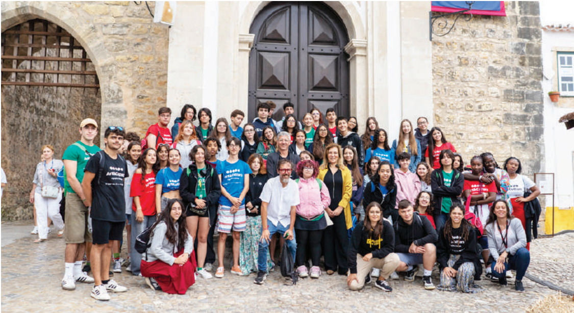
Óbidos recebeu um grupo de 50 jovens do ensino secundário e profissional

Óbidos recebeu na quinta-feira, 25 de julho, um grupo de 50 jovens alunos do ensino secundário e profissional, a quem deu a conhecer, através de várias experiências e dinâmicas, o contexto histórico, cultural e criativo do território.