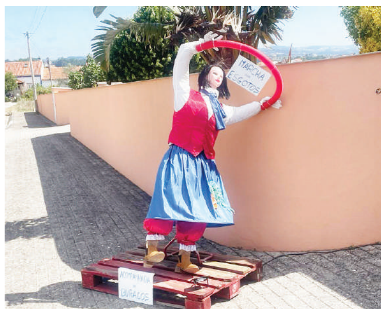
“Espanta Festival” em Valado de Santa Quitéria

Esta “arte rural” culmina com a entrega de prémios aos autores dos espantalhos mais criativos. Os prémios vão ser entregues no dia 25 de agosto, no dia de Santa Quitéria, depois da missa e da procissão.