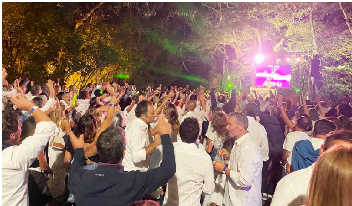
A Festa Branca de 2023 foi um grande sucesso

Relativamente às expectativas para esta edição o presidente acredita que se tem “registra-