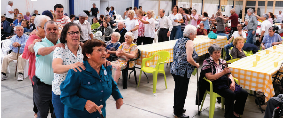
Dia Mundial dos Avós foi assinalado no Cadaval

No passado dia 26 de julho, o Dia Mundial dos Avós foi assinalado no Cadaval com a 18.ª edição das “Tasquinhas dos Avós”.