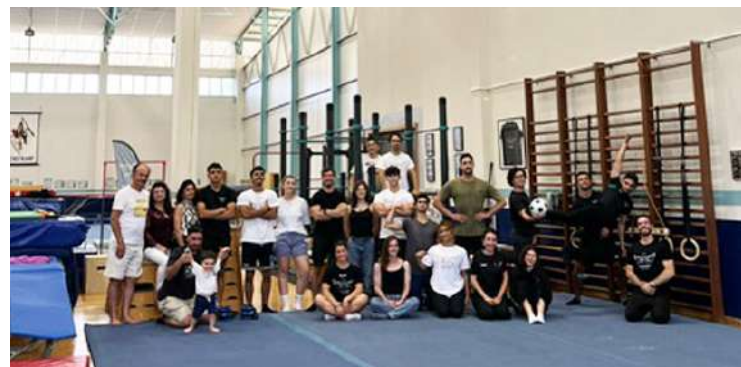
Os participantes do evento