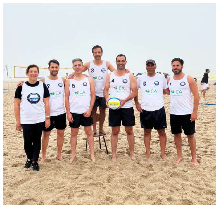
Os autarcas de Óbidos também participaram com uma equipa

Compareceram equipas/atletas desde Óbidos, Caldas da Rainha, Bombarral, Torres Vedras, Peniche, S. Martinho do Porto, Anadia, Oliveira do Bairro, Marinha Grande, Lisboa, Aveiro, Almada, Seixal, Amora, Pataias, Alcobaca, Santarém, Cartaxo, Oeiras, Porto, Leiria, Coimbra, Sintra, Sesimbra, Alenquer, Lourenço, Soure, Batalha, Nazaré, Cadaval, Alcanena, Torres Novas, Vila Nova de Milfontes, Setúbal e Chaves.