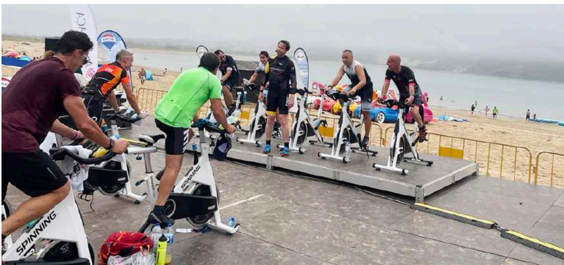
Os atletas “são acompanhados pelos melhores instrutores

A organização do Internacional beach 24h tem uma grande logística e conta também com o apoio de algumas empresas e entidades da região.