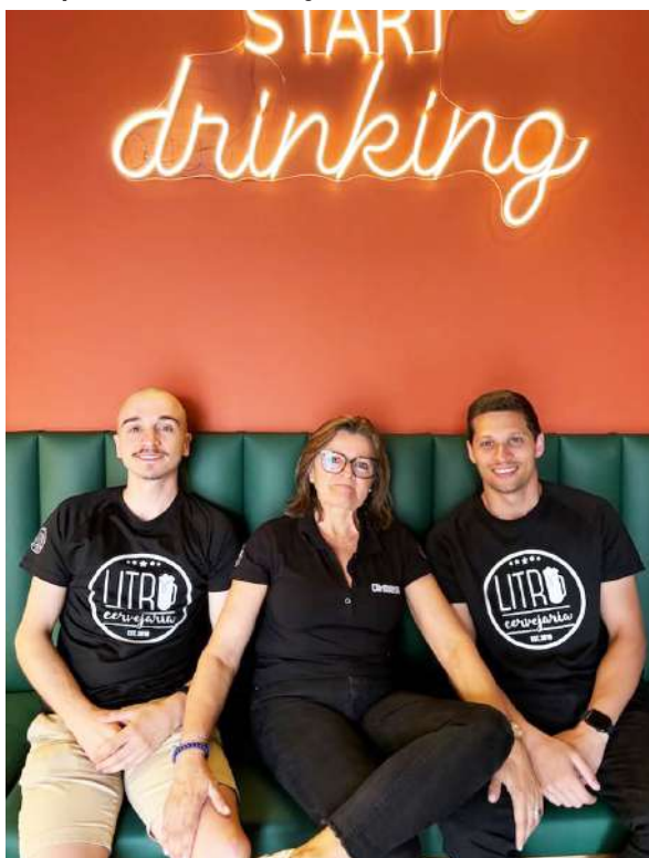
Os novos proprietários quiseram trazer de volta o Camaroeiro Real “símbolo icónico da cidade