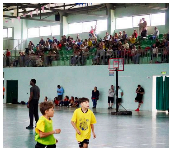
Evento organizado pelo Sporting Clube das Caldas

O basquetebol do Sporting Clube das Caldas organizou os festejos do Dia Nacional do Mini Basquetebol, no dia 10 de junho, com a colaboração da Associação Cultural e Recreativa do Nadadouro, em cujas instalações desportivas decorreram atividades.