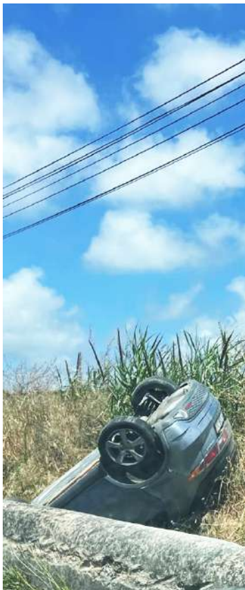
Despiste na EN8, em Óbidos, apenas com danos materiais