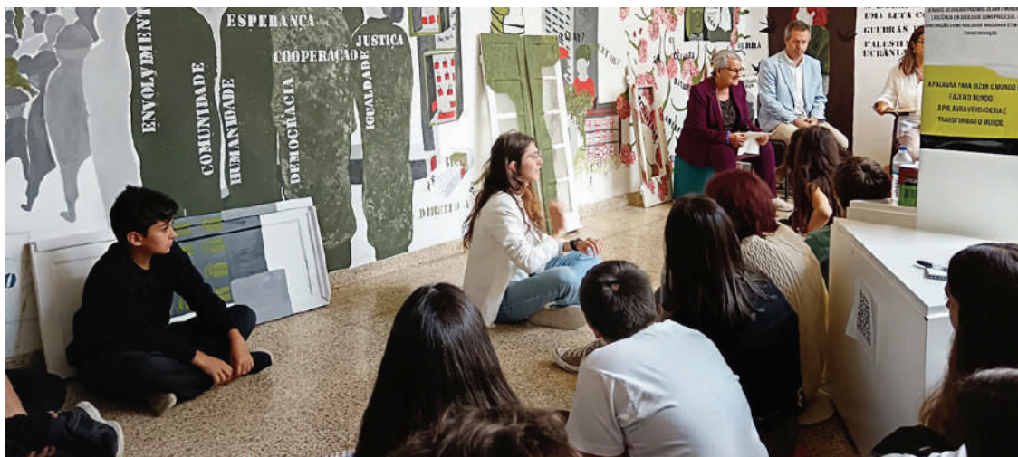
O mural está na Sala de Processos do agrupamento

Na cerimónia houve uma performance criada por alunos do 7º ano, que interagiu com as janelas do mural.