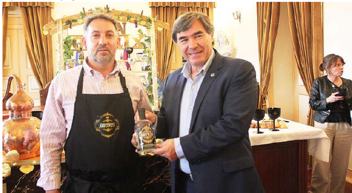
O mentor do Gin com o presidente da Câmara