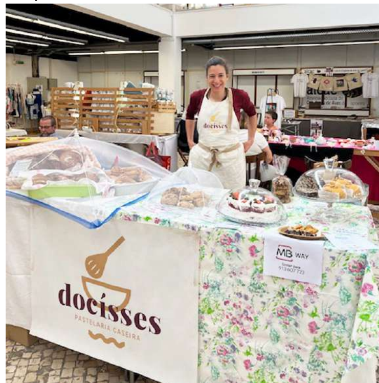
Docisses com pastelaria saudável