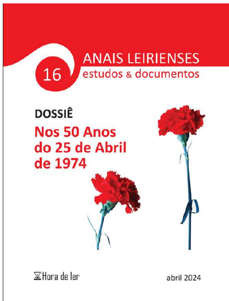
Capa da obra que vai ser apresentada