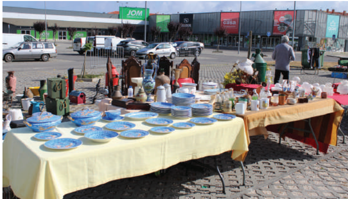
Evento é organizado pela associação Nova Versão

O encontro de velharias e antiquidades regressou no passado sábado ao parque de estacionamento do Leroy Merlin e Jom, nas Caldas da Rainha, onde estiveram expostos para venda artigos em segunda mão, como livros, roupas, peças cerâmicas, moedas, entre um grande número de