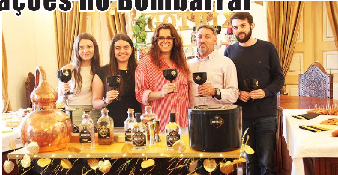
O produto é um projeto familiar

O Gin Gotrix pode ser adquirido online e pretende-se que tenha projeção nacional e internacional.