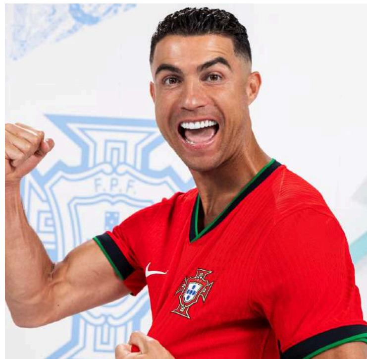
O futebolista alia o seu nome à marca das peças cerâmicas produzidas nas Caldas da Rainha

Adotando uma postura moderna e empreendedora, ao manter a integridade da tradição, recorrendo aos motivos naturalistas na origem do grande projeto bordalliano, a par das técnicas de fabrico ancestrais, dominadas por artesãos especializados na modelação, pintura, escultura