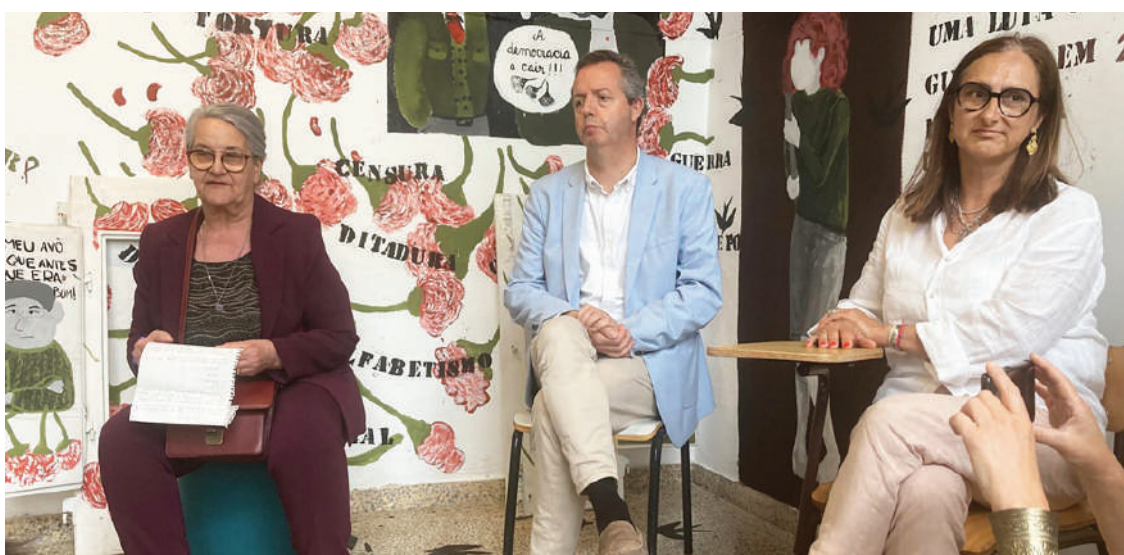
Convidados falaram sobre a liberdade como uma luta constante