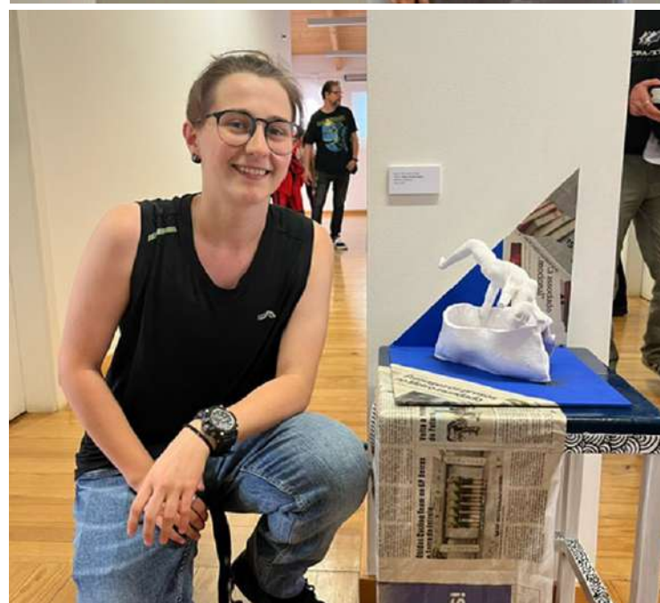
Duas finalistas de Artes Visuais da Escola Secundária Raul Proença com os seus trabalhos