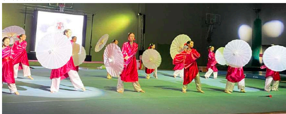
O Grupo Super Flash