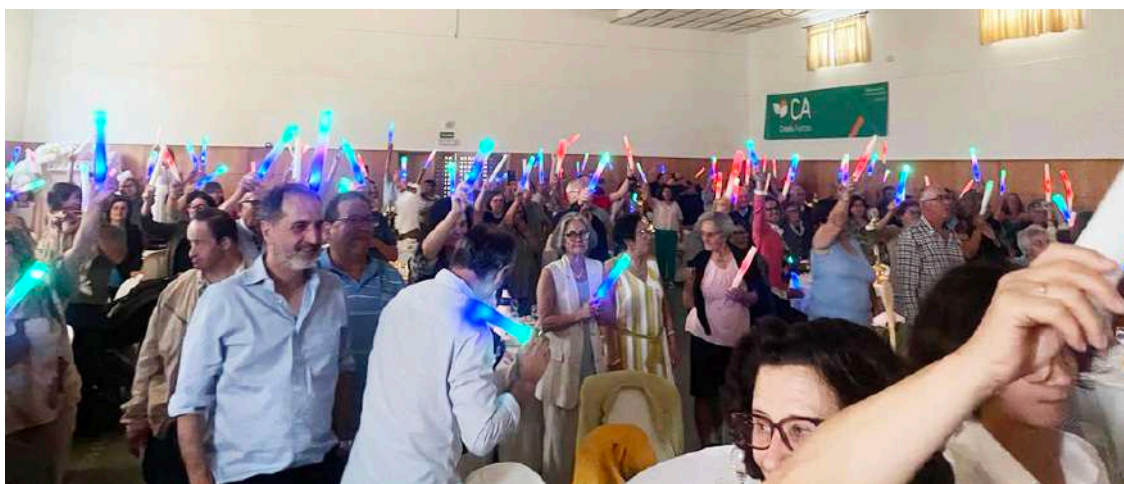
Uma festa entre familiares, amigos e a comunidade do Casal Pardo