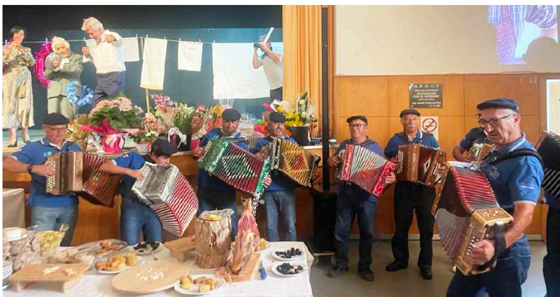
O Grupo de Concertinas de Óbidos surpreendeu a aniversariante