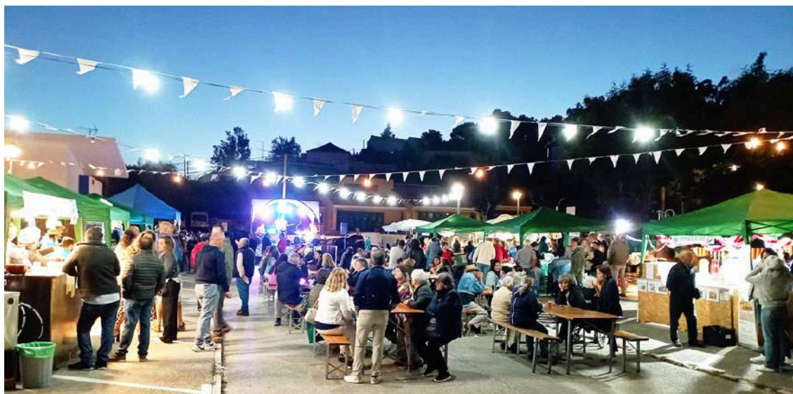
Ao jantar houve animação musical

A iniciativa Vidais ao Luar realizou-se no dia 15 de junho, com gastronomia, cocktail show, música e caminhada.