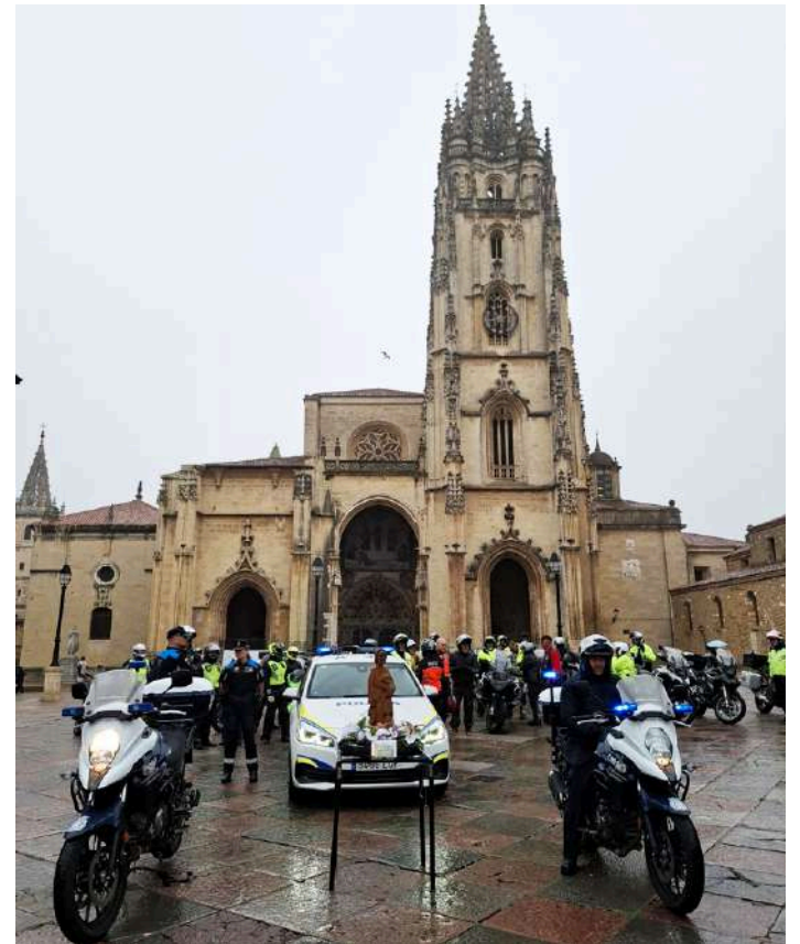
A imagem foi escoltada por motards policiais a partir de Oviedo

A imagem do Arcanjo São Rafael, protetor dos polícias motards saiu da igreja de São Pedro, em Peniche, para o Santuário de Nossa Senhora de Covadonga, situado nas Astúrias (Espanha).