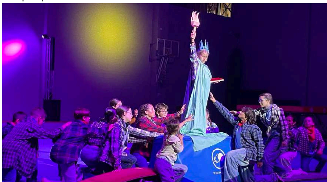
Alusão ao continente americano