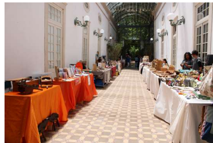
Mercado de artesanato

O Céu de Vidro, no Parque D. Carlos I, nas Caldas da Rainha, recebeu no passado fim de semana um mercado de artesanato, que funcionou das 10h00 às 19h00, com entradas livres.