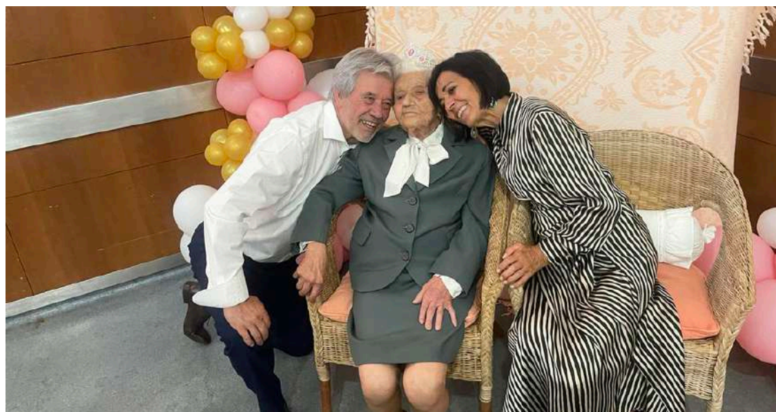
A aniversariante e os filhos