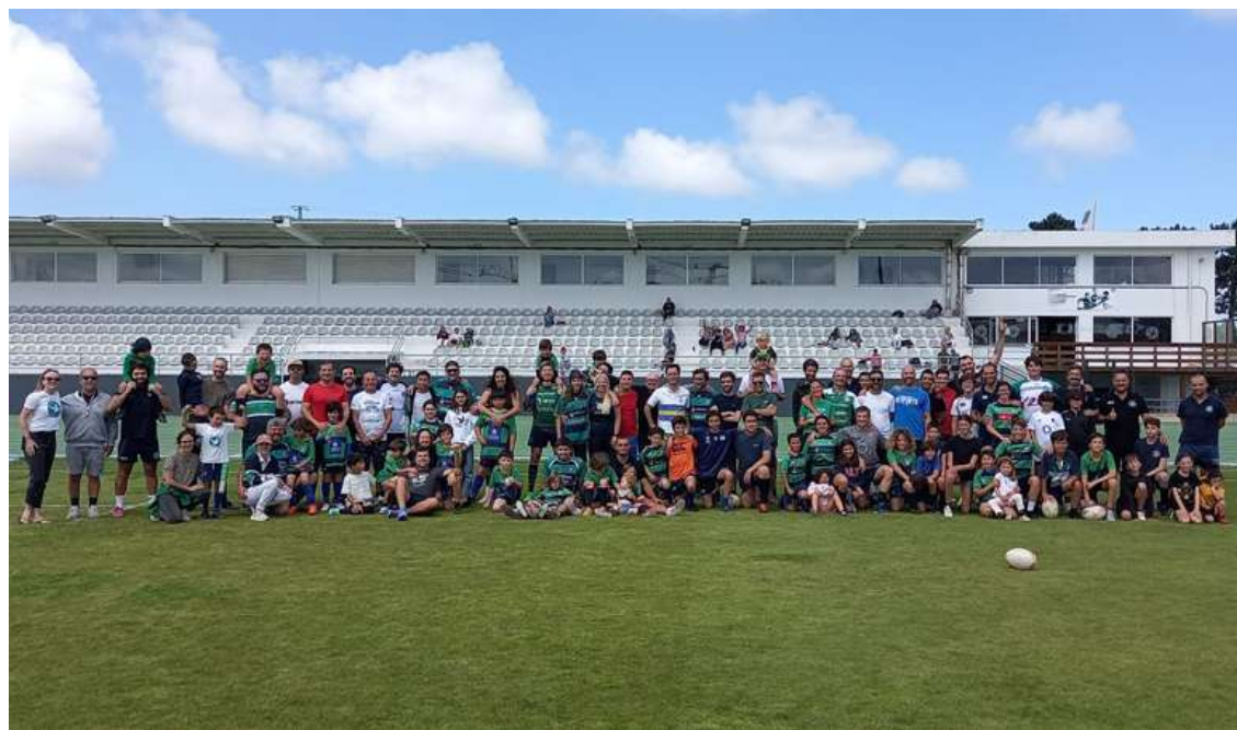
Convívio no Estádio Dr. José Luis de Melo Silveira Botelho