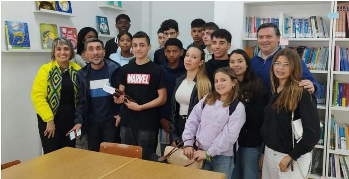
Mobilidade de alunos a Ourense, Espanha

Neste ano letivo, o Agrupamento de Escolas D. Luís de Ataíde, de Peniche, desenvolveu atividades internacionais, no âmbito do Programa Erasmus+, como mobilidade de alunos e formação.