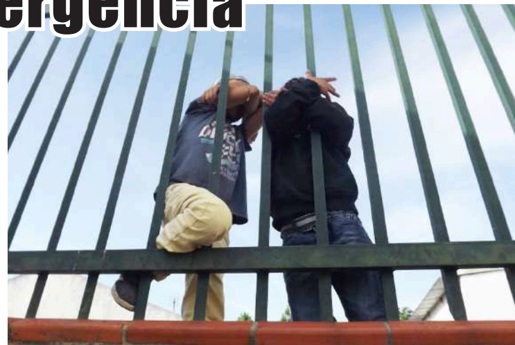
A InPulsar foi escolhida como parceira no projeto de construção nas Caldas de um Centro de Alojamento de Emergência Social