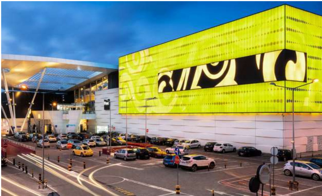
Jovens foram detidas no centro comercial Leiria Shopping

Duas jovens de 19 e 20 anos, suspeitas de furtos de peças de vestuário e de cosmética nas Caldas da Rainha, Marinha Grande e Figueira da Foz, foram detidas quando tentavam fazer o mesmo no centro comercial Leiria Shopping, no passado dia 11.