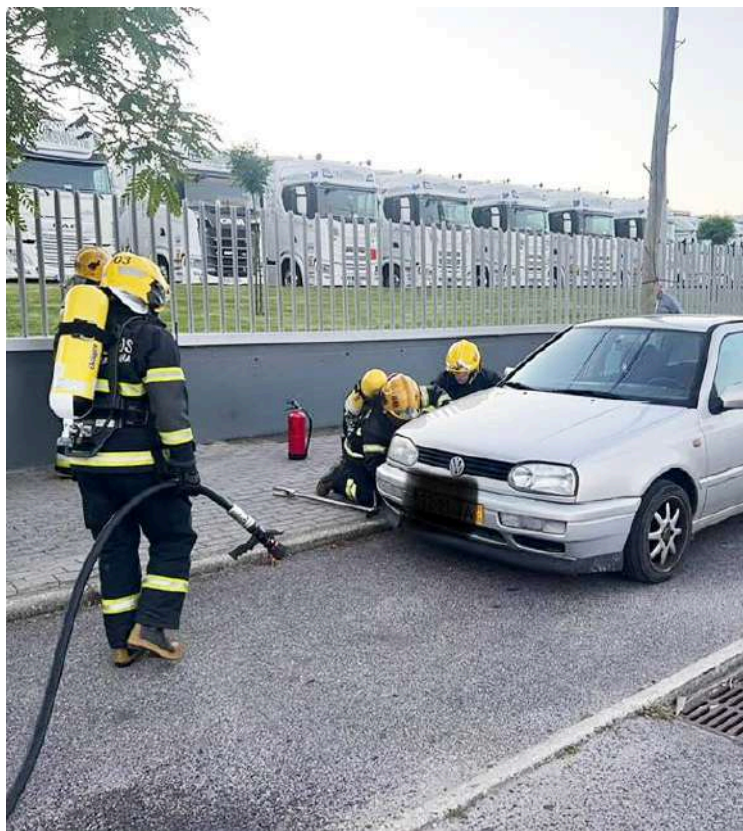
Os bombeiros resolveram uma situação de aquecimento anormal com bastante fumo a emanar da zona do motor de um carro estacionado na Zona Industrial das Caldas da Rainha