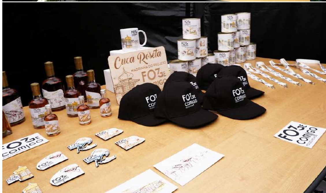
O “merchandising” da nova imagem de promoção turística

que seja melhor do que um dia bom na praia da Foz do Arelho”, afirmou, assumindo-se “embaixadora de um lugar que eu amo”.