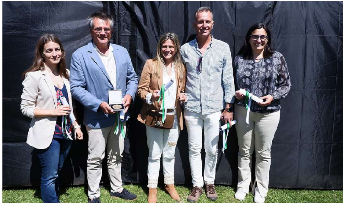
Parte dos descendentes dos fundadores da Condaço

11 anos. “Quando começaram a laborar foi onde está agora o arrabal da Foz”, contou.