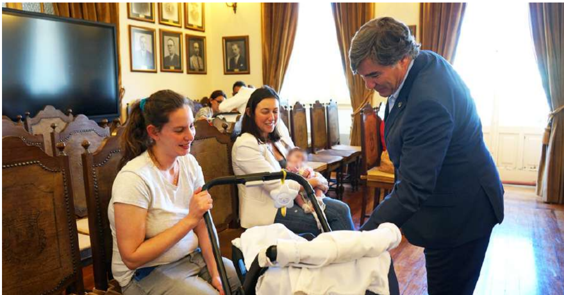
O presidente da Câmara do Bombarral distribuiu mais kits

O Salão Nobre dos Paços do Concelho recebeu na tarde da passada quinta-feira uma sessão de entrega de Kits Recém-Nascido, no âmbito do projeto “Oeste + Grávida”.