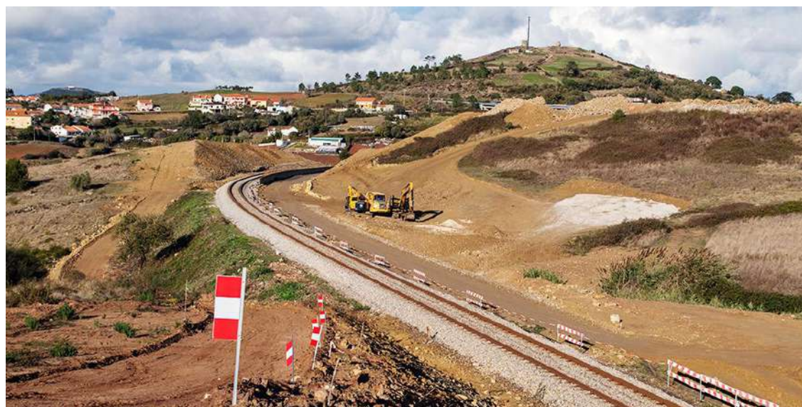
As obras estão a decorrer mas os prazos não serão cumpridos, afirma a Comissão Para a Defesa da Linha do Oeste

que irão circular na Linha do Oeste. “Em 2025, farão testes e receberão a homologação e em 2026, passarão a circular, se a energia elétrica já tiver chegado à Linha nessa altura”, refere a comissão.