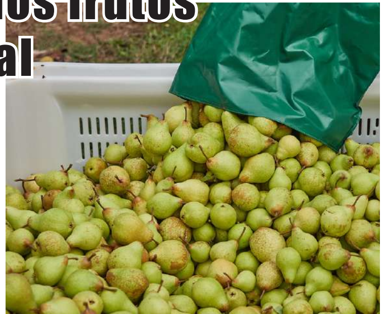
A exportação de Pera Rocha tem vindo a crescer, superando 60% da produção nos últimos anos

O futuro, no entanto, apresenta oportunidades promissoras. A ANP tem vindo a trabalhar com investigadores nacionais com vista ao melhoramento genético da Pera Rocha, visando adaptá-la às mudanças climáticas e aumentar sua resistência a doenças, sem perder suas características distintivas. A promoção internacional também é um foco crucial para a ANP, com esforços contínuos para dar a conhecer as características distintivas da