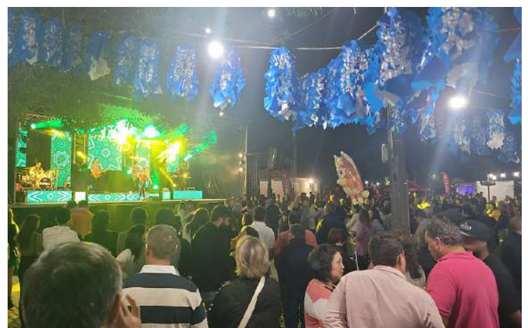
Tasquinhas com muita animação