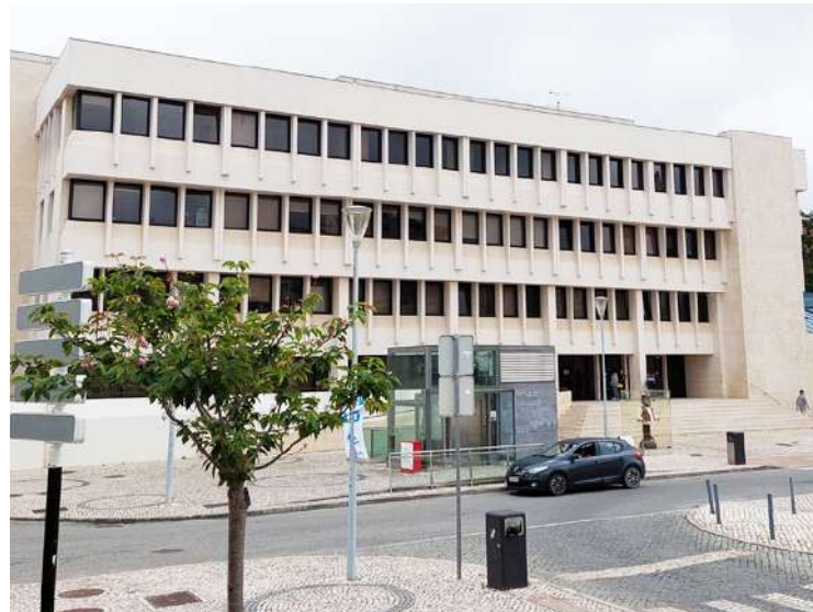
Foi rejeitada a eventualidade de alguns funcionários da Câmara militantes do PSD estarem a ser perseguidos pelo executivo do Vamos Mudar

Os vereadores do PSD alertaram para “as consequências orçamentais, em futuro próximo, desse sobredimensionamento,