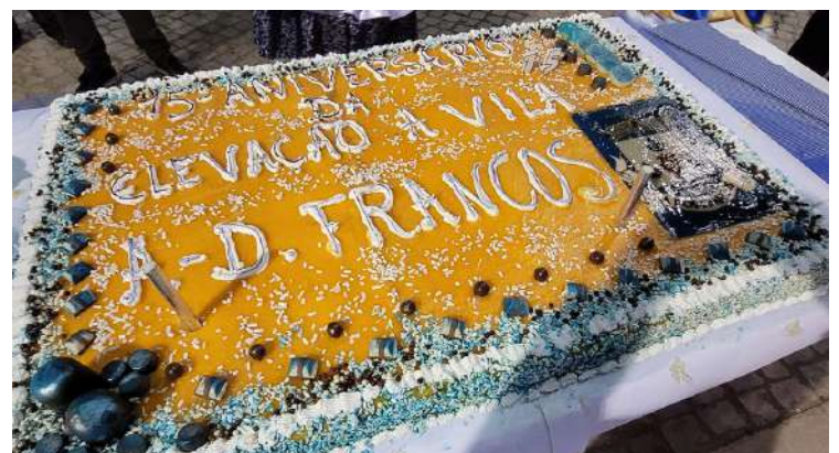
O bolo de aniversário de A-dos-Francos

O presidente da Câmara quer continuar a promover “o destino da Foz do Arelho” e desta forma ajudar ao seu crescimento.