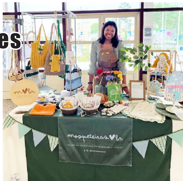
Mosqueteiras.br com crochet