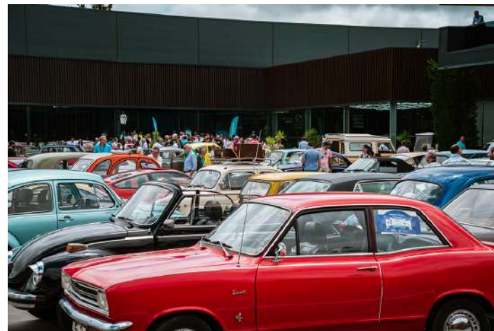
Os carros estiveram em exposição na Benedita

No passado domingo realizou-se a 2ª edição do Festival Clássicos Benedita e houve mais de 100 relíquias automóveis a passearem pelas estradas da região, num evento com organização partilhada entre a Benecar, Vitorinos Seguros e Clássicos Portugal.