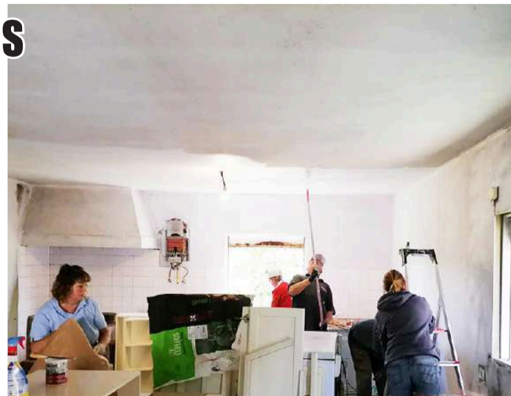
Voluntários têm ajudado a remodelar habitação