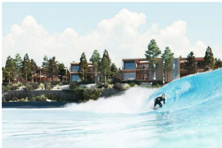
O Surf Parque Óbidos poderá abrir ao público em julho de 2026

reforçar as marcas do Oeste, Peniche e Surf definidas pelo Turismo Centro de Portugal e vai integrar as zonas de elite de surf em Portugal, como a praia dos Supertubos, juntamente com a Ericeira e Nazaré.