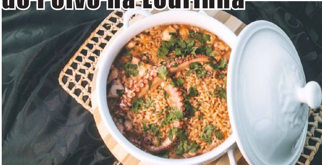
Prato do Mar do Norte by Lilly Pozo