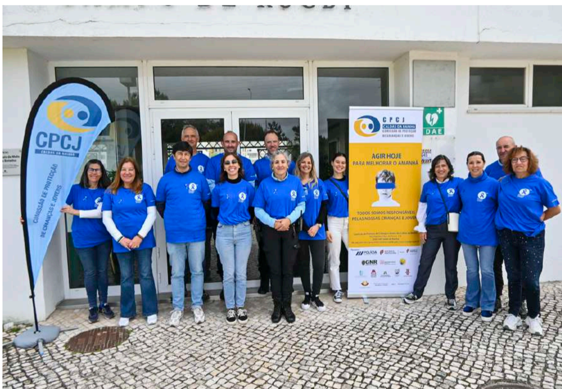
A iniciativa foi organizada pela Comissão de Proteção de Crianças e Jovens das Caldas da Rainha

Outra problemática é os imigrantes que “vêm viver para Portugal, mas continuam com a sua cultura e muitos não querem vacinar os filhos e não cumprem as consultas e o Sistema Nacional de Saúde não consegue controlar”, contou. “Vêm à procura de uma vida melhor e o objetivo deles é trabalhar e a criança fica numa ama ilegal, que não é uma resposta mais adequada e quando são confrontadas acham natural, porque na cultura deles é assim. A criança não é valorizada, mas isso é um trabalho que tem de ser feito de sensibilização às novas famílias que vêm de origens diferentes”, adiantou.