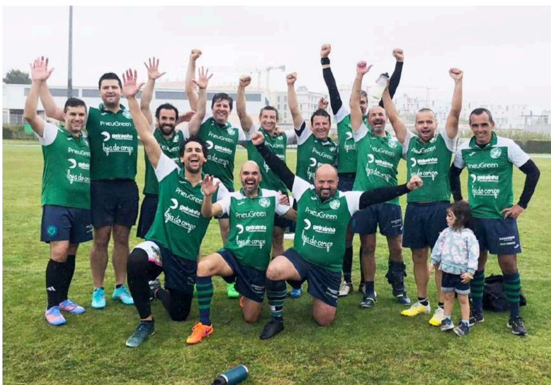
Equipa das Caldas da Rainha

Mais uma vez o Caldas RC associou-se à associação Touch Rugby Portugal para levar a cabo uma competição do calendário nacional de Touch Rugby, desta vez o Campeonato Nacional Masters, na sua terceira edição, tendo o relvado do Estádio Dr. José Luis de Melo Silveira Botelho, nas Caldas da Rainha, sido talismã para a equipa caldense, que se tornou campeã nacional.