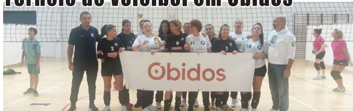
Equipa feminina da Associação Desportiva de Óbidos

Óbidos foi uma vez mais palco de um torneio de voleibol, no passado dia 4, no Pavilhão Municipal, num evento levado a cabo pela secção de voleibol da Associação Desportiva de Óbidos, que já organizou dez torneios de voleibol desde o início deste projeto a 1 de setembro de 2022.