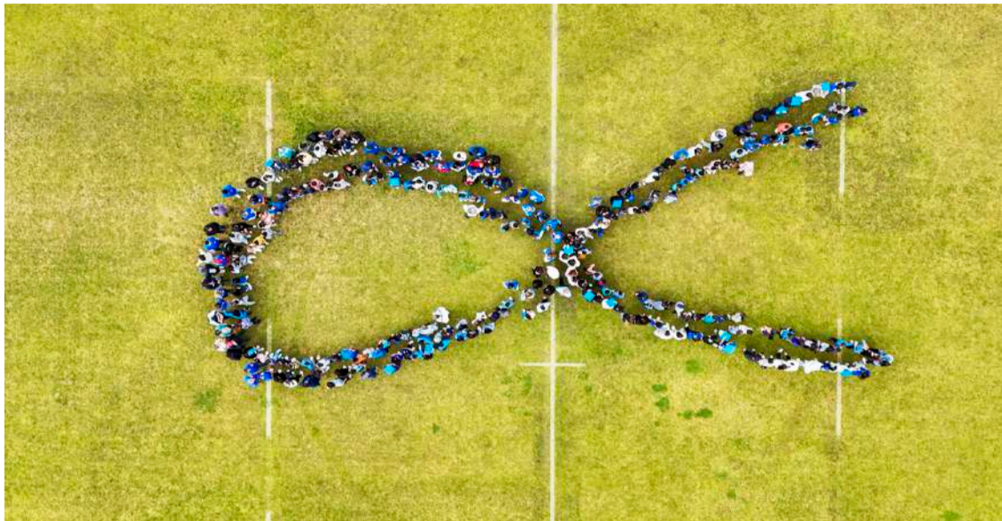
Laço Azul gigante no Campo de Rugby de Caldas da Rainha

A negligência é outro perigo sinalizado, derivado da falta de supervisão e acompanhamento familiar, que resultam maioritariamente da falta de competências parentais e a não imposição de regras às crianças e jovens.