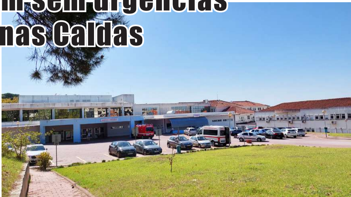
Constrangimentos mantêm-se no Hospital das Caldas

Na informação às grávidas sobre estas medidas é reiterada a importância de, antes do recurso a unidades de saúde, contactar previamente o SNS 24 (800 24 24 24). Em situações de emergência, o contacto deve ser feito diretamente para o 112. É que o Hospital de Santarém poderá