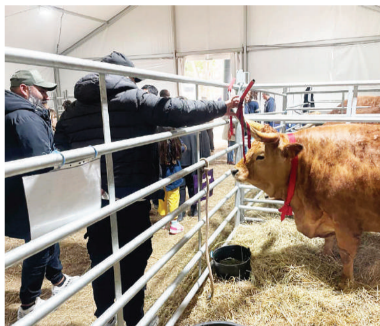
Zona agropecuária atraiu o público