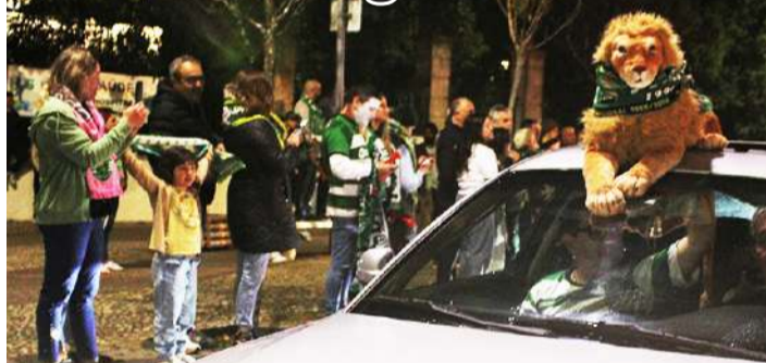
A festa nas Caldas

Uma “onda” verde e branca inundou, na noite de 5 de maio, a cidade das Caldas da Rainha, onde os adeptos sportinguistas festejaram o título de campeão nacional de futebol, beneficiando da derrota do Benfica na vi-