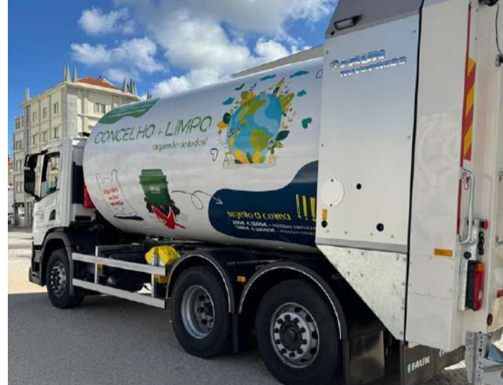
A nova viatura de recolha de lixo

Os Serviços Municipalizados de Água e Saneamento (SMAS) das Caldas da Rainha adquiriram uma nova viatura para recolha de Resíduos Sólidos Urbanos (RSU) com sistema rotopress.