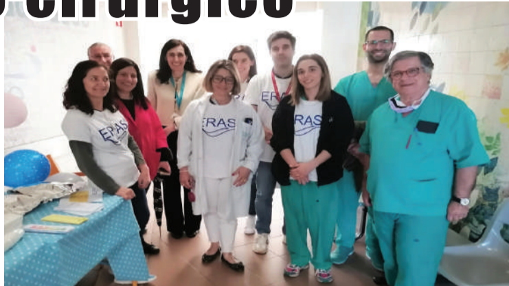
Elementos da equipa das Caldas da Rainha da ULSO

Desde a implementação do programa, em novembro de 2023, a ULSO tem apostado na formação da sua equipa multidisciplinar constituída por cirurgiões,