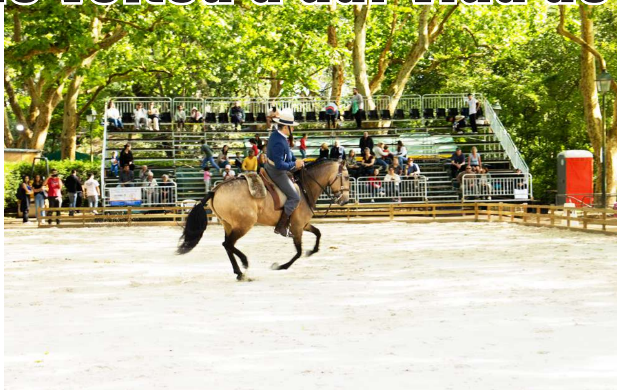
Em 2025 o Festival Oeste Lusitano vai voltar a realizar-se no primeiro fim de semana de maio

O criador tem orgulho nos seus animais e já ganhou o primeiro prémio em vários concursos. Explicou que é a raça bovina autóctone portuguesa com maior potencial produtivo. “Anti-