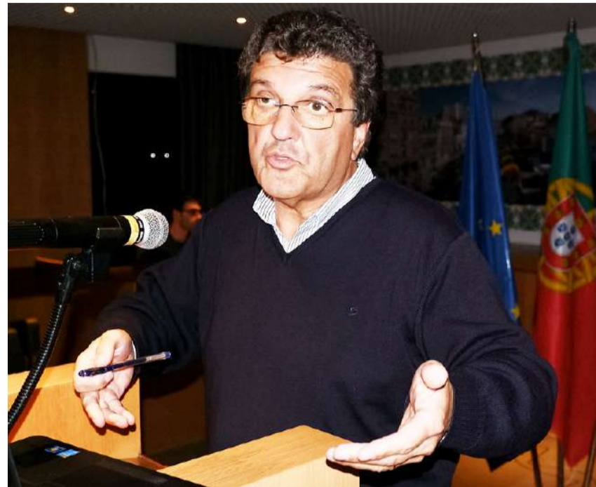
O presidente da Câmara sublinhou o aumento dos apoios às coletividades e às juntas de freguesia, o aumento das despesas com pessoal e das despesas com bens e serviços

No entanto, este campo não será suficiente para dar resposta a todas as necessidades, por isso a Câmara está a estudar outras soluções. Uma delas seria a aquisição do antigo campo no