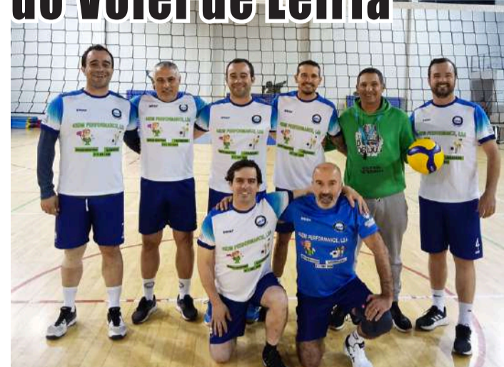
Equipa da Associação Desportiva de Óbidos

A equipa de voleibol do escalão de veteranos masculinos da Associação Desportiva de Óbidos recebeu a equipa dos Amigos do Vólei de Leiria, no Pavilhão Municipal de Óbidos, respeitante à 10ª jornada do campeonato de voleibol de veteranos masculinos, tendo perdido por 1-3 (parciais de 17-25, 22-25, 25-21 e 25-27).