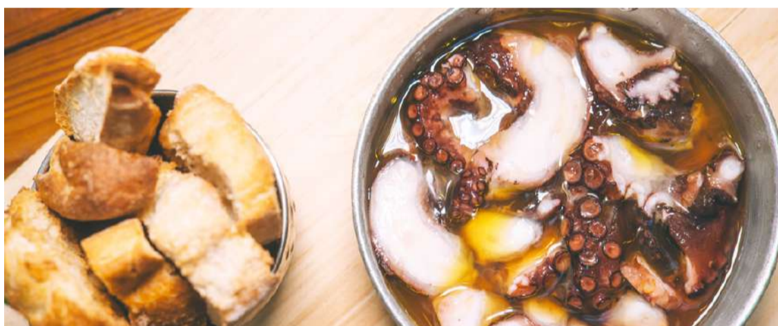
Prato do Novo Parque

Mais de duas dezenas de restaurantes participam na 15ª Quinzena Gastronómica do Polvo, na Lourinhã, entre 10 e 24 de maio. Cada espaço terá o desafio de apresentar as suas propostas únicas, destacando as diferentes e criativas formas de cozinhar este ingrediente.