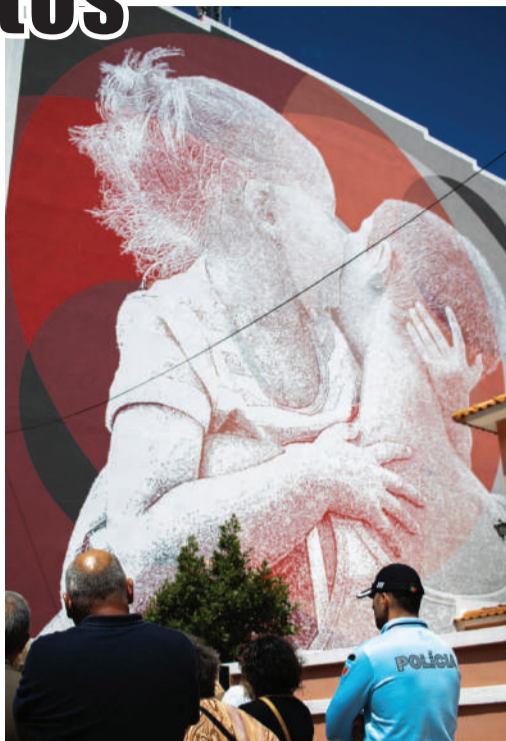
Iniciativa na fachada de um prédio localizado na entrada sul da cidade das Caldas

Atualmente são já duas dezenas as localidades aderentes ao Movimento Cidade dos Afetos. Para assinalar que Caldas da Rainha está na génese da iniciativa foi pintado este mural, cuja localização pode bem funcionar como cartaz de boas vindas a quem entra na cidade pelo