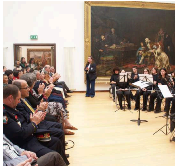
Festejos no museu

Com a atuação da Orquestra de Sopros do Conservatório de Caldas da Rainha e do Quarteto de Saxofones da Banda Comércio e Indústria, na tarde de 28 de abril foram celebrados os 90 anos de história do Museu José Malhoa, nas Caldas da Rainha.