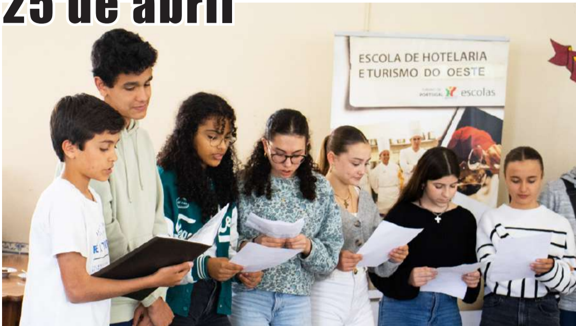
Recitação pela turma do 8º C da Raúl Proença

A Escola de Hotelaria e Turismo do Oeste (EHTO), no âmbito das comemorações dos 50 anos do 25 de abril, realizou uma atividade nas Caldas da Rainha, junto ao monumento evocativo do 16 março e na Escola de Sargentos do Exército. Esta atividade, promovida no dia 29 de abril, teve como base o trabalho dos alunos da EHTO e do Projeto GERAt, que está a desenvolver com o Agrupamento de Escolas Raúl Proença.