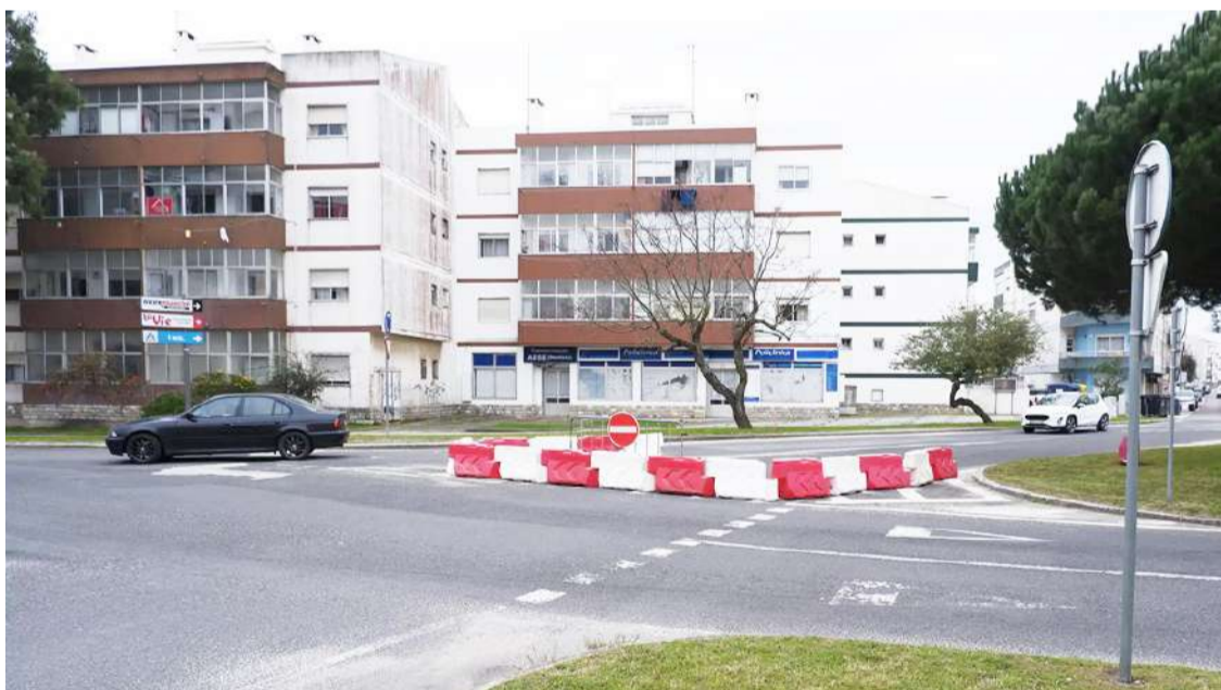
Desde o final do ano passado que foi suprimida uma das saídas da rotunda