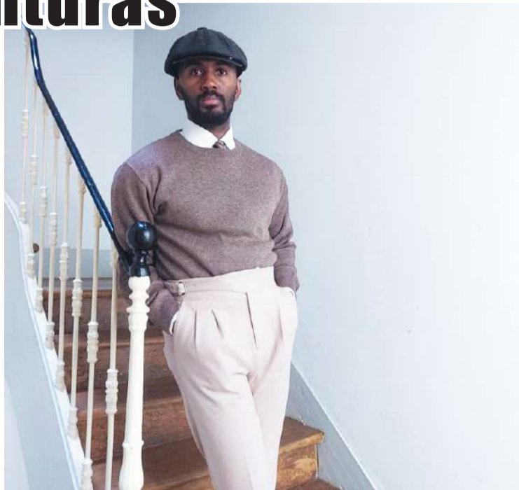
O autor é autodidata

A exposição pode ser vista até 2 de julho.