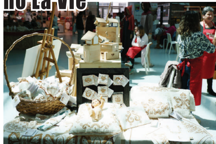
Bordados das Caldas

Durante o último fim-de-semana de abril o centro comercial La Vie das Caldas da Rainha recebeu uma mostra com produtores, artesãos e marcas da região Oeste, organizada em conjunto com o Turismo do Centro.