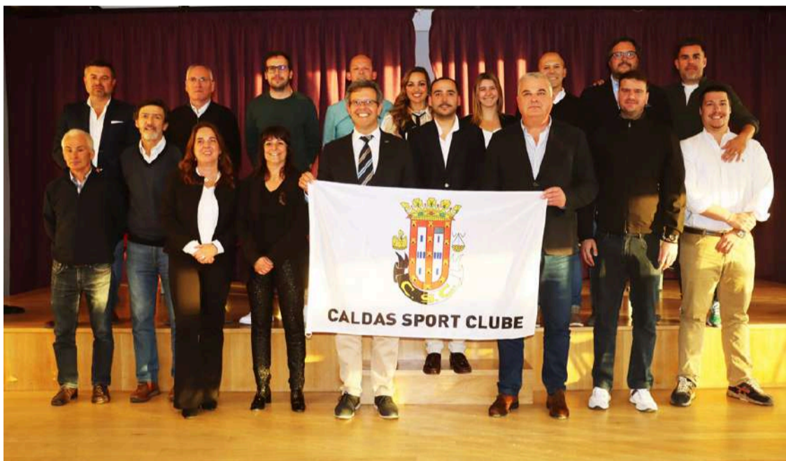
Novos órgãos sociais (foto Caldas Sport Clube – 1916)

O novo presidente lembrou que “o Caldas não tem dívidas