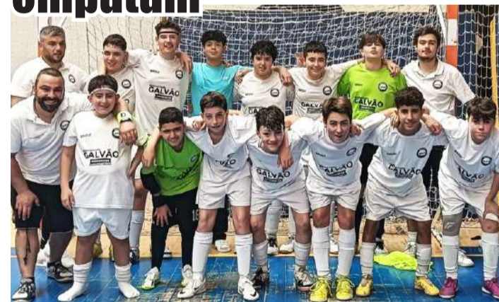
A equipa obidense

A AD Óbidos recebeu o Catarinense a contar para a última jornada do campeonato distrital de futsal no escalão de infantis, tendo empatado a quatro bolas.