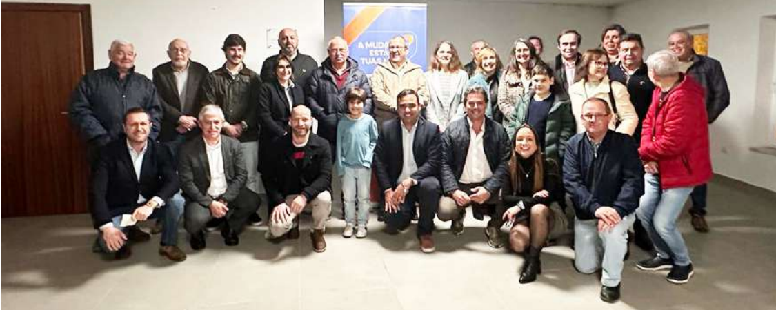
Evento no Vilar, no concelho do Cadaval

A candidatura do Oeste no Círculo Eleitoral de Lisboa da Aliança Democrática (AD) apresentou os seus mandatários no passado dia 2, no Vilar, no concelho do Cadaval.