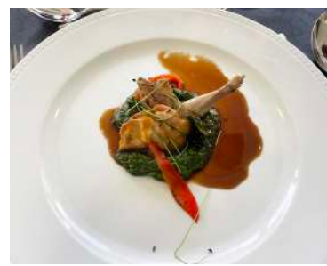
Codorniz e as Verduras - Merlot Reserva