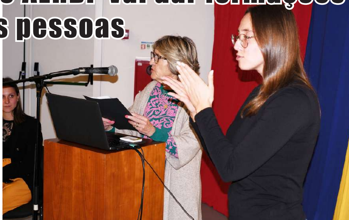
Momento de leitura em voz alta e em língua gestual