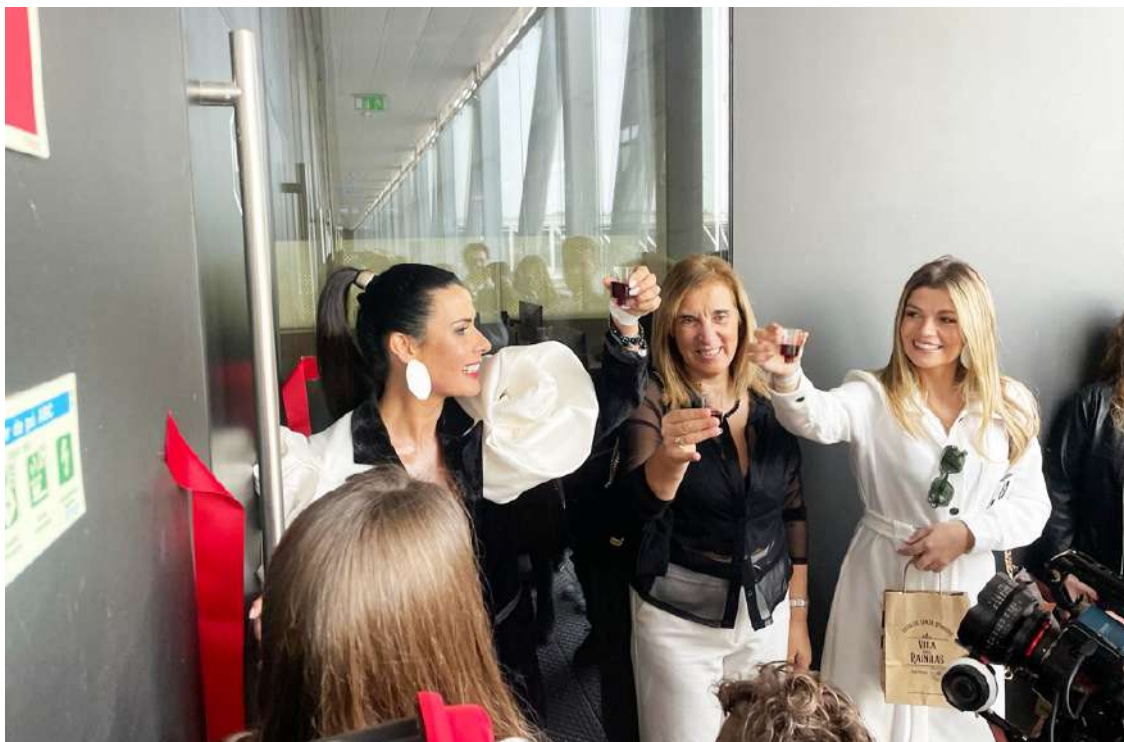
Um brinde com a Ginja Vila das Rainhas