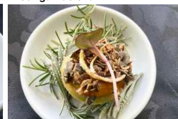
A Abóbora e a Pevide - Fernão Pirão Branco