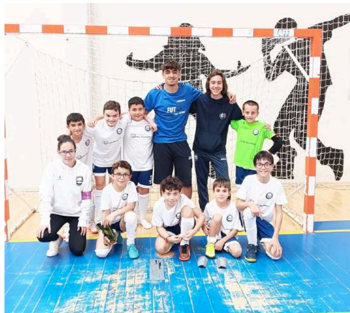
Equipa da Associação Desportiva de Óbidos

Os benjamins do futsal da Associação Desportiva de Óbidos jogaram no passado sábado no Pavilhão Municipal de Óbidos, contra a equipa CCRD Burinhosa, registando um empate a duas bolas.