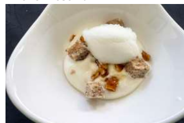
O Eucalipto e o Mel - Fernão Pirão Branco