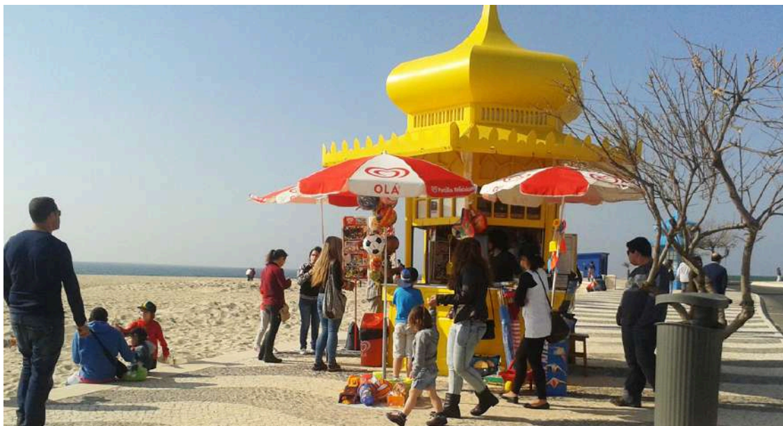
A autarquia vai realizar uma nova hasta pública para atribuir o direito de ocupação a um dos quiosques