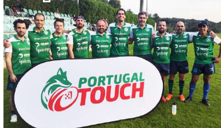
Equipa das Caldas da Rainha

Numa organização da Associação Touch Rugby Portugal, disputou-se no passado domingo o Campeonato Nacional Open All Silver, na Tapada da Ajuda, casa do Agronomia Rugby, tendo o Caldas Rugby Clube Touch repetido o triunfo do ano passado.