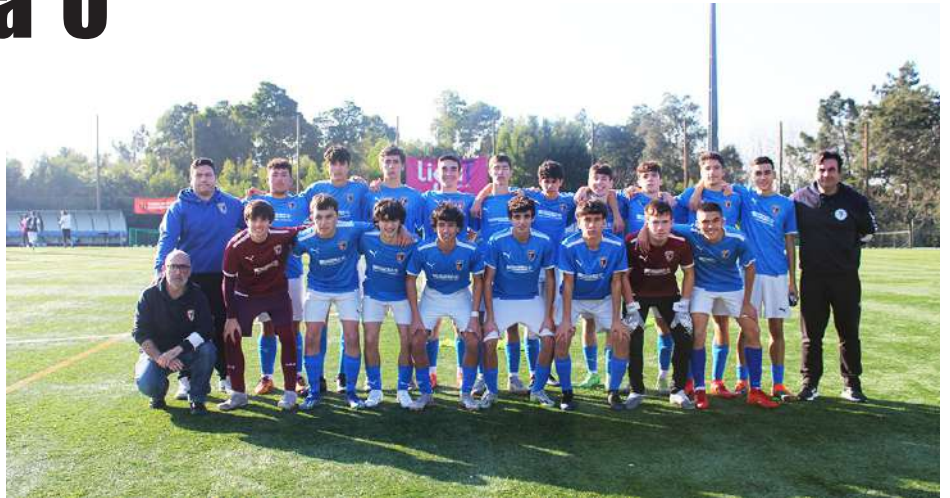
Equipa do Ginásio de Alcobaça