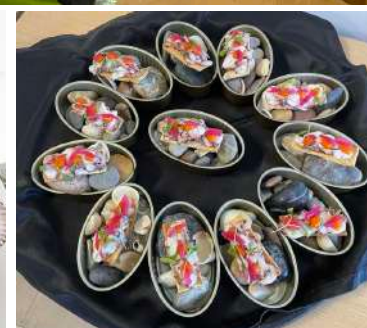
Polvo e os Pimentos - Alvarinho Branco