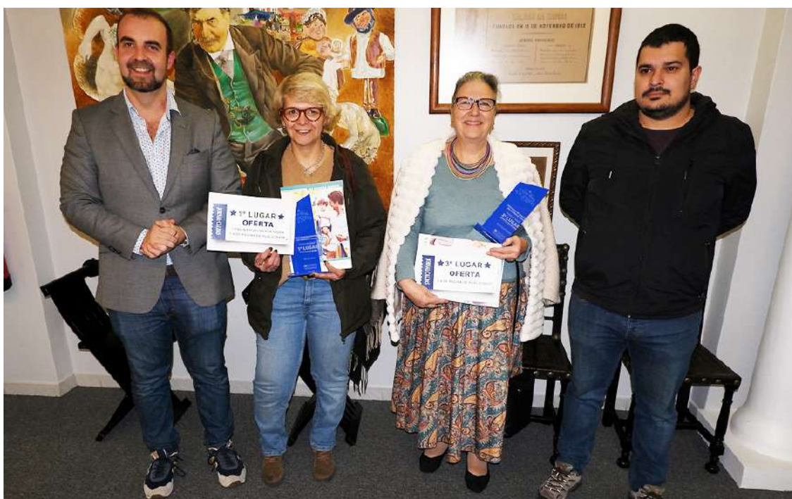
Entrega dos prémios do concurso de Montras de Natal

das Caldas e a isenção do pagamento de quotas de associado da ACCCRO no período de seis meses.