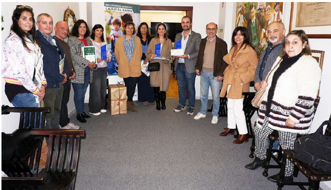
Entrega dos prémios do concurso de Anjos de Natal das Escolas