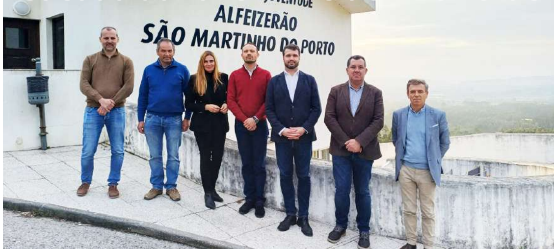
A Pousada da Juventude de Alfeizerão é uma das mais antigas do país

No âmbito da iniciativa "ANDA (Conhecer Portugal)", o Secretário de Estado da Juventude e do Desporto, João Paulo Correia, visitou a 5 de fevereiro a Pousada da Juventude de Alfeizerão e pôde testemunhar as suas boas condições de manutenção e gestão.