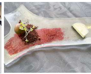
Os Vermelhos e o Queijo - Touriga Nacional