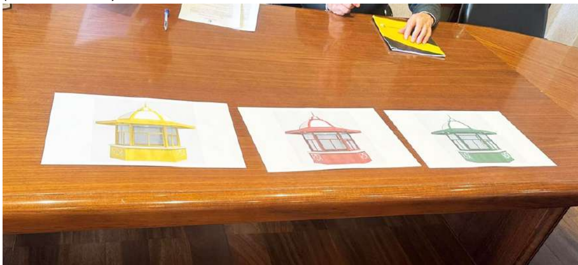
Os novos quiosques