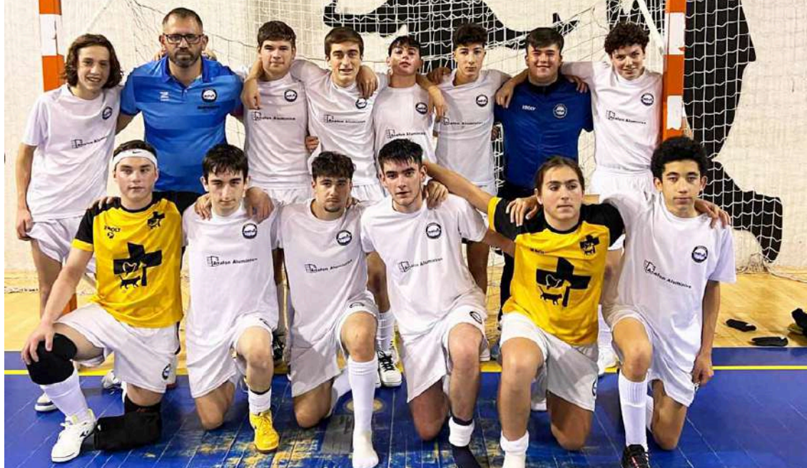
Equipa da Associação Desportiva de Óbidos

A Associação Desportiva de Óbidos (ADO) venceu por 3-2 a equipa da Quinta do Sobrado, em jogo disputado no passado sábado referente à jornada 10 do campeonato juniores B, da 1ª divisão de futsal da Associação de Futebol de Leiria.