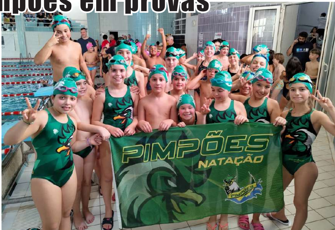
Cadetes dos Pimpões