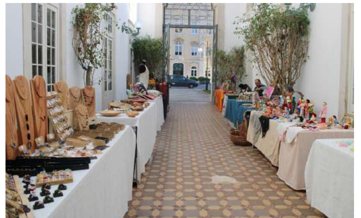
Várias bancas com trabalhos de artesanato

O Céu de Vidro, no Parque D. Carlos I, nas Caldas da Rainha, recebeu no passado fim de semana um mercado de artesanato.