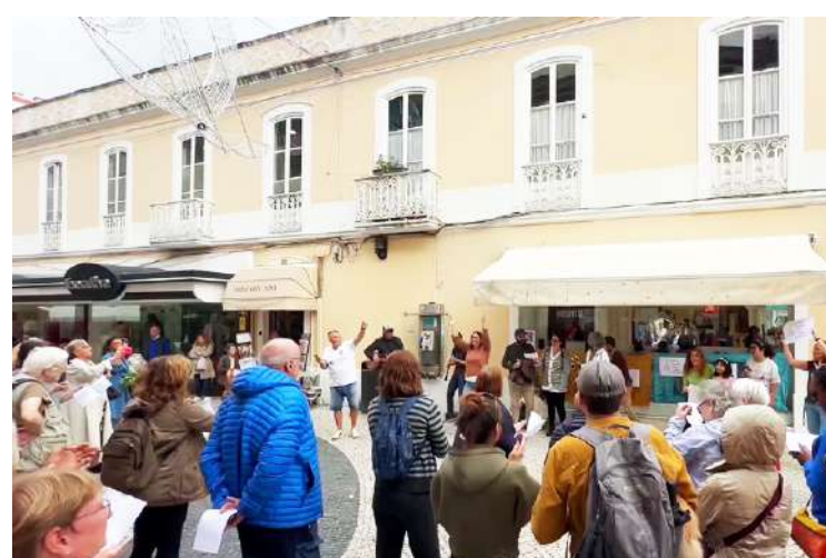
A participação no World Singing Day é uma das iniciativas a repetir este ano

tam-se um workshop de defesa pessoal, aulas de dança e recolha de ovos de chocolate para