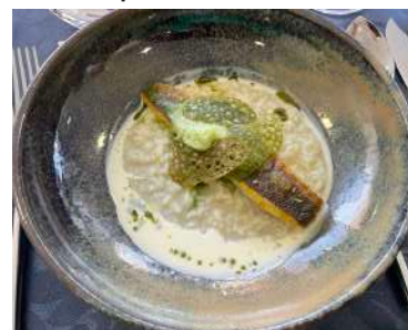
O Robalo e o Mar - Reserva Branco de 2020