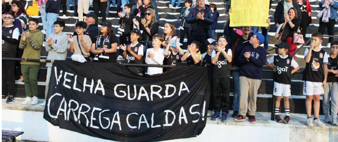
Jogos regressam a 18 de fevereiro

Decorreram na passada quarta-feira os sorteios para as fases de subida e manutenção da Liga 3. O arranque está marcado para