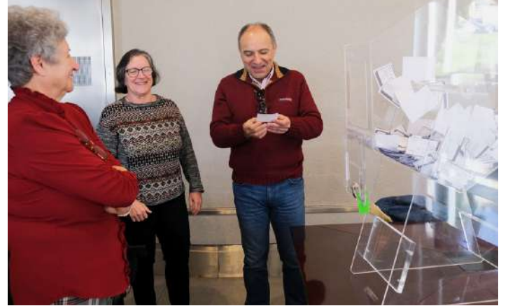
Sorteio de 30 prémios no total de 2250,00€

Realizou-se na passada quarta-feira, no auditório dos Paços do Concelho do Cadaval, o sorteio dos 30 prémios do concurso "Natal é no Cadaval", uma iniciativa anual do Município, dinamizado em parceria com os 25 estabelecimentos aderentes, que decorreu entre 1 de dezembro e 6 de janeiro, tendo agregado os antigos concursos "Natal é no Comércio Tradicional" e "Natal à Mesa".