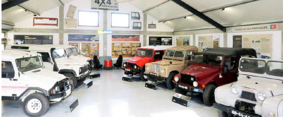
Alguns dos modelos expostos