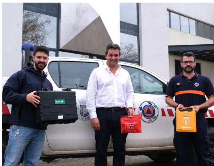
Programa de desfibrilhação encontra-se em fase de implementação no Cadaval

Entre outros locais, o programa já permitiu a instalação de DAE no Gimnodesportivo, Piscina Municipal e Mata dos Castanheiros (Serra de Montejunto), para além de um dispositivo móvel para o acompanhamento de