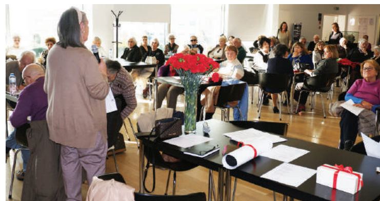
O café-concerto do CCC esgotou a sua capacidade

O núcleo vai igualmente organizar uma exposição documental e fotográfica para comemorar os 50 anos da revolução, que irá estar patente na sala de exposição do Turismo das Caldas de 6 de abril a 4 de maio.