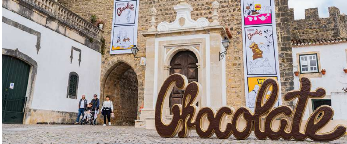
Óbidos vai acolher mais uma edição do Festival Internacional de Chocolate

De 1 a 17 de março, de sexta-feira a domingo, Óbidos acolhe mais uma edição do Festival Internacional de Chocolate, inspirada no património material e imaterial classificado pela Unesco em Portugal.