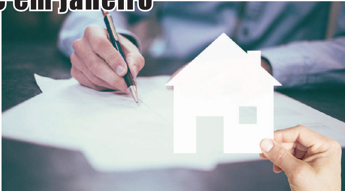
O portal imobiliário Imovirtual divulgou o seu barómetro relativo à evolução dos preços médios

O concelho de Figueiró de Vinhos destaca-se como o mais barato para comprar casa, em ja-