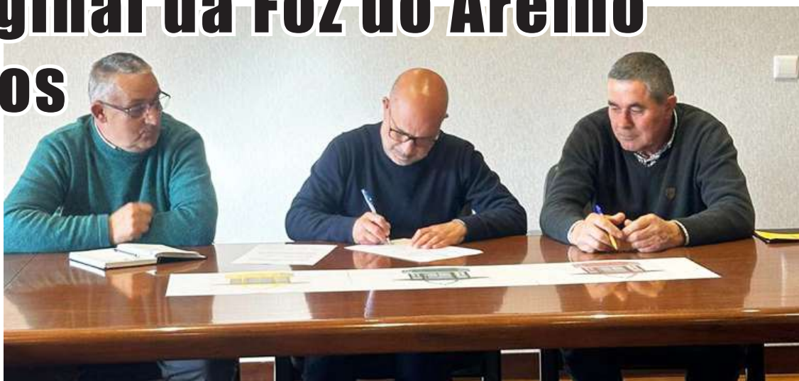
Cerimónia de assinatura do contrato da empreitada para a colocação dos novos quiosques

“A Foz do Arelho é uma das melhores praias do mundo e está na altura de a Câmara Municipal dar mais vida à localidade”, ma-