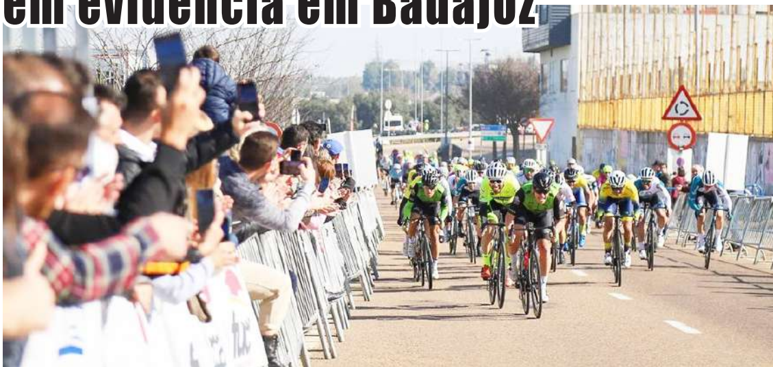
Chegada ao sprint