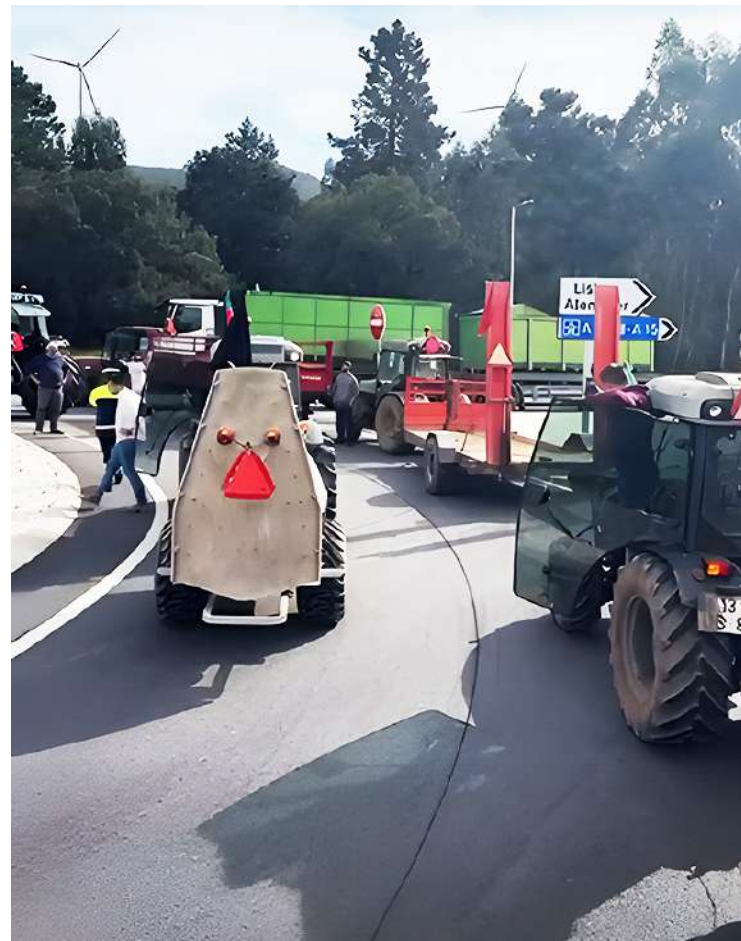
Numa das rotundas do IC2

"O atual cenário geopolítico mundial – guerras, catástrofes naturais, alterações climáticas – é preocupante e consideramos imprescindível capacitar o setor