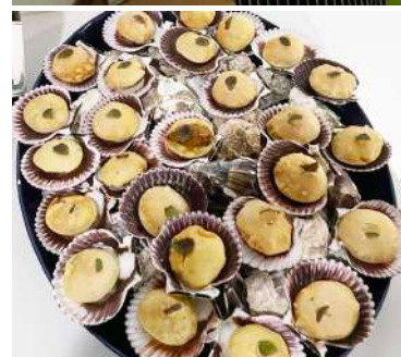
Caranguejo e o Milho - Nana Espumante Rosé