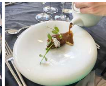
Cogumelos e as Algas - Pinot Noir Reserva