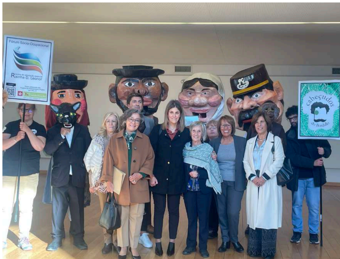
Utentes do Centro de Educação Especial Rainha D. Leonor receberam a secretária de Estado da Inclusão

No segundo dia de trabalhos, a mesa redonda "Transformar Desafios em Soluções ao serviço da Inclusão" foi dedicada a temas como as novas respostas sociais, o combate à pobreza, a garantia para a infância, o envelhecimento e os cuidados continuados, e ainda a inovação social.