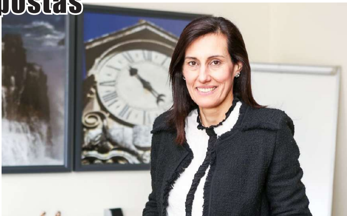
A administradora do CHO diz que é uma emergência a construção do novo Hospital do Oeste

A administradora garantiu que “não há intenção alguma de