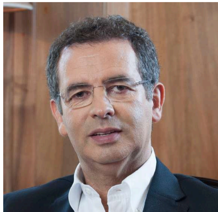
O antigo secretário-geral dos socialistas reside nas Caldas da Rainha

Na sua juventude foi líder da JS, sendo depois presidente do Conselho Nacional de Juventude, presidente do Fórum da Juventude da União Europeia e vice-presidente da União Internacional das Juventudes Socialistas.