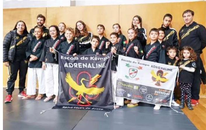
Secção de Kempo da coletividade do Bairro Senhora da Luz

A Escola de Kempo Adrenaline, do Sport Clube do Bairro, em Óbidos, marcou presença na Taça de Portugal da Federação Portuguesa Lohan Tao Kempo, que decorreu em Portalegre no passado fim-de-semana, conquistando 35 medalhas, sendo cinco de ouro, treze de prata e dezassete de bronze.