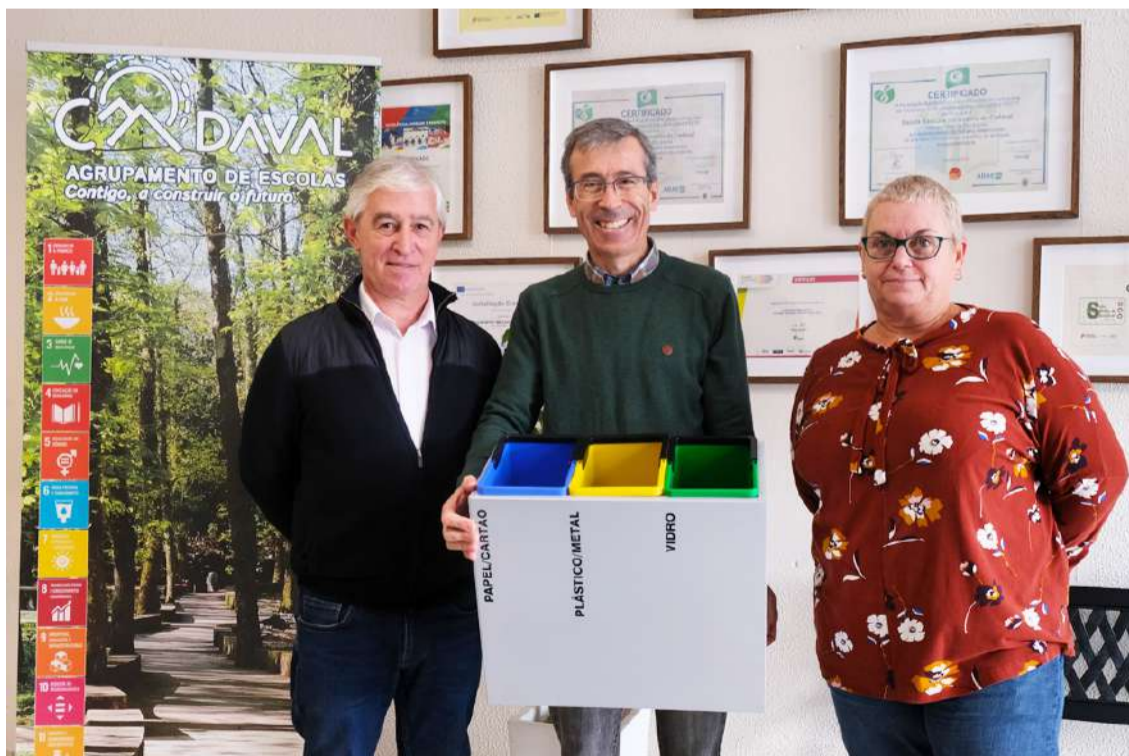
Município do Cadaval entregou primeiros mini-ecopontos ao Agrupamento de Escolas

O Município do Cadaval procedeu à distribuição dos primeiros mini-ecopontos ao Agrupamento de Escolas do Cadaval (AEC), que irão estar presentes nas várias salas de aula dos estabelecimentos de ensino do concelho.