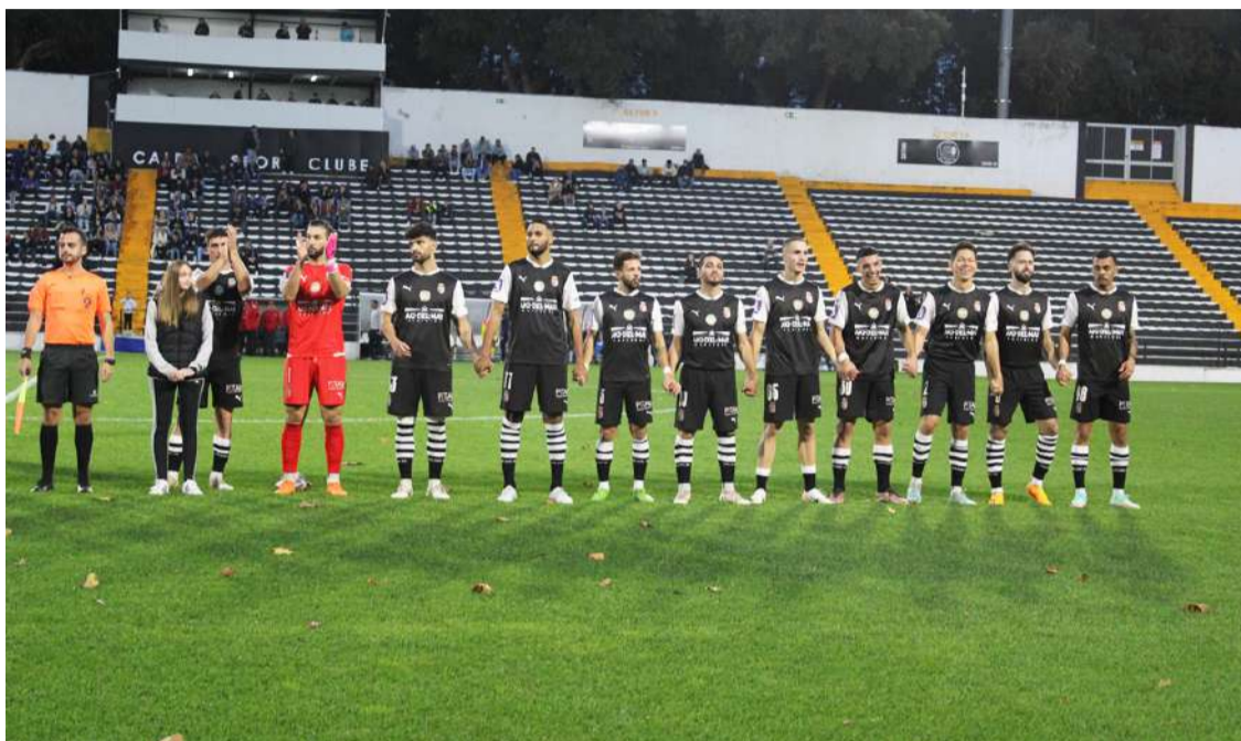
Caldas Sport Clube