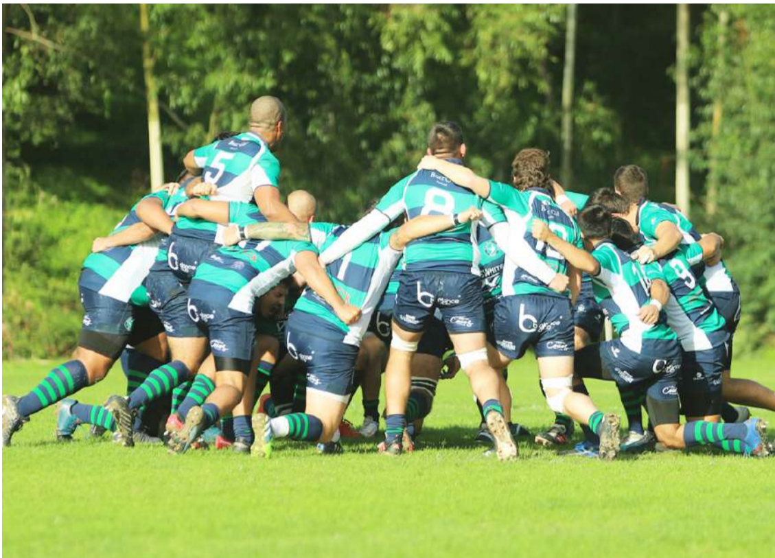
A equipa caldense não teve hipótese de contrariar o resultado