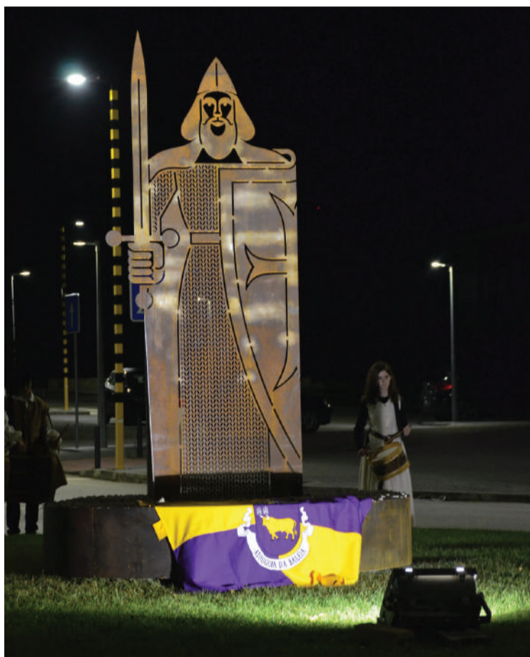
Escultura em aço corten, com desenho da autoria de Carlos Eduardo Vala

No dia 17, às 18h00, na Escola Básica 2-3, acontecerá a inauguração da exposição D. Guilherme de Corni, o fundador, com os trabalhos dos alunos do Agrupamento de Escolas de