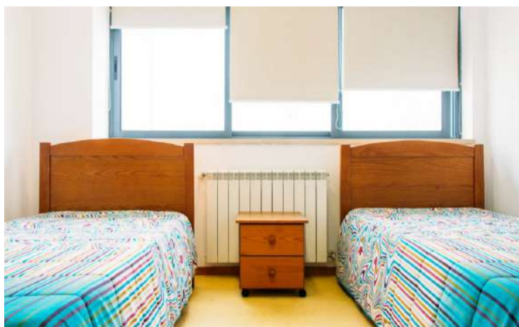
A residência feminina vai encerrar para obras em fevereiro de 2024

Contudo, a falta de informação sobre este processo está a deixar preocupados os residentes. O JORNAL DAS CALDAS sabe que os alunos da ESAD.CR estão a ponderar realizar uma manifestação de protesto. "A única informação que temos é que podemos permanecer na residência até à data de início das