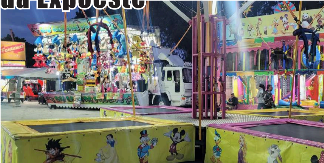
Family Park Caldas

De 11 a 26 de novembro o Family Park Caldas está presente no parque de estacionamento da Expoeste, funcionando de domingo a quinta-feira das 15h00