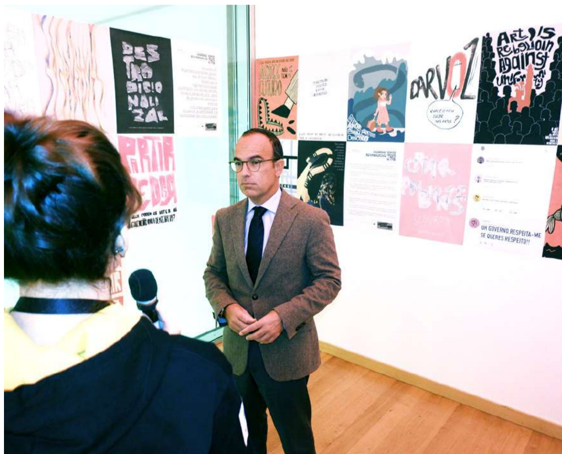
Ministro da Cultura, Pedro Adão e Silva, a ser entrevistado por alunos do Politécnico de Leiria

Na próxima edição do JORNAL DAS CALDAS será publicada uma reportagem alargada sobre o evento.