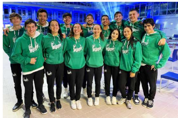
Escalão de absolutos