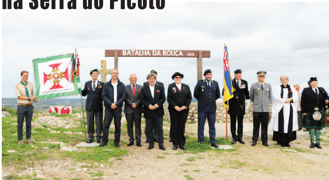
As comemorações foram promovidas pela Royal British Legion

A Serra do Picoto, no Bombarral, foi palco, a 11 de novembro, das celebrações do Dia do Armistício, promovidas pela Royal British Legion.