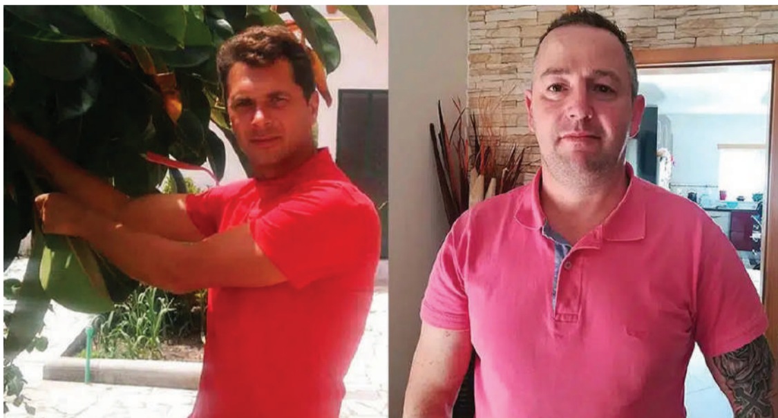
O suspeito do homicídio e a vítima

Já na madrugada do dia 28, transportou no seu veículo os vários sacos, atirou-os para diferentes locais isolados em espaços florestais nas redondezas e inclusive numa habitação em ruínas na própria aldeia onde morava, assim como escondeu num terreno parte do colchão manchado de sangue onde a vítima