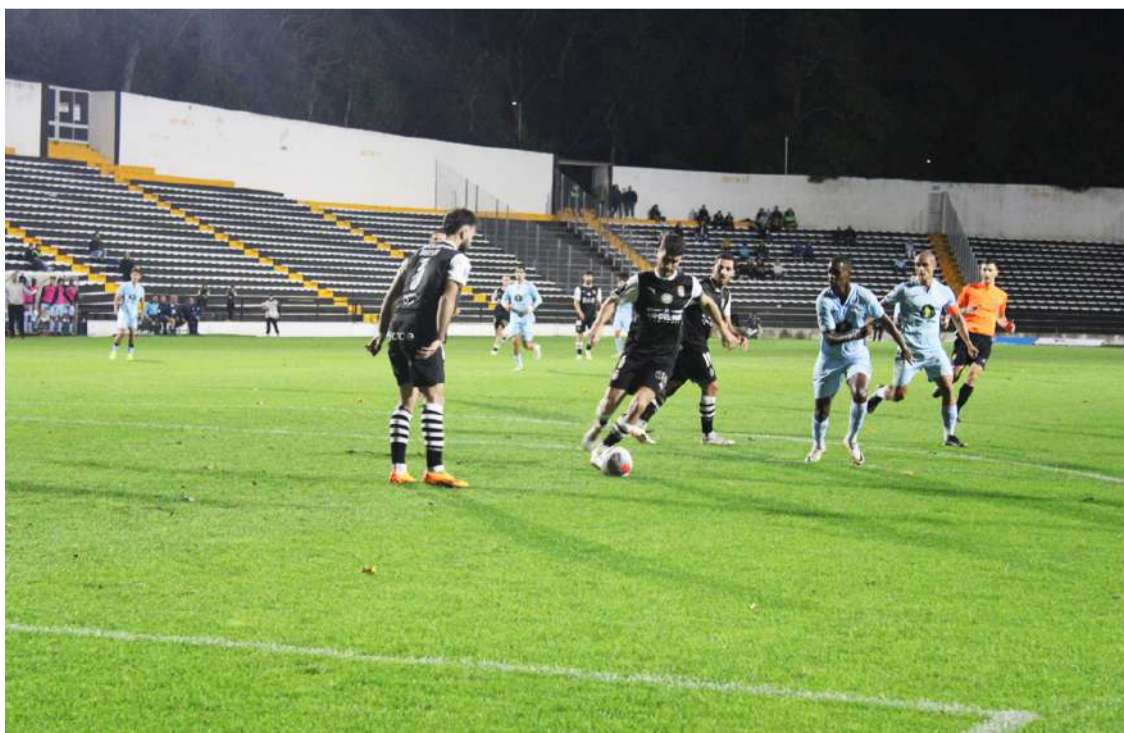
Os caldenses arrecadaram três pontos