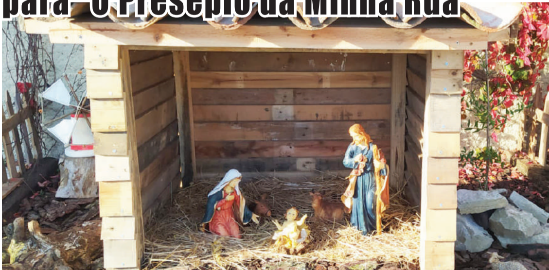
Presépio de uma edição anterior da iniciativa

Estão a decorrer as inscrições para "O Presépio da Minha Rua", uma iniciativa promovida pelo município de Peniche.