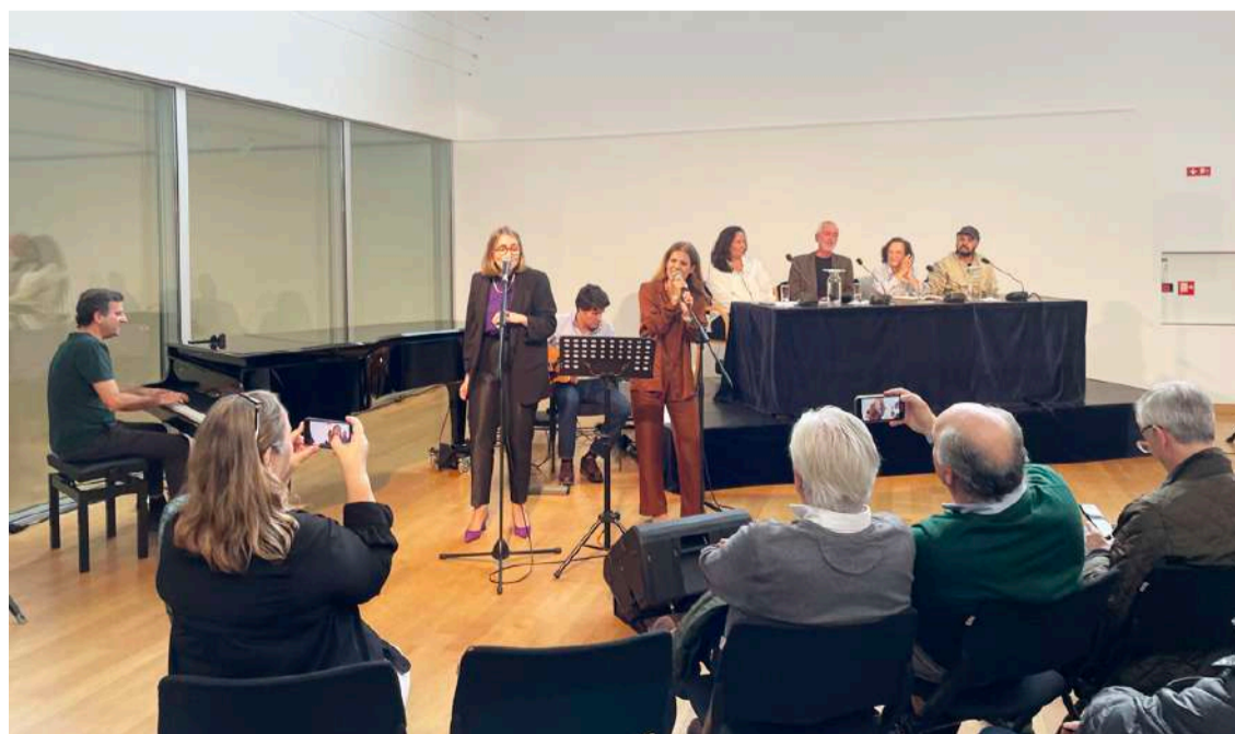
Momento musical com a banda “Audiência Prévia”, composta por juízes

Comparou a criação de uma capa de um livro com um “arrot”, ou seja, “tem que chamar a atenção”. Disse que representa um casal “sentado no sofá lado a