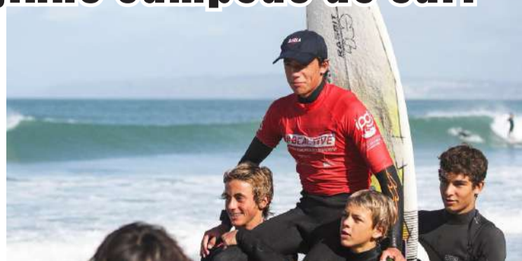
O novo campeão nacional de surf sub 16

O novo campeão nacional, ainda sub 14, levou a melhor na