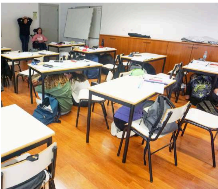
Em Óbidos o simulacro foi efetuado junto da comunidade escolar

Vários concelhos da região participaram, na manhã de 14 de novembro às 11h14, no simulacro “A Terra Treme”, promovido pela Autoridade Nacional de Emergência e Proteção Civil (ANEPC).