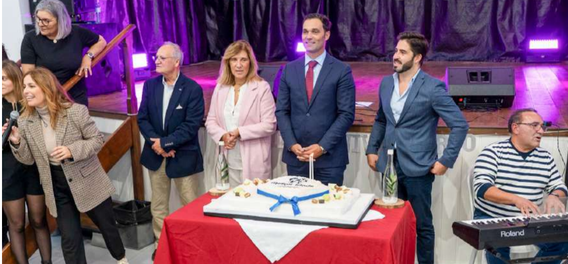
Festa no Centro Social Cultural e Recreativo da Amoreira

O programa municipal Melhor Idade celebrou o seu 18º aniversário, no dia 2 de novembro, com uma tarde de convívio no salão do Centro Social Cultural e Recreativo da Amoreira.