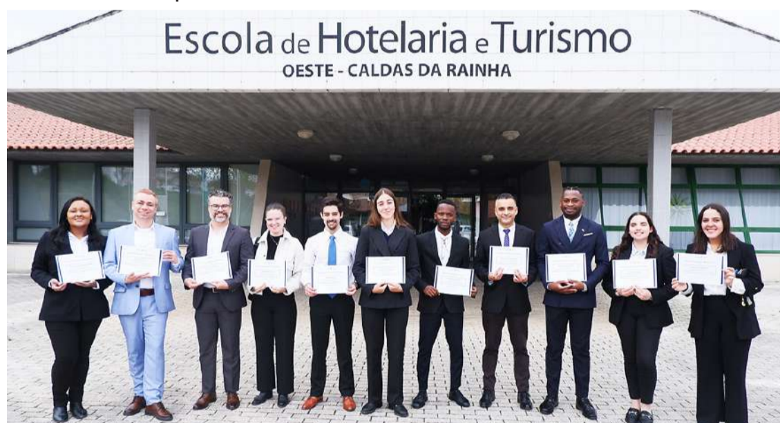
Os 11 alunos foram distinguidos no Quadro de Mérito da EHTO

que tem resultado na realização de vários projetos.