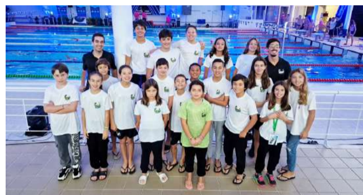
Equipa de infantis e cadetes

Os Pimpões foram a equipa com maior representação, com 14 atletas, no II Torneio Fundação Clube Náutico de Leiria para o escalão de absolutos, que decorreu nos dias 4 e 5 de novembro na Piscina Municipal de Leiria, onde estiveram 13 clubes e 137 nadadores.