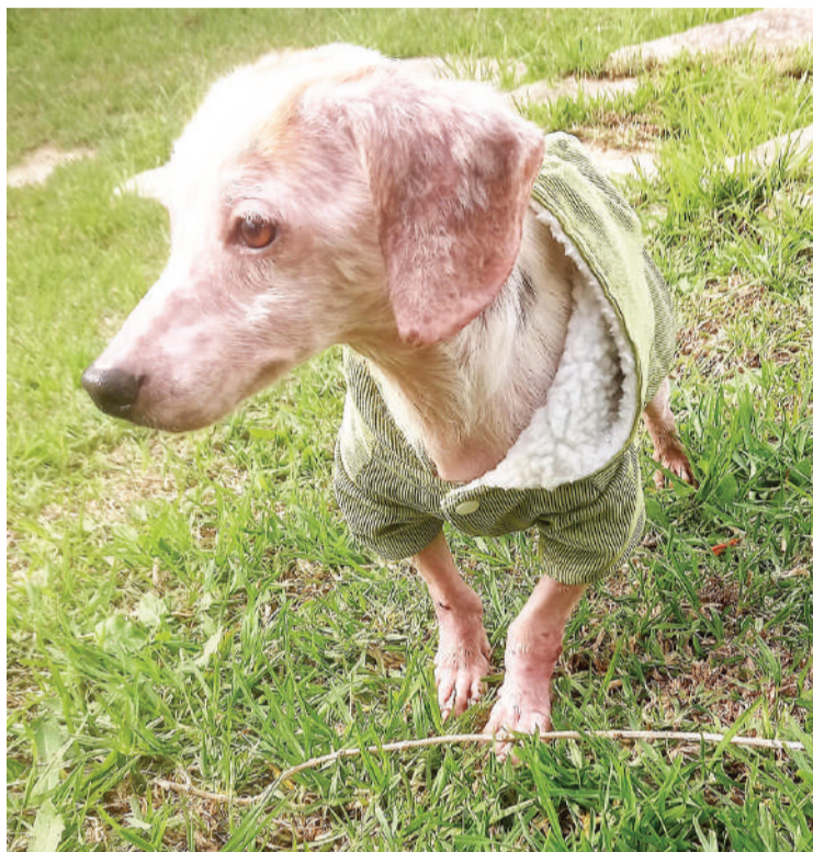
“Sushi” recuperou do estado debilitado em que foi encontrado

Passados alguns dias, depois de ter sido internado e sujeito a várias ações para recuperar o seu estado de saúde, acabou