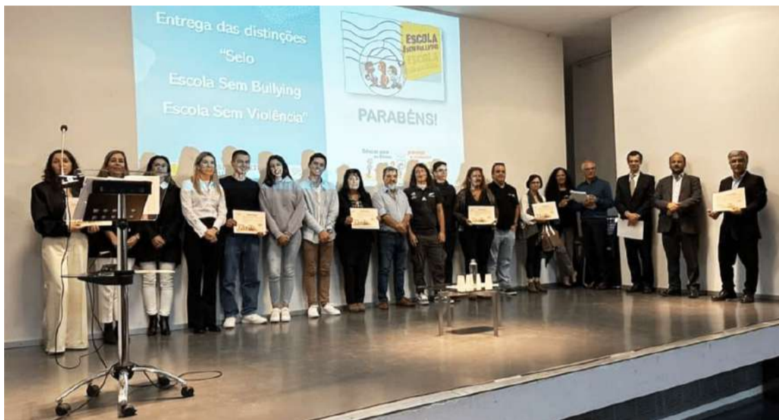
Entrega do “Selo Escola Sem Bullying | Escola Sem Violência”

Foram atribuídos ao Agrupamento de Escolas do Cadaval (AEC) o “Selo Escola Saudável 2023/2025” e o “Selo Escola Sem Bullying | Escola Sem Violência”.