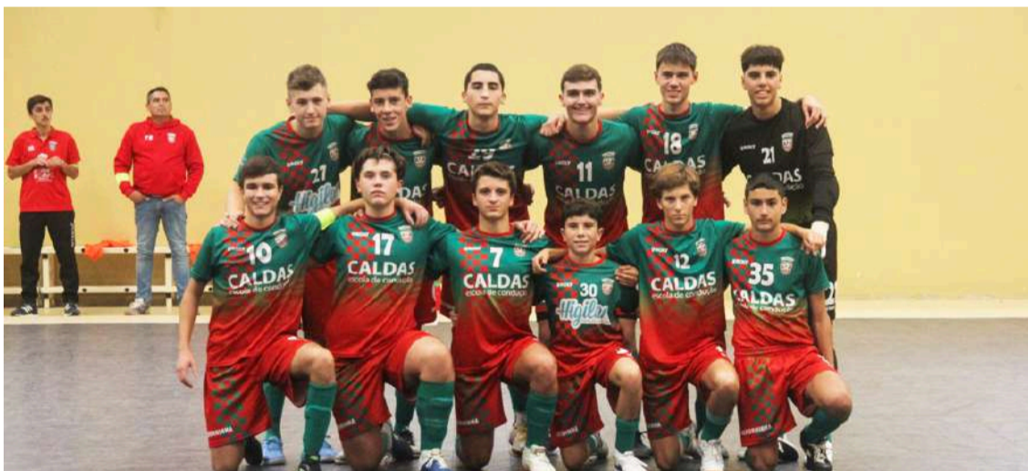
Equipa de futsal da Associação Desportiva de Alvorninha

Os juvenis da Associação Desportiva de Alvorninha receberam a equipa da Burinhosa, em jogo da 5ª jornada do campeonato da divisão de honra de futsal, com incerteza no resultado até ao fim.