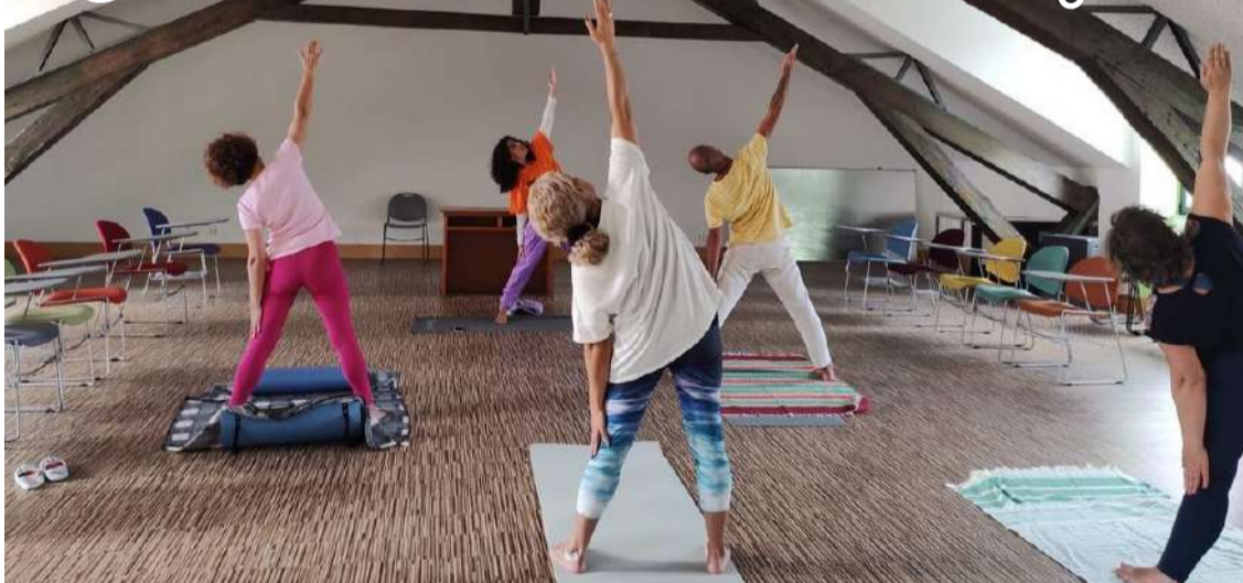
As aulas decorrem às quartas e sextas-feiras às 18h00

Inicialmente aberto em 2011 na Rua das Montras, por cima do Café Venezia, o Centro do Yoga de Caldas, com aulas de yoga tradicional da Índia para todas as idades, mudou de instalações,