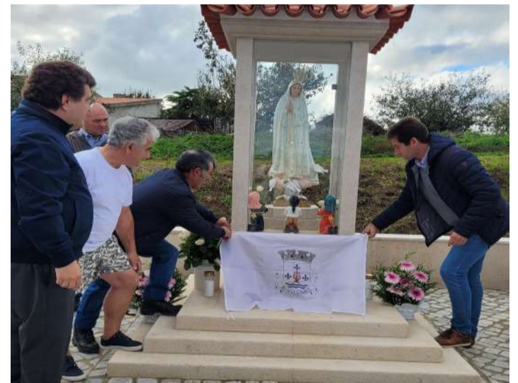
Inauguração em Broeiras, na freguesia de A-dos-Francos

A Junta de Freguesia de A-dos-Francos, no concelho das Caldas da Rainha, inaugurou no passado dia 12 um altar de homenagem a Nossa Senhora de Fátima, na localidade de Broeiras.