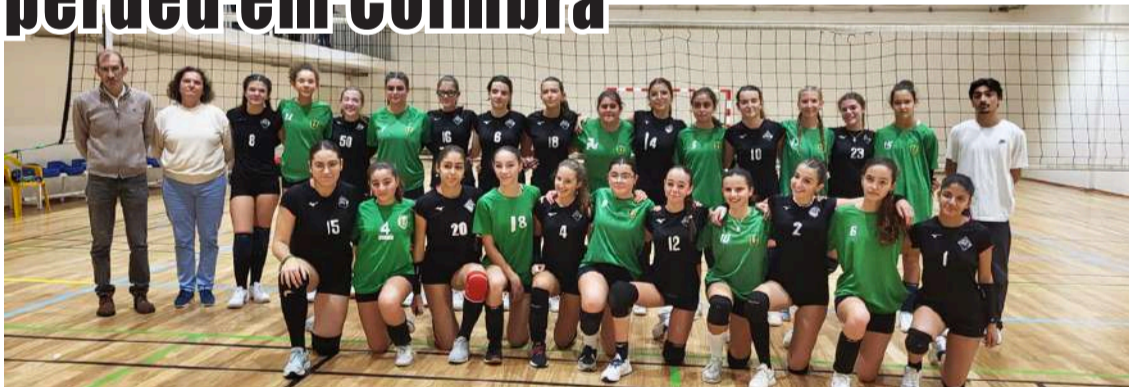
As equipas das Caldas da Rainha e de Coimbra

A equipa de voleibol de iniciação feminina do Sporting Clube das Caldas (SCC) deslocou-se a Coimbra para realizar a 3ª jornada da 1ª Fase do Campeonato Nacional.