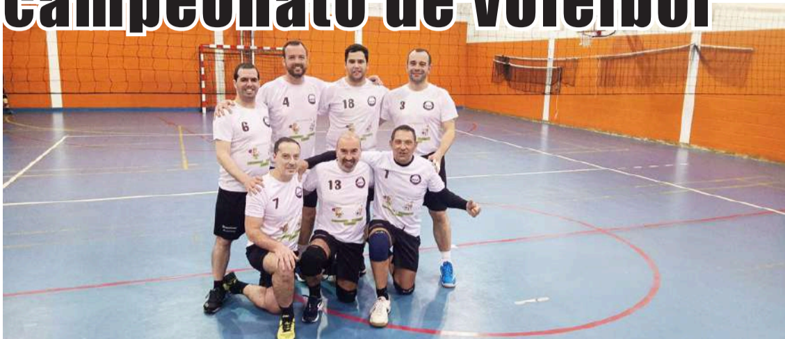
Equipa de voleibol de veteranos masculinos da Associação Desportiva de Óbidos

As boas relações e laços de amizade entre os responsáveis das equipas de voleibol de veteranos masculinos da Associação Desportiva de Óbidos e do Sporting Clube das Caldas, permitiu a realização de três jogos treino nas últimas semanas, preparando o campeonato que se avizinha.