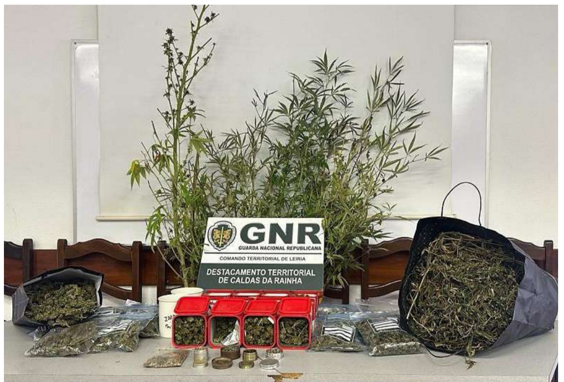
O estupefaciente foi apreendido assim como outro material

Um homem de 57 anos foi constituído arguido por cultivo e posse de produto estupefaciente, na freguesia de Alvorninha, no concelho das Caldas da Rainha.