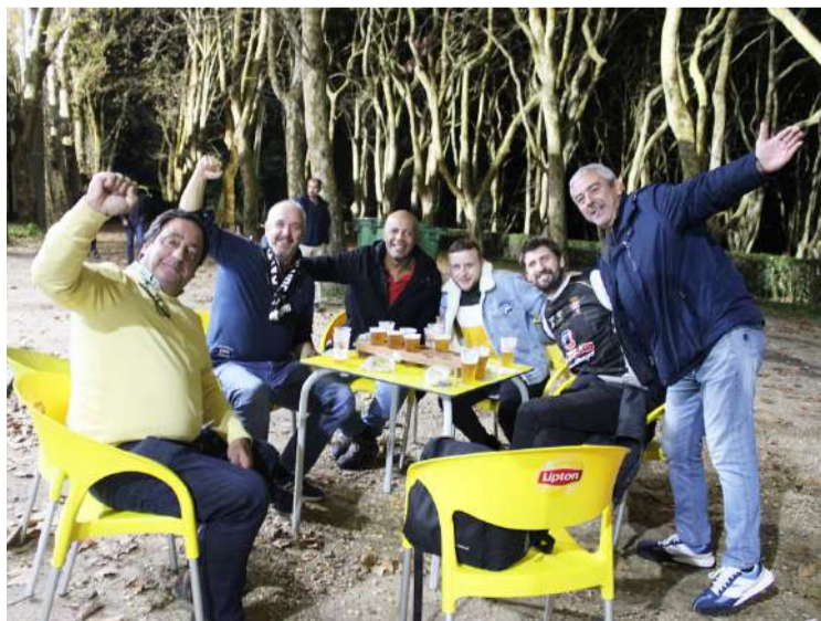
Adeptos caldenses em festa