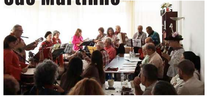
Convívio no Bairro Azul

A Associação Amigos e Mordedores do Bairro Azul festejou o São Martinho no passado dia 4, num convívio que incluiu castanhas assadas, água-pé,