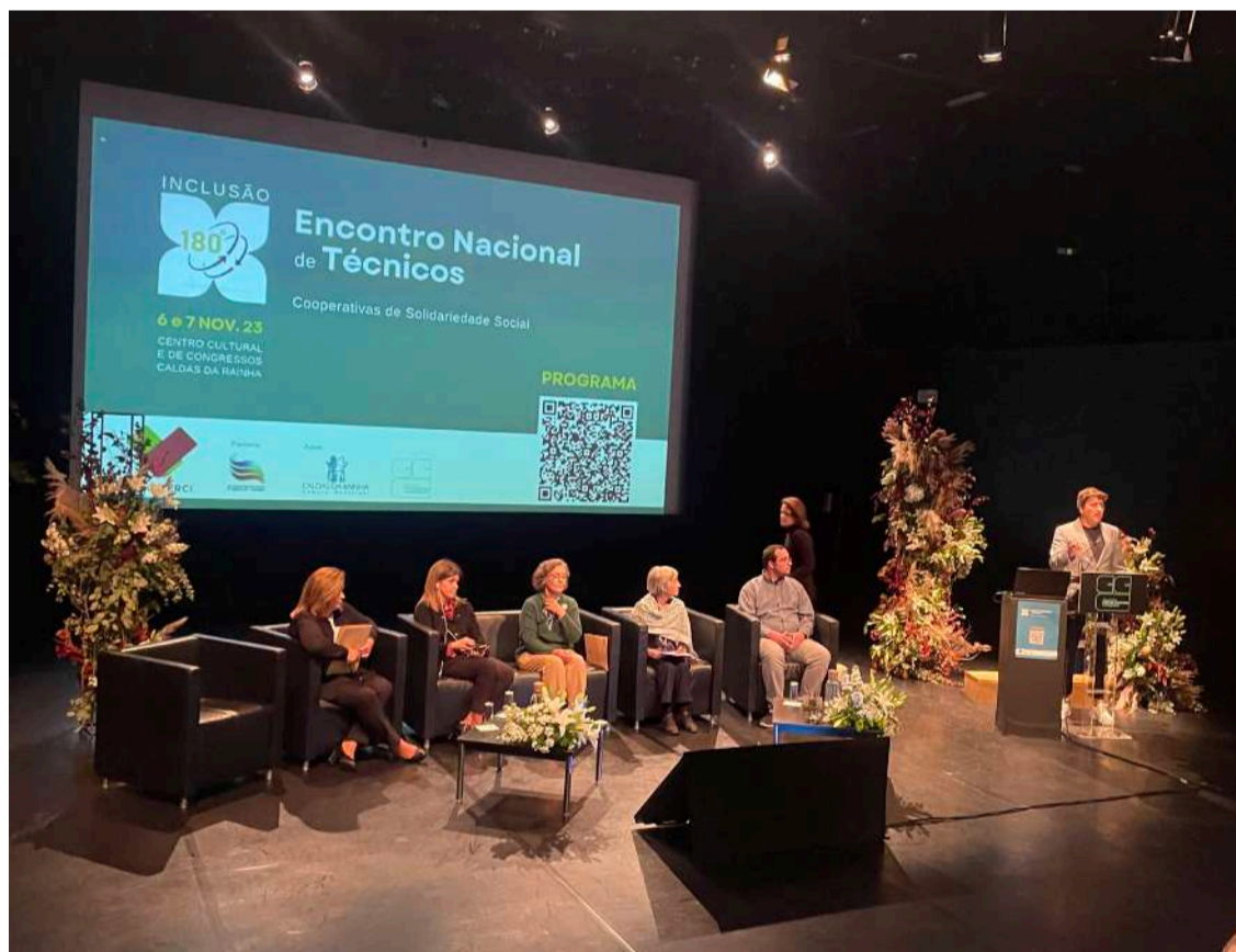
Sessão de abertura do Encontro Nacional de Técnicos das Cooperativas de Solidariedade Social

"Este encontro tem um plano mais importante que os impactos externos, uma vez que temos um