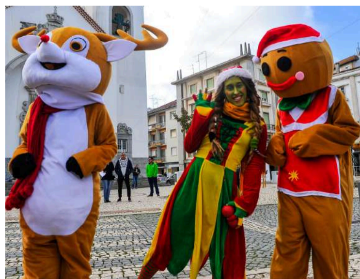
Animação natalícia vai levar a condicionamentos no trânsito e estacionamento

Durante o mês de dezembro, o período gratuito nos parques de estacionamento subterrâneo passa dos habituais 60 para 120 minutos.