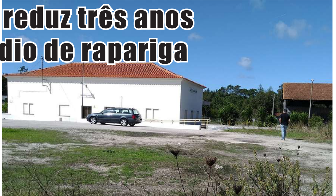
Local onde o crime aconteceu, junto à estação da Martingança-Gare