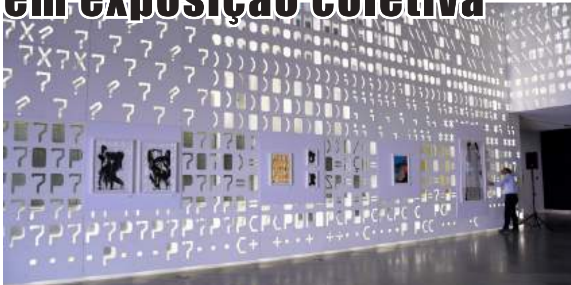
Exposição no Pavilhão do Conhecimento – Centro Ciência Viva

“Cintilações e Reflexos – Água” é o mote da exposição coletiva de desenho e vídeo promovida pelo Politécnico de Leiria, patente no Pavilhão do Conhecimento – Centro Ciência Viva, em Lisboa, que dá a conhecer diversas obras que abordam as expressões da água – queda, movimento, ondulação, depósito, serenidade, degelo, profundidade, reflexo, entre outros –, estando patente até ao dia 11 de setembro.