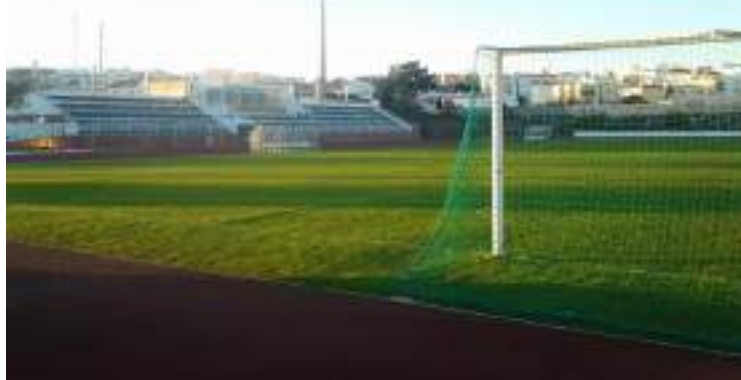
Alguns dos 17 jogadores envolvidos ficaram alojados no Estádio Municipal

O MP adianta que o presidente e os dois agentes providenciaram “pela elaboração de contratos de trabalho e de promessas de contratos de trabalho”, para dar aparência de legalidade, documentos necessários para instruir