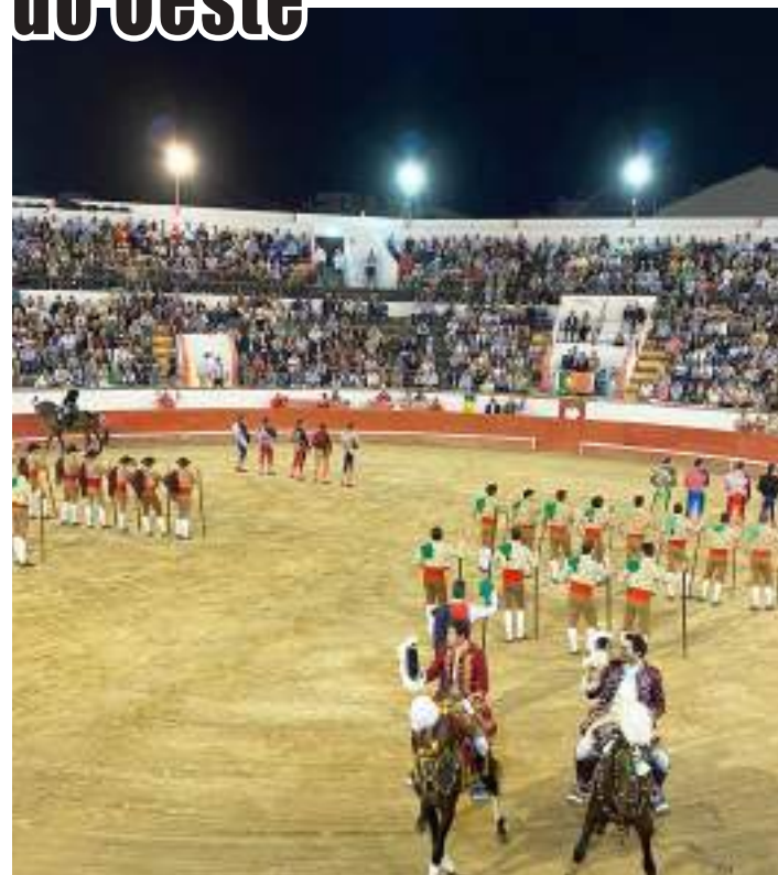
Início da temporada na Praça de Touros das Caldas da Rainha

A Praça de Touros das Caldas da Rainha inaugurou a temporada com um concurso de ganadarias, na noite do passado sábado, com a 1ª Grande Corrida dos Fruticultores do Oeste.