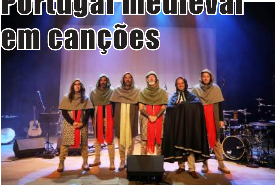
Os elementos do projeto

O projeto “Gardunhos – Portugal medieval em canções” estreou-se no passado fim de semana com dois concertos no Auditório Municipal Casa da Música, no âmbito do Mercado Medieval de Óbidos.