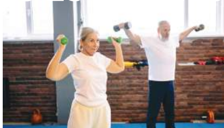
Os Pimpões irão promover atividade física a todos os seniores das Caldas