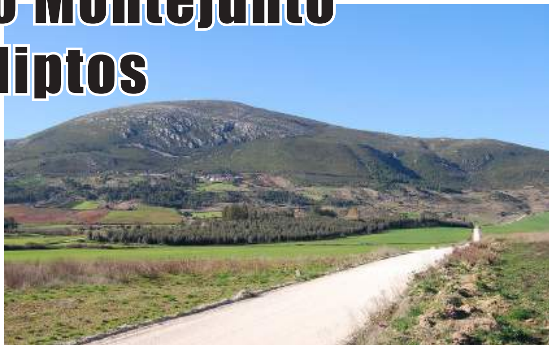
Povoamentos de eucalipto dificultam controlo de incêndios, sustentou a Alambi

Em breve será anunciada nova data para assinalar a efeméride.