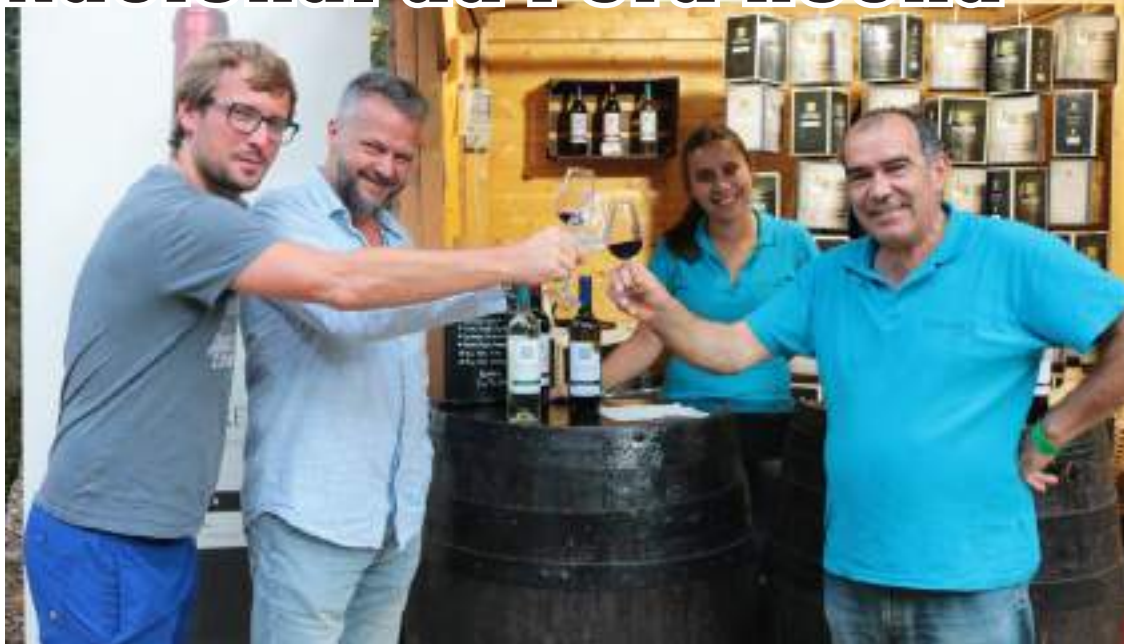
Evento vai voltar a animar a Mata Municipal do Bombarral

No dia 10 de agosto tem início o 37º Festival do Vinho Português e 27ª Feira Nacional da Pera Rocha. O certame, que promove os dois principais setores económicos do concelho do Bombarral, irá decorrer até dia 15 de agosto na Mata Municipal.