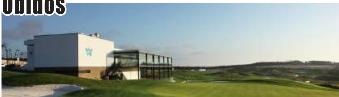
Campo de golfe do Royal Óbidos SPA & Golf Resort

As inscrições estão abertas até dia 9 de agosto, às 17 horas, pelo telefone 262965220.