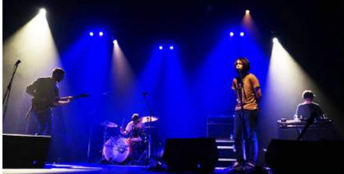
Registo discográfico de Cave Story, banda rock formada nas Caldas, é um dos projetos

A Sociedade Filarmónica de Alvorninha, a comemorar o centenário, pretende promover a descentralização cultural, levando a sua música a lugares cada