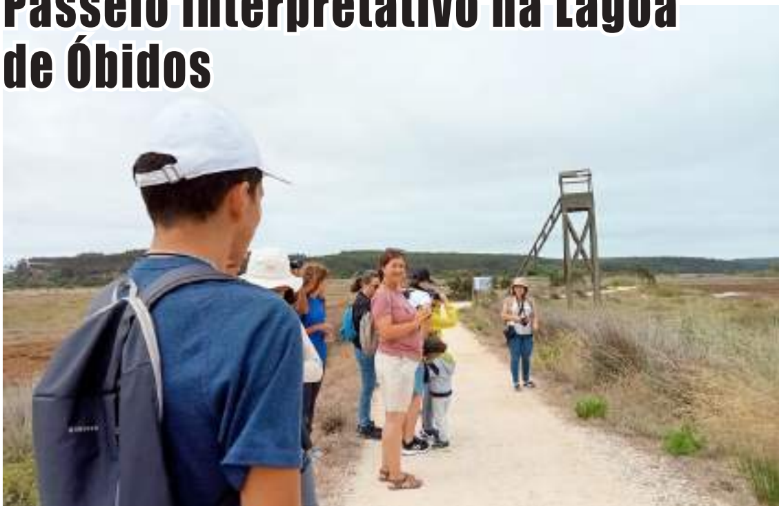
Passeio à descoberta das maravilhas naturais da Lagoa

Para comemorar o Dia Mundial da Conservação da Natureza a associação Pato realizou a 28 de julho um passeio interpretativo à descoberta das maravilhas naturais da Lagoa de Óbidos, guiado pela Associação de Defesa do Paul de Tornada – PATO e