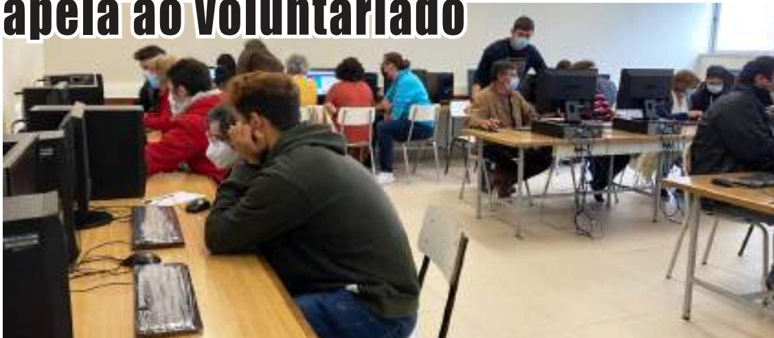
Capacitação digital com o apoio de jovens do Externato Cooperativo da Benedita

A Universidade Sénior da Benedita concluiu mais um ano, apontando para a próxima época aumentar o número de alunos, tentando resolver o problema da falta de transporte e contar com mais professores e colaboradores voluntários.