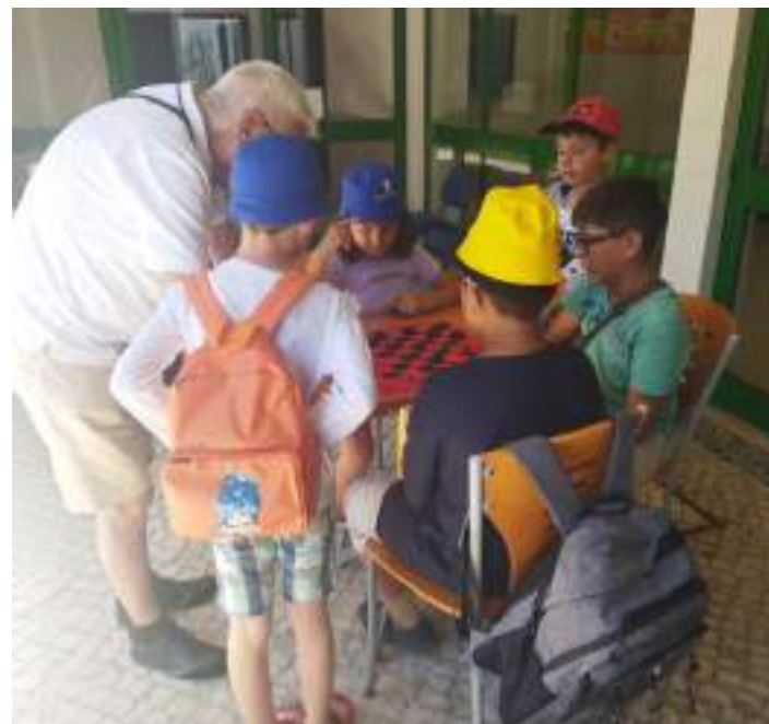
Encontro geracional na Universidade Sénior das Caldas da Rainha

O Dia dos Avós foi celebrado a 26 de julho nas Caldas da Rainha, numa iniciativa que associou o Município, através da Unidade de Desenvolvimento Humano, a Universidade Sénior e o CLDS 4G, com uma tarde de convívio entre seniores e as crianças participantes nas Atividades de Tempos Livres dinamizadas nos meses de verão pelo Município.