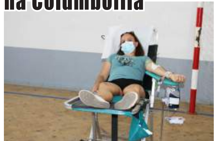
Dadores na Sociedade Columbófila Caldense

Foi realizada na passada segunda-feira uma recolha de sangue e dadores de medula óssea na Sociedade Columbófila Caldense, nas Caldas da Rainha.