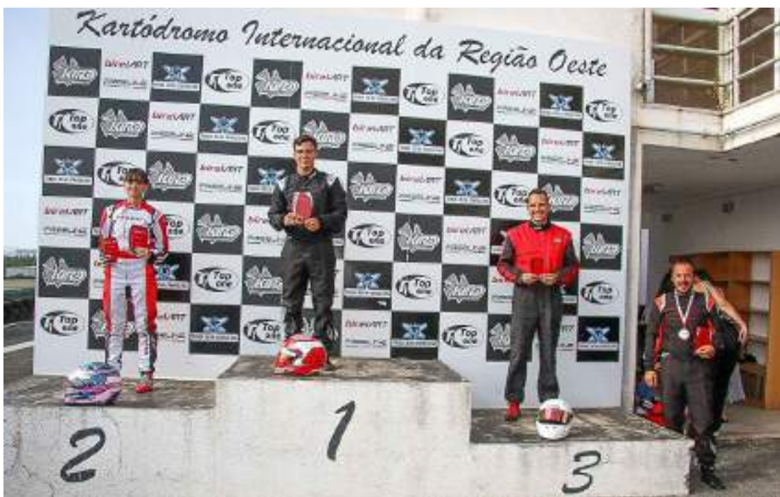
Pódio geral da categoria Easykart 125 (a partir dos 14 anos)

va portuguesa – foi o mais rápido nos treinos cronometrados com o registo de 51,726s e depois venceu quer a primeira Corrida de Qualificação quer a segunda.