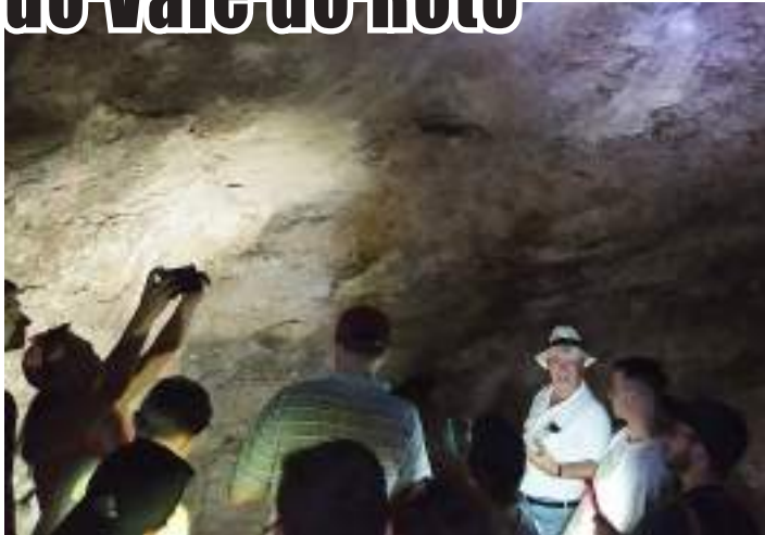
Organização da Associação de Defesa do Património Cultural do Concelho do Bombarral

Uma participação muito concorrida marcou a segunda visita guiada organizada pela ADPCCB – Associação de Defesa do Património Cultural do Concelho do Bombarral.