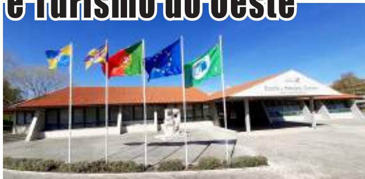
As candidaturas podem ser realizadas presencialmente na secretaria, em Caldas da Rainha

A EHTO está a preparar o próximo ano letivo 2022/2023 com o grande objetivo de “responder aos desafios do desenvolvimento económico, social e ambiental em todo o território nacional, con-