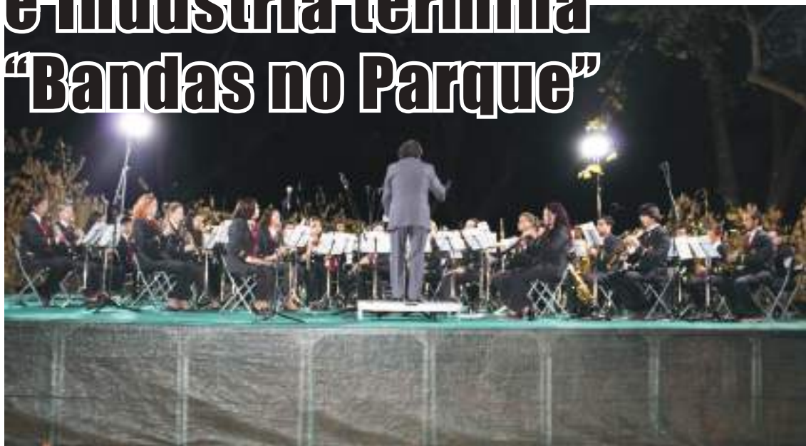
Banda Comércio e Indústria

A iniciativa "Bandas no Parque", organizada pela União de Freguesias de Nossa Senhora do Pópulo, Coto e São Gregório, contou no passado sábado com a última atuação.