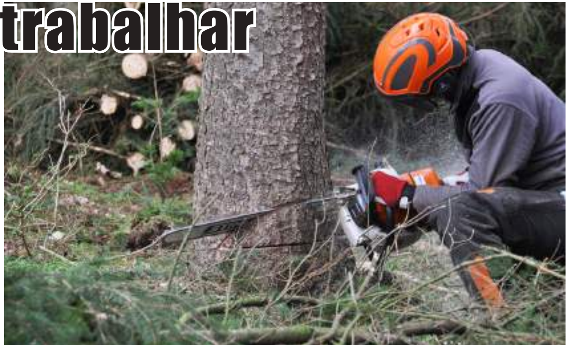
Durante cerca de duas semanas estiveram proibidos trabalhos florestais com recurso a maquinaria

E exemplificou o que representa a paragem de uma semana de trabalho para estas empresas: “Falando no grupo da APAS Floresta, semanalmente os custos fixos atendendo ao tipo de empresa podem variar entre os 5.000€ e os 35.000€ (desde pequenas empresas a médias