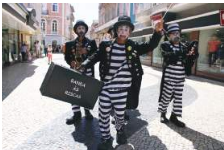
Banda às Riscas