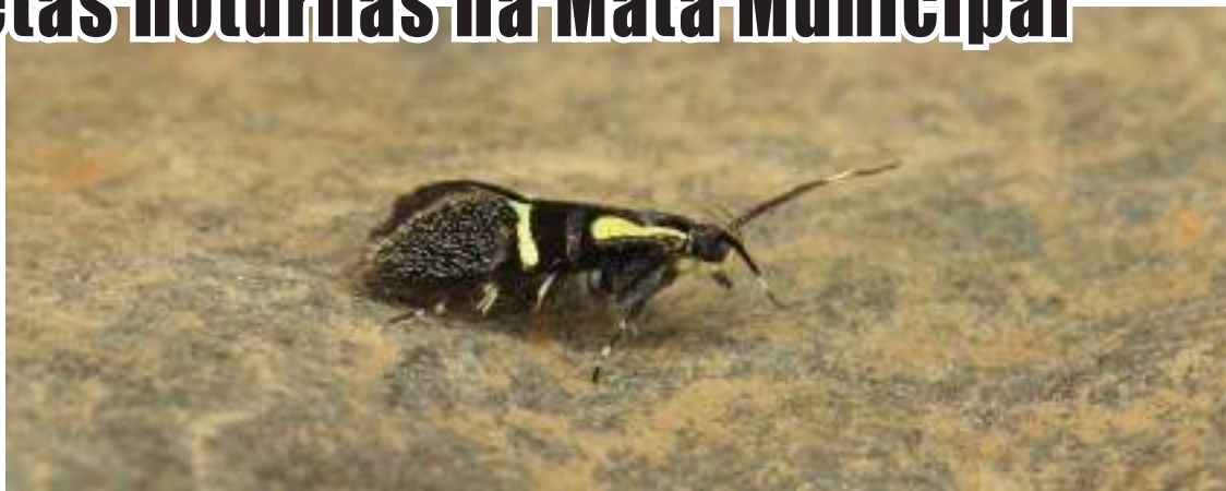
Micro borboleta com cerca de 8mm de comprimento

Em Portugal existem mais de 2800 espécies de borboletas conhecidas. Ao contrário das borboletas diurnas, o estudo das borboletas noturnas pode ser realizado com recurso a um método passivo de elevado sucesso, e que se apoia na sua atração com recurso a armadilhas lumi-