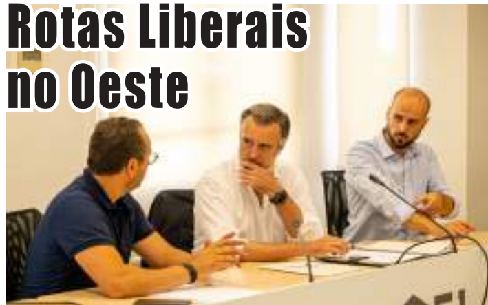
Líder da Iniciativa Liberal, João Cotrim Figueiredo, ao centro

Nos dias 16 e 17 de julho realizaram-se as rotas liberais da Iniciativa Liberal na região de Leiria e do Oeste, com a presença do líder João Cotrim Figueiredo e de autarcas.