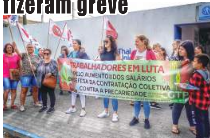
Concentração à porta da empresa

Os trabalhadores da conserveira ESIP, em Peniche, levaram a cabo uma greve no dia 29 de julho, tendo-se concentrado à porta da empresa de manhã.