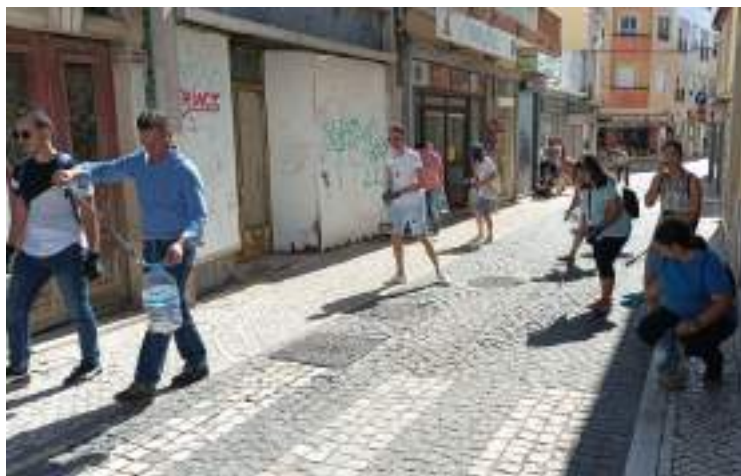
Voluntários em ação

“As pontas de cigarro não foram deitadas fora. Estão a ser recolhidas para um evento que