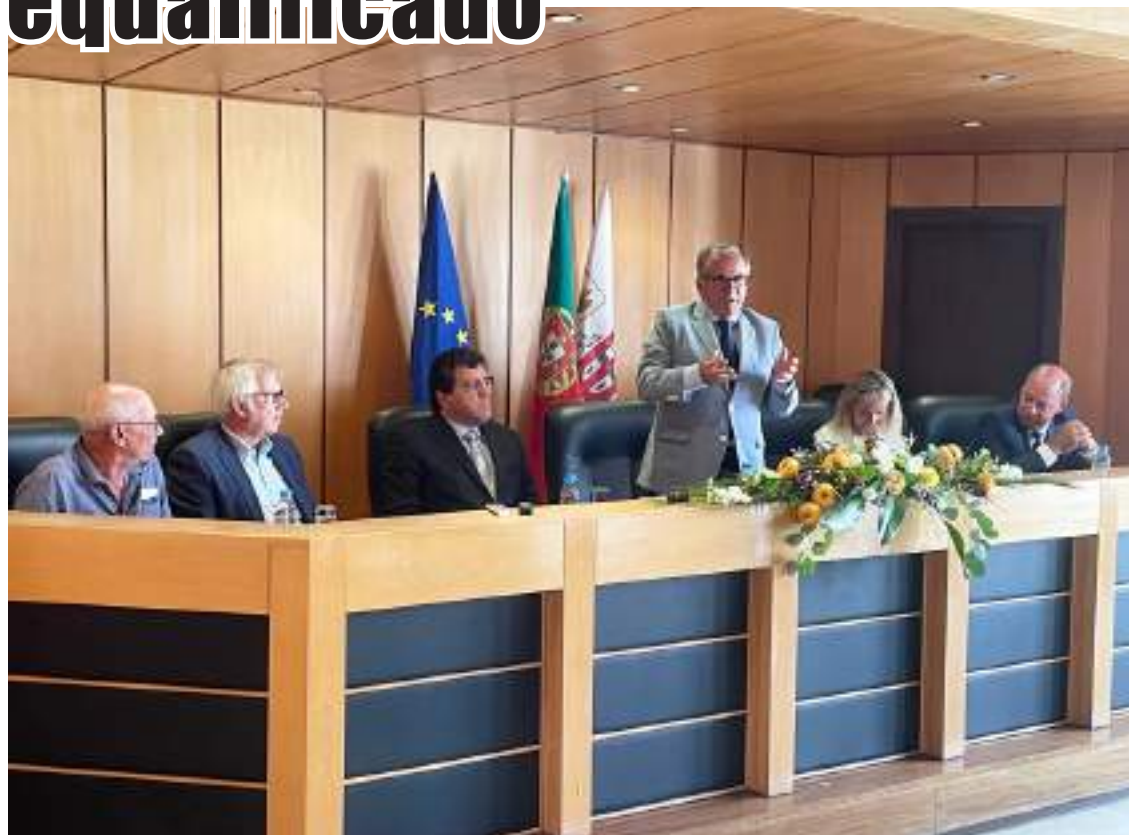
A cerimónia de assinatura do contrato-programa foi presidida pelo secretário de Estado Carlos Miguel

O governante referiu ainda que no próximo Portugal 2030 as juntas de freguesia e associações vão ter acessos a fundos comunitários. “As juntas de freguesia vão ter acesso a fundos para obras que estejam dentro das suas competências e um dos primeiros avisos que vai sair é para a instalação de espaços de cidadão nas sedes das juntas de freguesia, de forma a que os fregueses ali possam tratar da renovação da carta de condução, cartão do cidadão, tirar o registo criminal, entre outros serviços”. “É a nossa ambição que a médio, longo prazo, todas as juntas tenham um espaço do cidadão”,