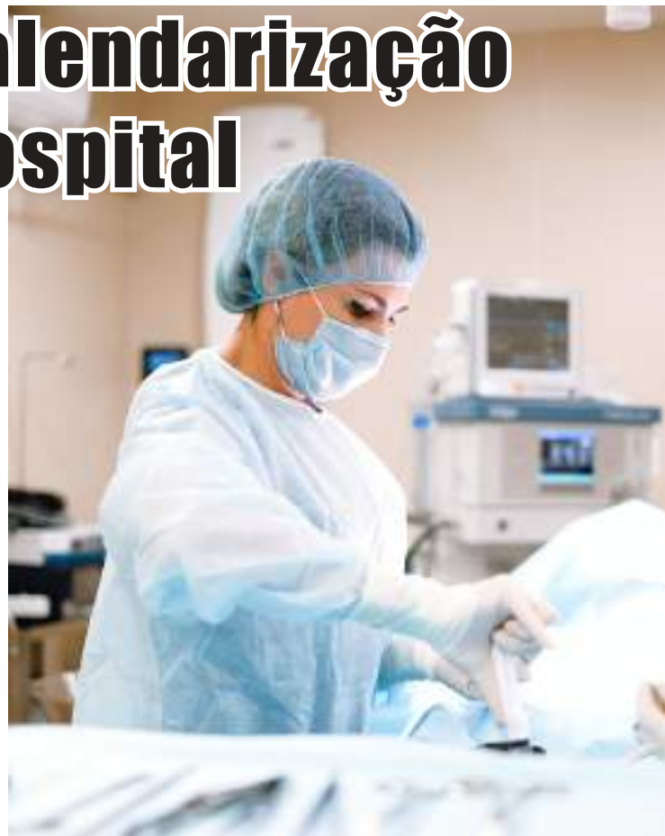
Não está garantido que o Orçamento de Estado de 2023 contemple o novo hospital

Na sequência dessa interpelação foi entretanto lançado con-