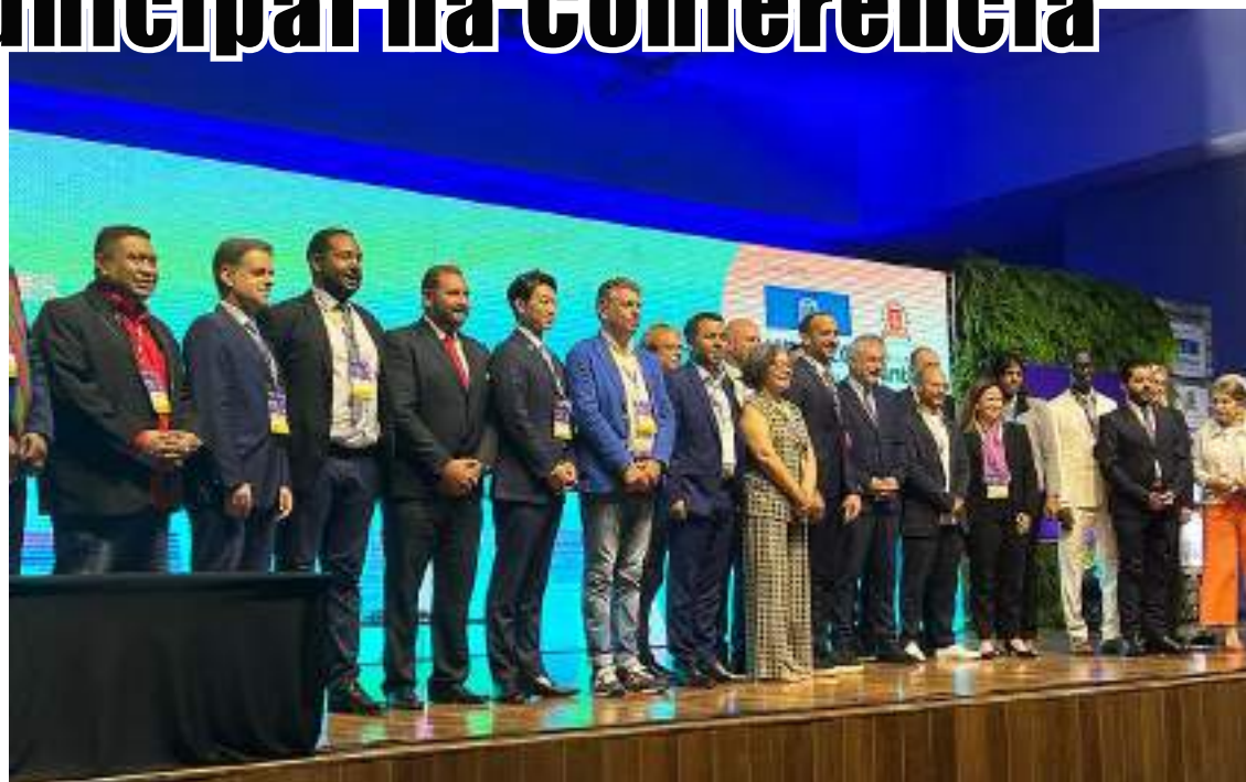
Participação na Conferência da Rede de Cidades Criativas da UNESCO

A representação nacional contou ainda com autarcas de Amarante, Barcelos, Braga, Covilhã e Santa Maria da Feira.