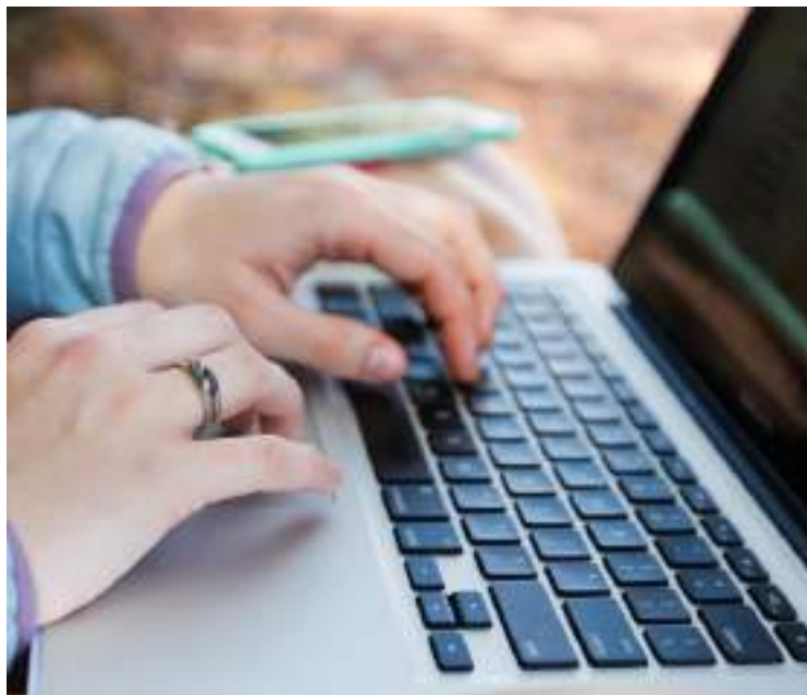
Banda larga móvel a 100 Mbps vai ser garantida por MEO e Vodafone

No âmbito do processo de renovação, até 2033, dos direitos de utilização de frequências (DUF) da MEO e da Vodafone nas faixas dos 900 MHz e 1800 MHz, a ANACOM (Autoridade Nacional de Comunicações) impôs a estes operadores obrigações adicionais de cobertura em 100 freguesias de menor densidade populacional, que não estão